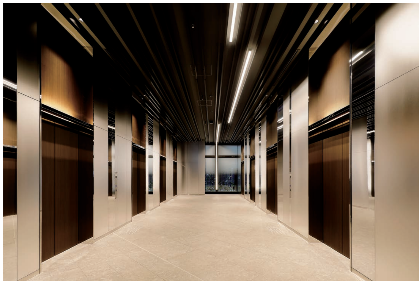
乗用24人乗りエレベーター・1階ホール

東海道、山陽新幹線が発着する関西の玄関口、新大阪駅近くに10年ぶりの大型オフィスビルとして「新大阪第2NKビル」が誕生。貸室には、自然換気装置や抗ウイルスの壁紙等、エレベーターには非接触ボタンや混雑お知らせブザー等を採用、衛生面に配慮した感染症対策がなされています。また、アフターコロナを見据えて、多様な働き方を支援する専用ラウンジや貸会議室を備えています。