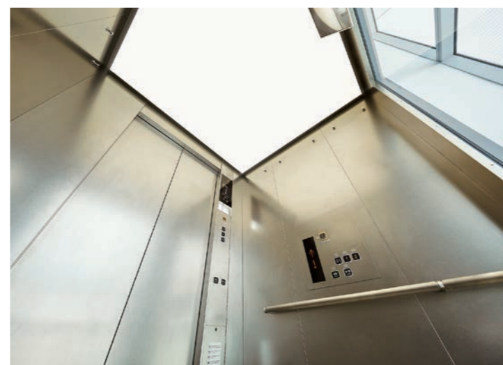
乗用(展望用)15人乗りエレベーター・かご室天井