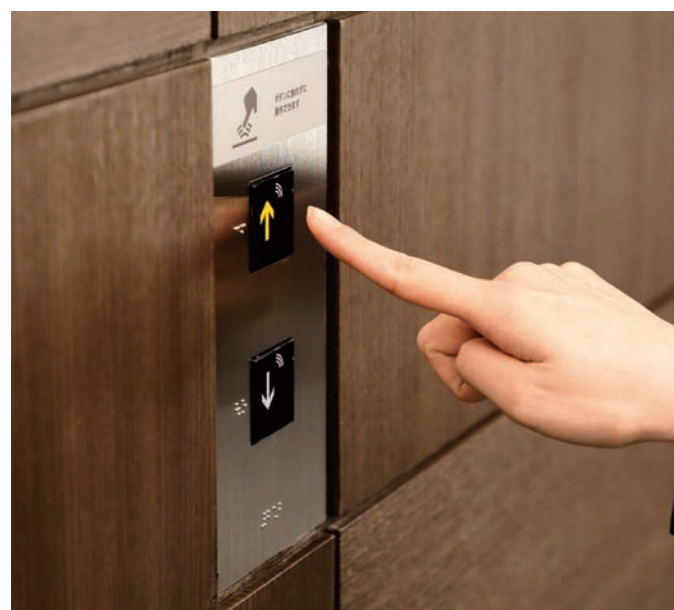
乗用24人乗りエレベーター・のりば操作盤(非接触ボタン)