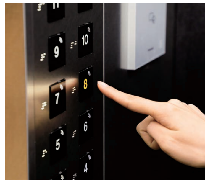
乗用24人乗りエレベーター・非接触ボタン(かご操作盤)