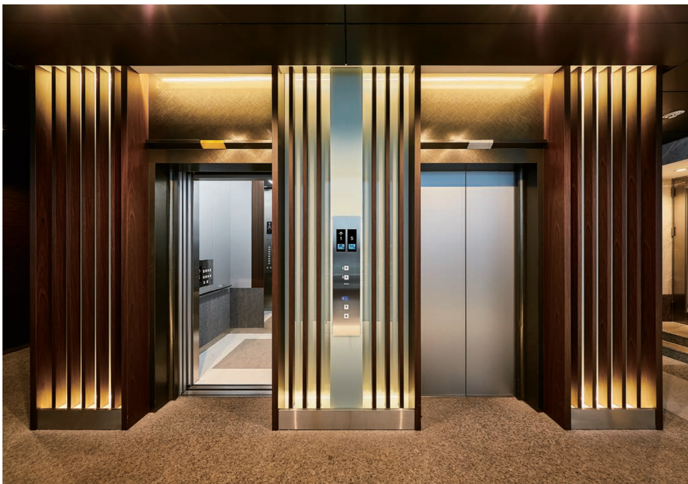
乗用13人乗りエレベーター・1階ホール(リニューアル後)

「ジオ八丁堀」はJR京葉線、地下鉄日比谷線の八丁堀駅より徒歩2分、宝町駅や茅場町駅からもアクセス可能な利便性の高いオフィスビルです。地上9階、地下1階、石張り外装を基調とした風格のある外観と新たに改装されたエントランスホールは、自然光と木調も混えたハイセンスな仕上がりで、今回リニューアルされた2台のエレベーターと合わせて快適なオフィスライフをサポートします。