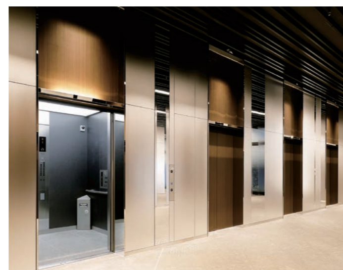
乗用24人乗りエレベーター・1階ホール