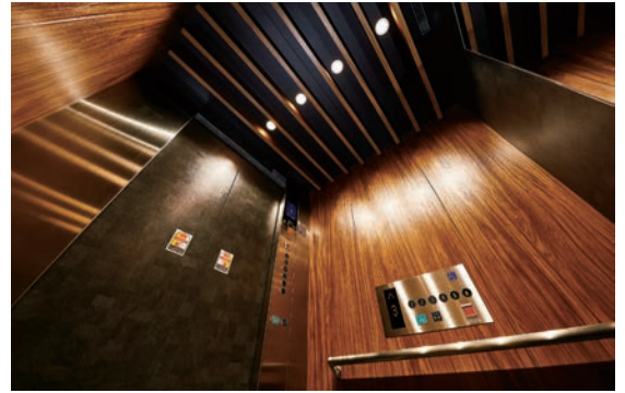
乗用15人乗りエレベーター・かご室天井