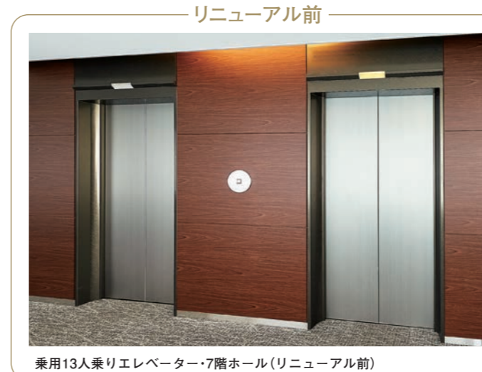
乗用13人乗りエレベーター・7階ホール(リニューアル前)