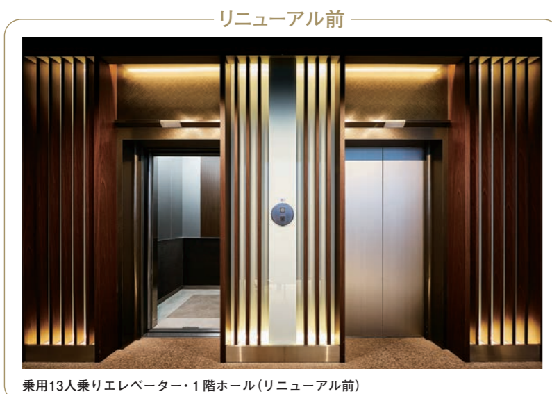
乗用13人乗りエレベーター・1階ホール(リニューアル前)