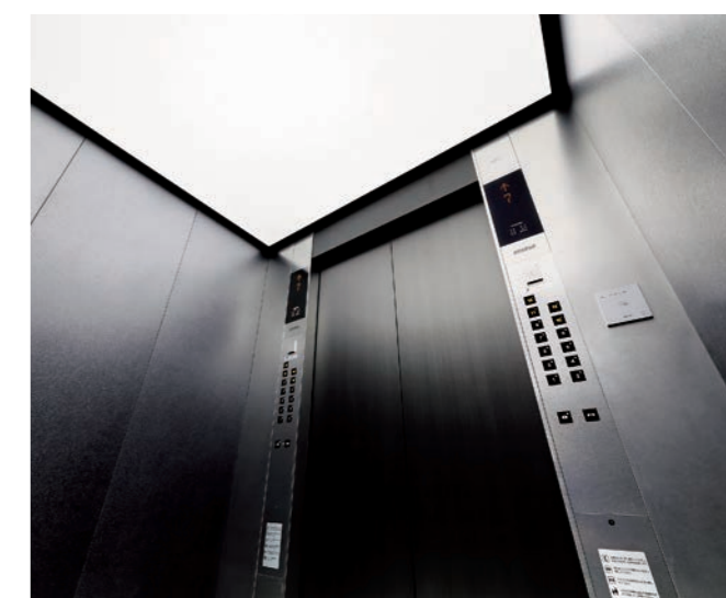
乗用24人乗りエレベーター・かご室天井