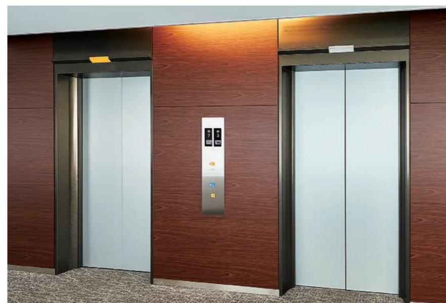
乗用13人乗りエレベーター・7階ホール(リニューアル後)