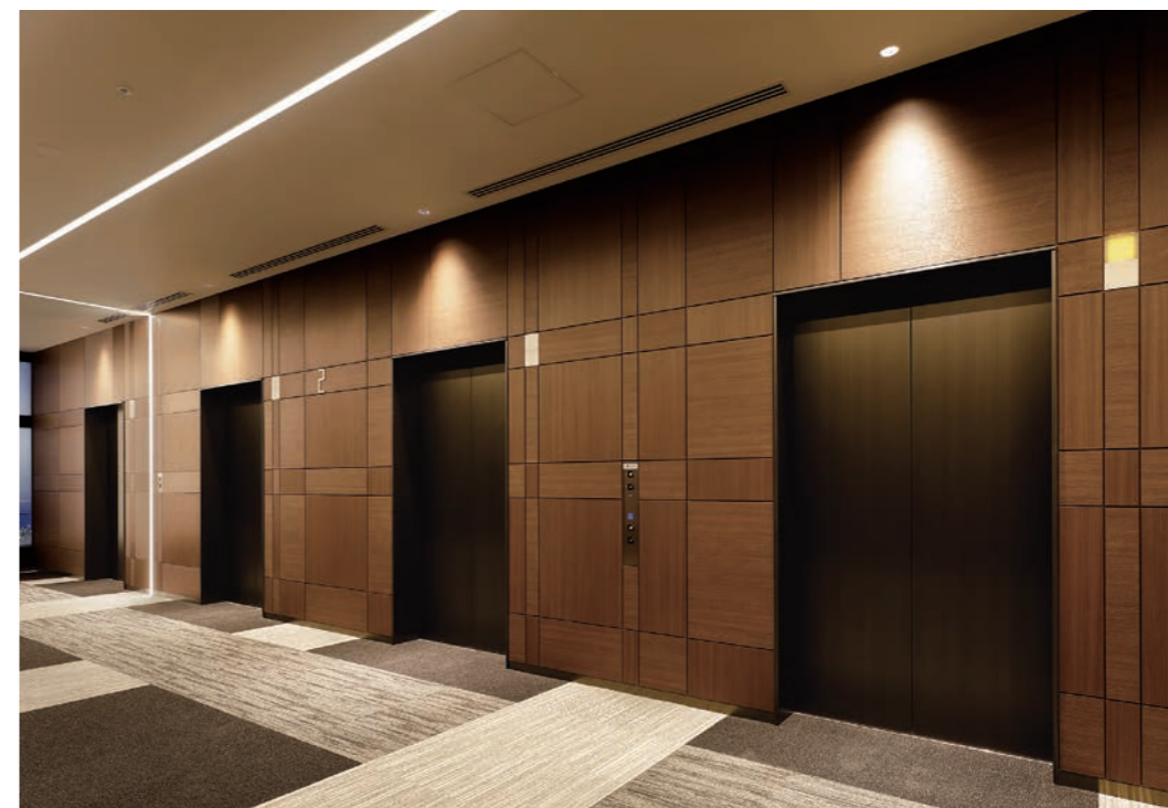
乗用24人乗りエレベーター・2階ホール