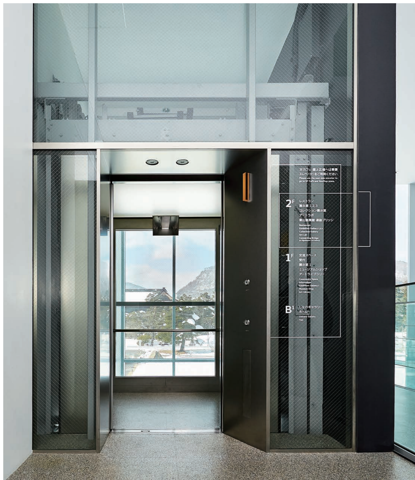
乗用(展望用)15人乗りエレベーター・2階のりば(展望窓から雪の善光寺を望む)

半世紀余りにわたり親しまれてきた「長野県信濃美術館」が建て替え工事を終え「長野県立美術館」としてオープンしました。地上2階、地下1階建ての建物からは、善光寺周辺の見事な景色を一望できる、自然と一体となった美術館です。信州の風景画や長野県にゆかりのある作家の作品などを公開しており、東山魁夷の作品を収蔵した東山魁夷記念館も併設されています。