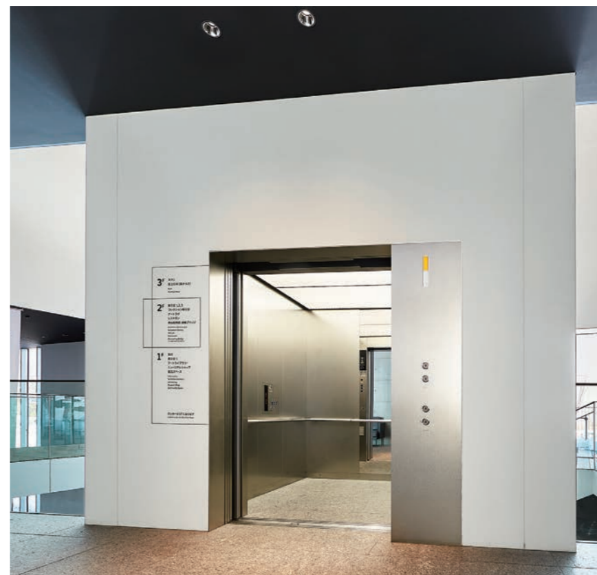
乗用30人乗りエレベーター・2階のりば