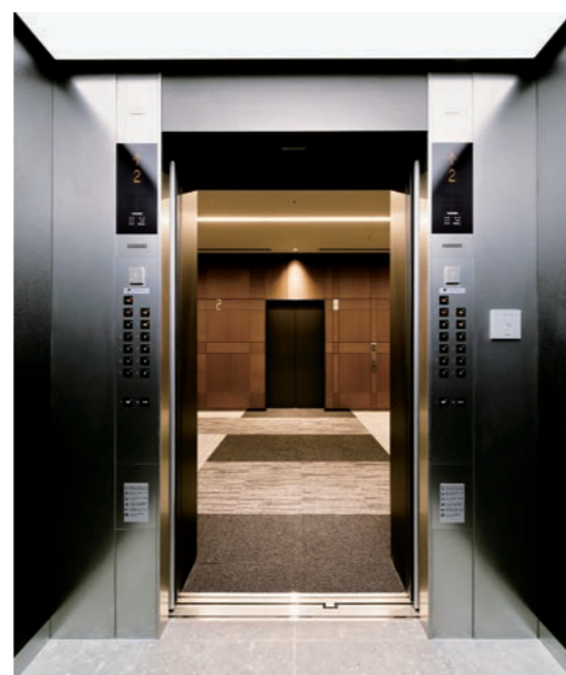
乗用24人乗りエレベーター・かご室