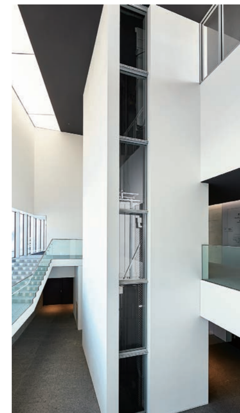
乗用30人乗りエレベーター・昇降路