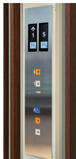
ホール液晶インジケータボタン1階(リニューアル後)