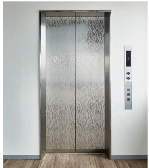
乗用15人乗りエレベーター・3階