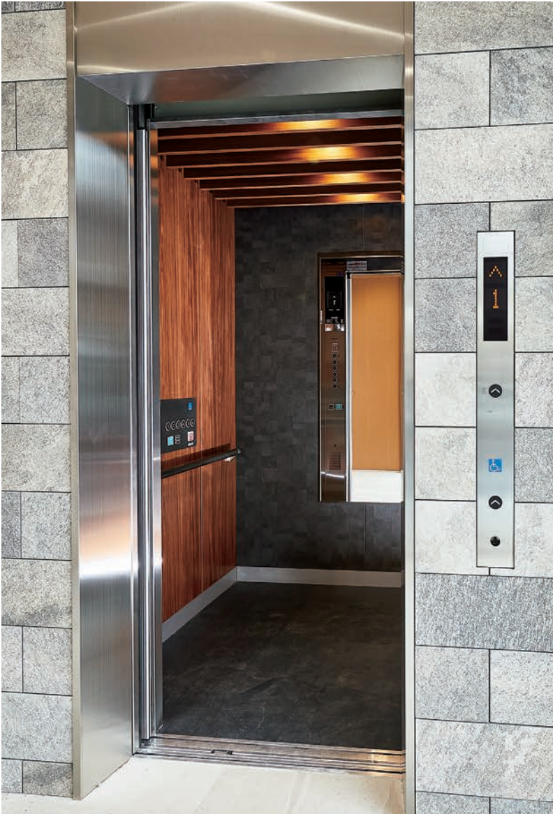
乗用15人乗りエレベーター・1階

東京・埼玉を中心に不動産売買や仲介事業などを展開している「エステート白馬 本社」が、新しく生まれ変わりました。今年設立30周年を迎えるエステート白馬は「こころとカラダにうれしい暮らし」をテーマに、住みやすい住環境サービスを提供しています。新本社の建築デザインに合った、新デザインのルーバー天井と2種類の側板を組み合わせたツートンインテリアが、高級感アップに貢献しています。