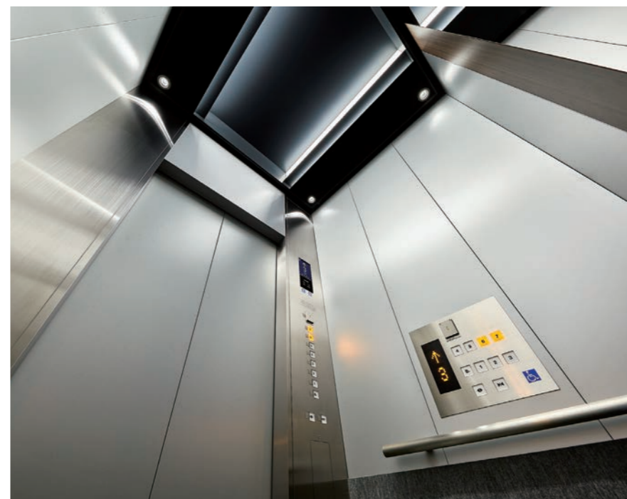
乗用13人乗りエレベーター・かご室天井(車いす兼用エレベーター仕様リニューアル)