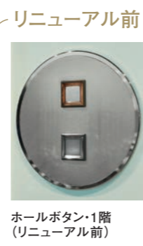
ホールボタン・1階(リニューアル前)