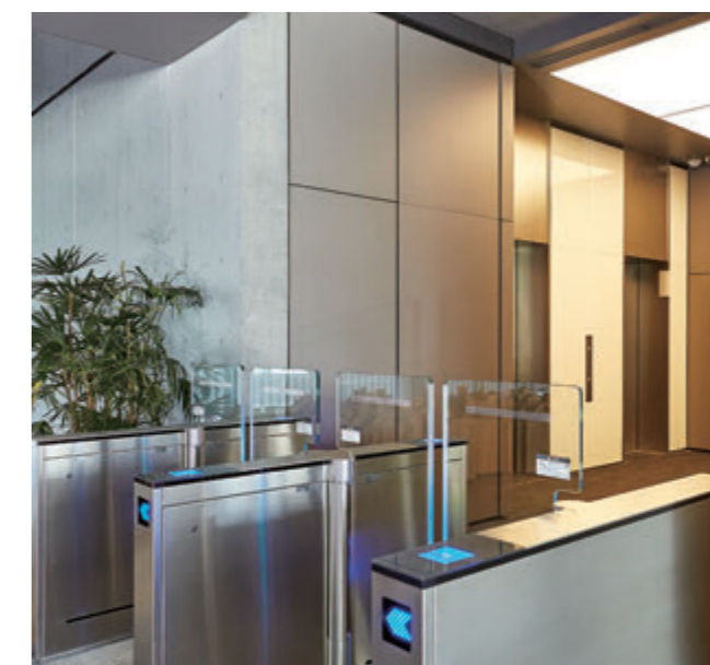
乗用15人乗りエレベーター・1階ロビーから望む