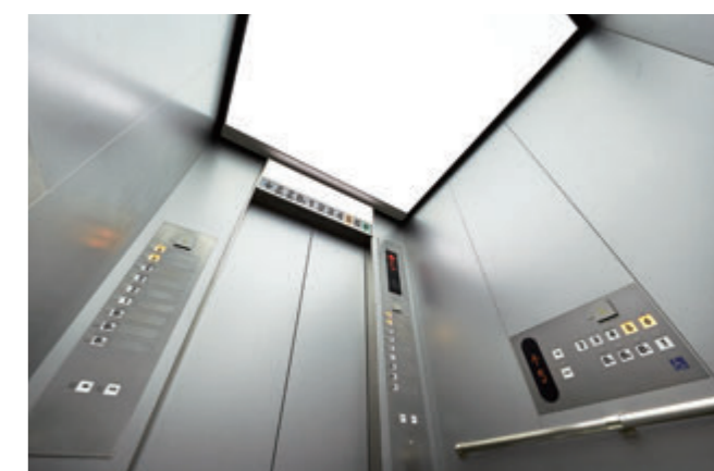
乗用24人乗りエレベーター・かご室天井