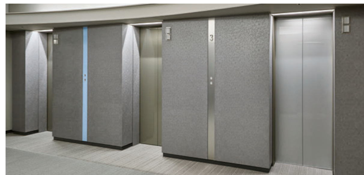
乗用24人乗りエレベーター・3階のりば(右:リニューアル後 左2台:リニューアル前)