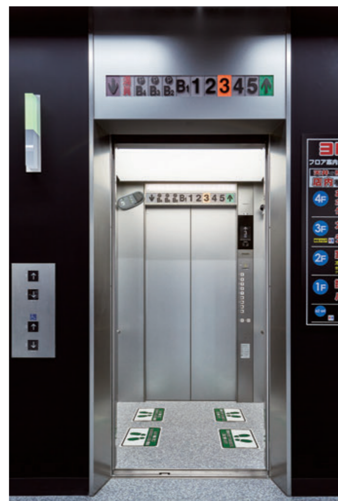
乗用15人乗りエレベーター・かご室