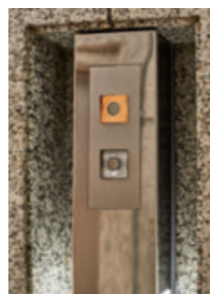
ホールボタン・1階(リニューアル前)