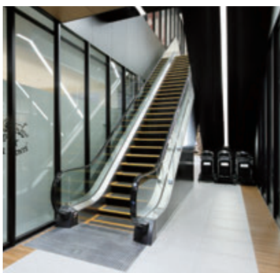
エスカレーター・1階