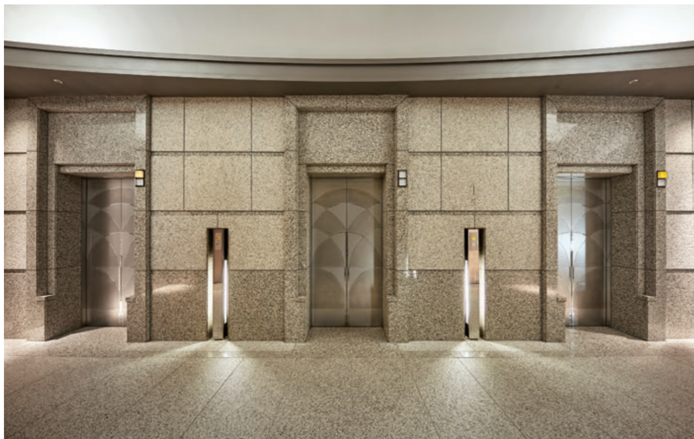
乗用24人乗りエレベーター・1階ホール

いすゞ自動車本社・工場跡地の再開発で建設された大森ベルポート。JR大森駅から徒歩3分、京浜急行本線 大森海岸駅から徒歩4分の場所に位置する、オフィスビルやアトリウム、商業施設を含む複合施設です。1991年に竣工された、地上18階、地下3階のオフィスビルのA棟のエレベーターがこのたびリニューアル。かご室の内装も時代を超えたミニマルなデザインに一新。使い心地や快適性が向上しました。