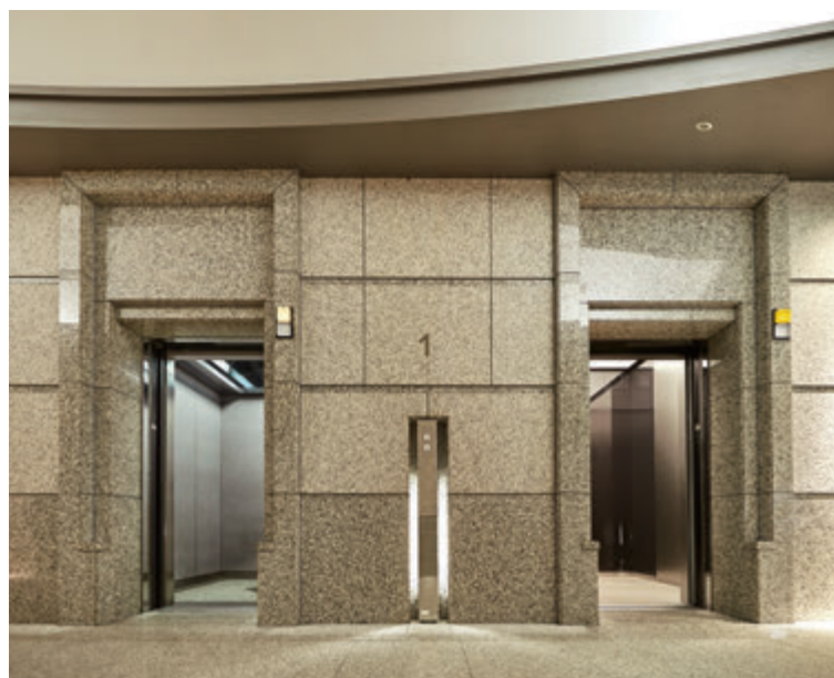
乗用24人乗りエレベーター・1階ホール(左:リニューアル前 右:リニューアル後)