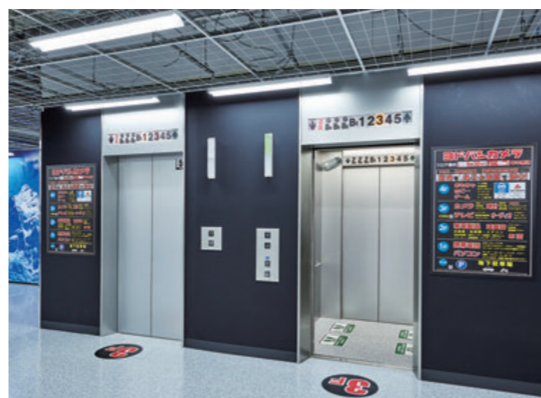
乗用15人乗りエレベーター・3階エレベーターホール