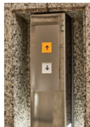
ホールボタン・1階(リニューアル後)