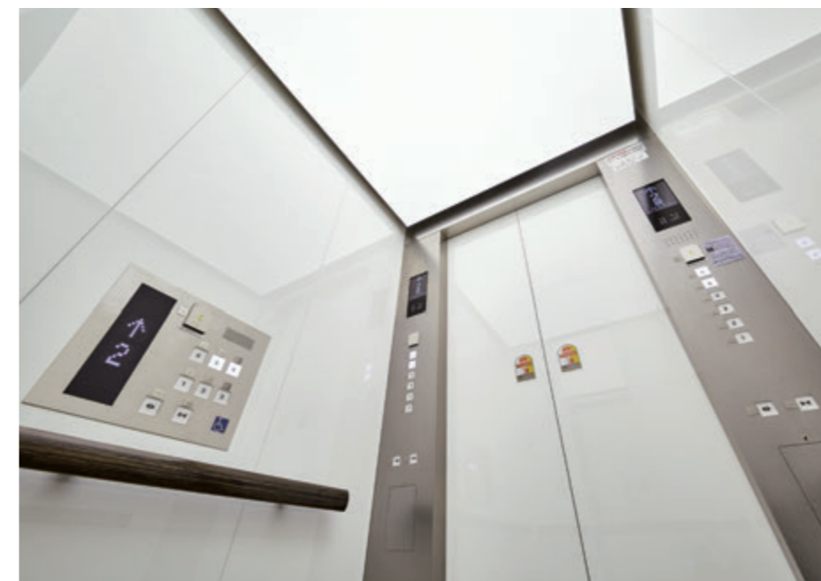
乗用15人乗りエレベーター・かご室天井