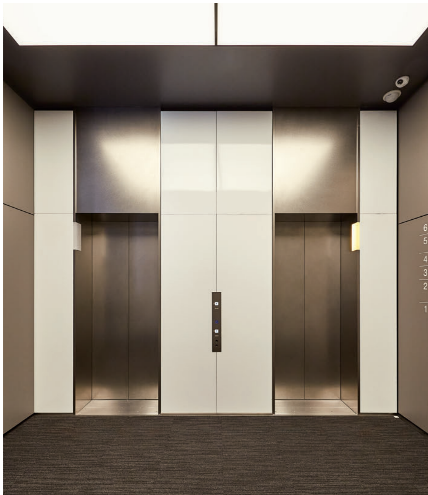
乗用15人乗りエレベーター・1階エレベーターホール

仙台市青葉区に「省エネ」「事業継続」「快適性」を主テーマに設計された地上6階、地下1階建ての「清水建設 東北支店」新社屋が竣工しました。仙台七夕祭りの吹き流しをモチーフとした外壁のガラスが目立つ外観となっています。建物本体は持続継続性の為に(柱頭)免震構造を採用、エレベーターは吊下げ形式とし安全性を確保しています。空調には仙台平野の豊富な地下水を利用したシステムを採用し、省エネルギーに貢献しています。