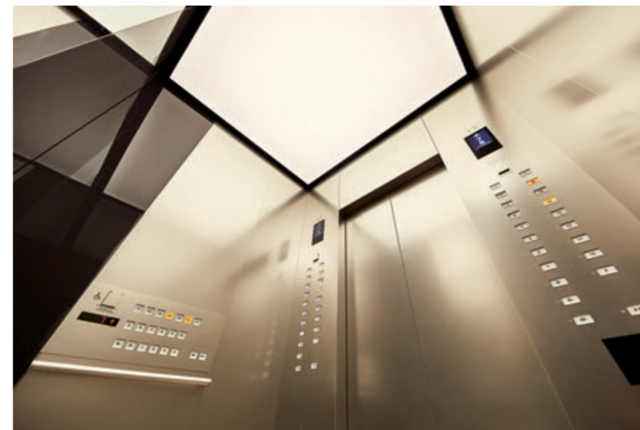
乗用24人乗りエレベーター・かご室天井(リニューアル後)