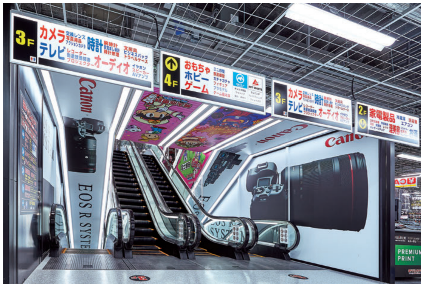
エスカレーター・3階のりば

山梨県に初出店、売場面積13,800㎡、カメラ、AV機器、家電、日用品など地域最大級の品揃えを誇ります。店舗は、新型コロナウイルス感染症対策として「光触媒技術による除菌・脱臭機能付きLED照明器具」を採用し、「やまなしグリーン・ゾーン認証施設」として登録されています。また、甲府市と連携しエリアマネジメント活動を通じて、まちの賑わいを創出すべく官民連携のまちづくり事業に参画していきます。