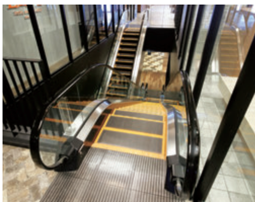
エスカレーター・7階