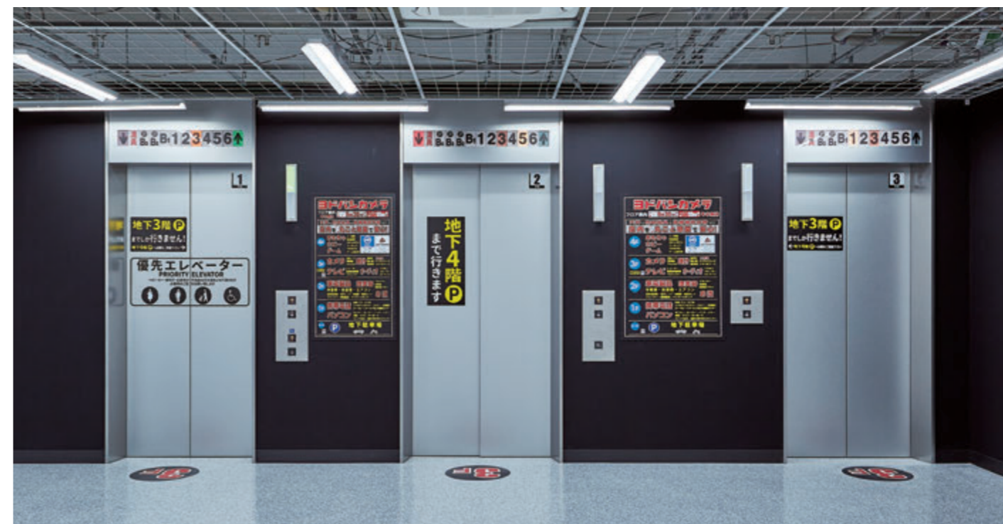
乗用24人乗りエレベーター・3階エレベーターホール