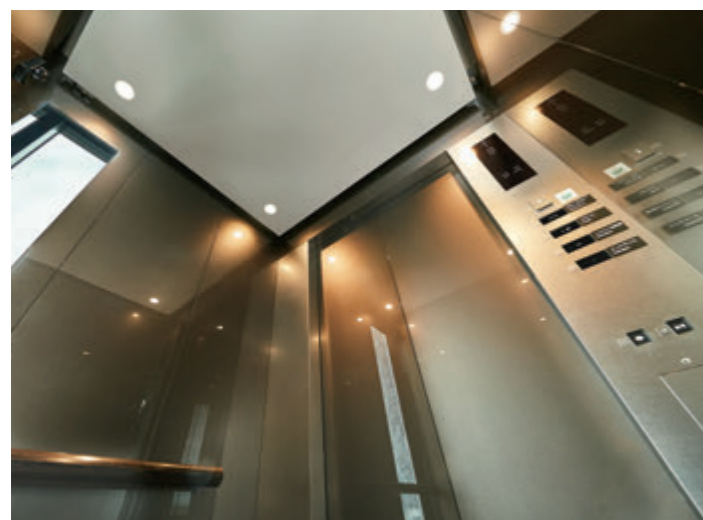
展望用15人乗りエレベーター・かご室天井(レムプラス神戸三宮)