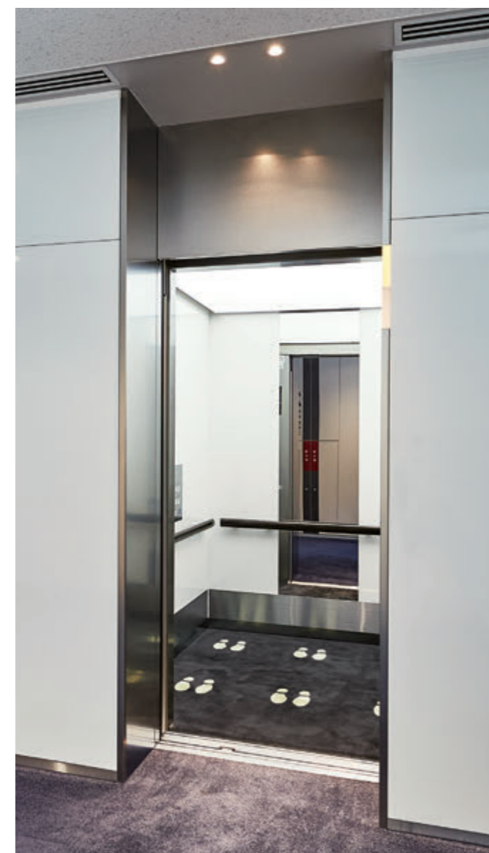
乗用15人乗りエレベーター・かご室