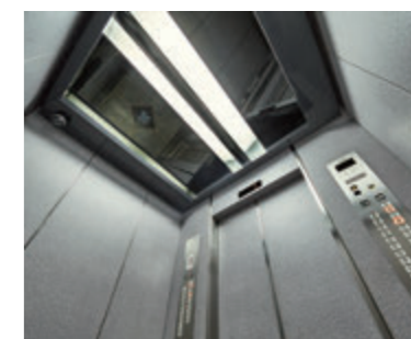
乗用24人乗りエレベーター・かご室天井(リニューアル前)