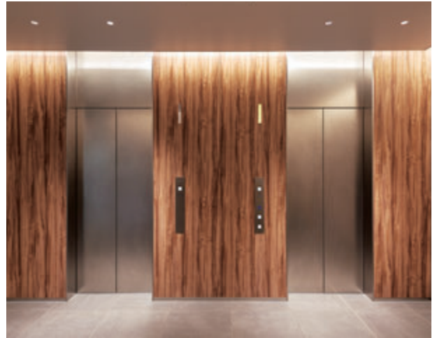
乗用13人乗りエレベーター・20階エレベーターホール