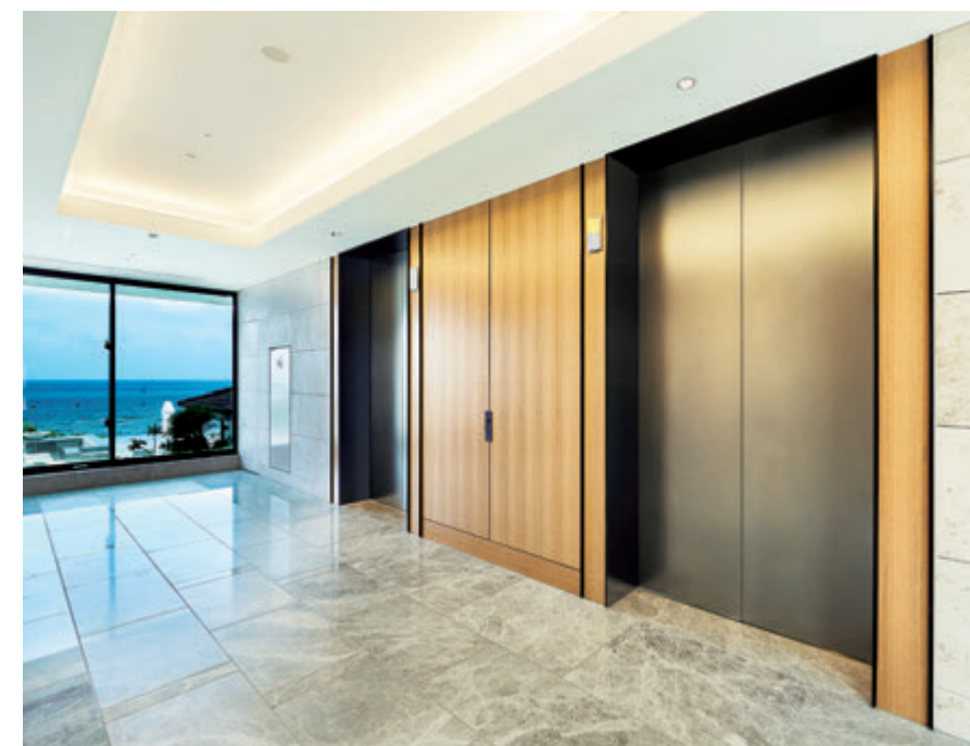
乗用20人乗りエレベーター・5階エレベーターホール(サンセットウイング)