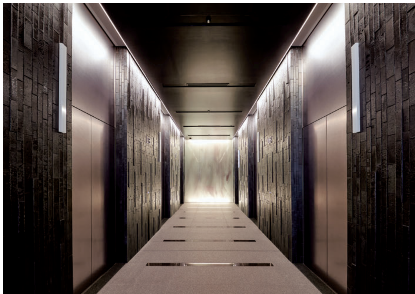
乗用20人乗りエレベーター・ロビー階エレベーターホール

西新宿の公園通り、東京メトロ丸の内線「西新宿駅」や都営大江戸線「都庁前駅」からも近い好立地に、大和ハウスの大型オフィスプロジェクト「Dタワー」の第一弾となる「Dタワー西新宿」が誕生しました。地上29階、地下2階建て、オフィスとサービスアパートメントの「Dマークス 西新宿タワー」の他に、商業施設や保育所も併設する大型複合施設です。外殻チューブ構造を採用した無柱空間により、柔軟なレイアウト変更が可能。効率・快適性が重視されたオフィスとなっています。