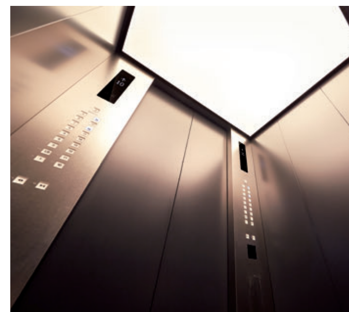
乗用20人乗りエレベーター・かご室天井