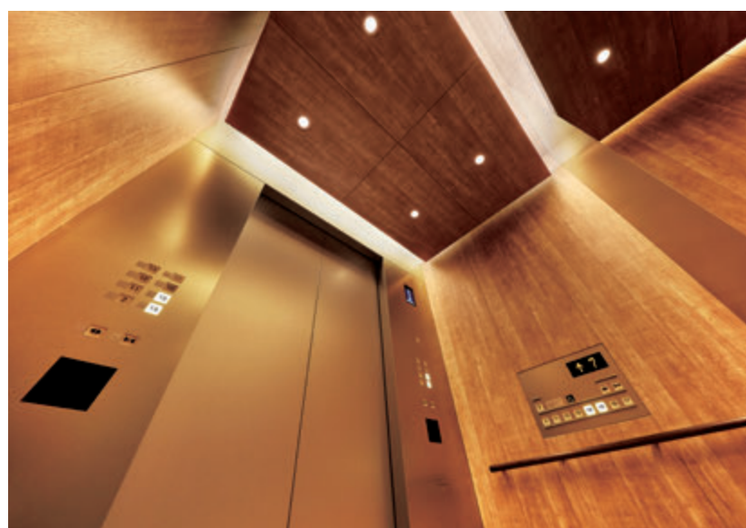
乗用24人乗りエレベーター・かご室天井