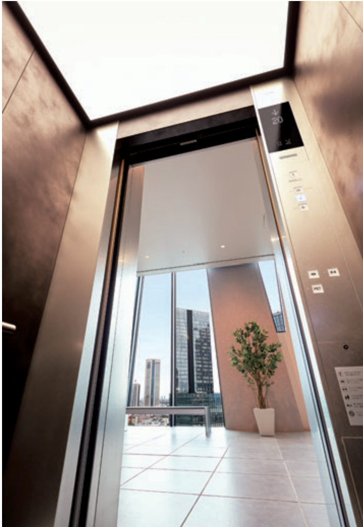
乗用13人乗りシャトルエレベーター・かご室天井

「Dマークス西新宿タワー」は「Dタワー西新宿」の20階～29階に位置する全125戸の高級サービスアパートメントです。ビジネスを主体とした中長期滞在者向けに、システムキッチンや家具、家電一式を完備。1LDK～3LDKの多彩なタイプの部屋が用意され、最短1ヶ月からの利用が可能です。多言語対応可能なコンシェルジュ、フィットネスルームやミーティングルームなど、新宿副都心らしいサービスや上質な設備とタワーマンションならではの眺望が魅力です。