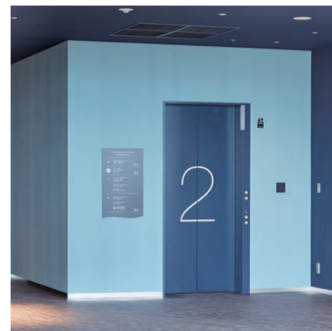
乗用17人乗りエレベーター・2階のりば