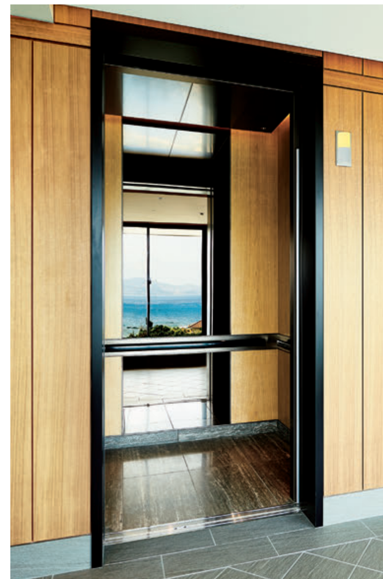
乗用20人乗りエレベーター・かご室(ビーチフロントウイング)