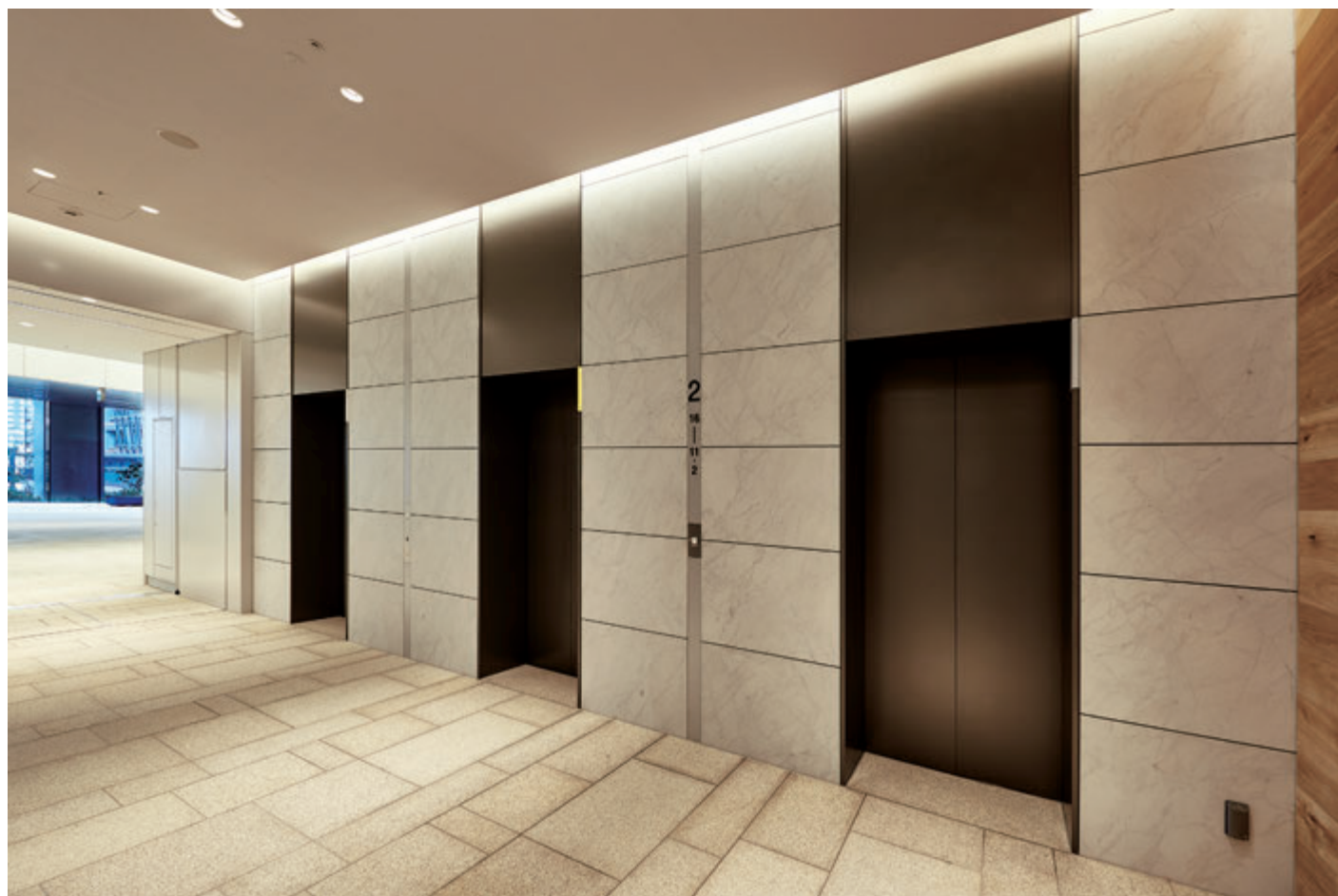
乗用24人乗りエレベーター・2階エレベーターホール

人口・世帯数が年々増加し、近年は買い物や観光などの来訪者も多い豊洲。その大規模再開発エリアに「豊洲ベイサイドクロス」がグランドオープンしました。最先端の機能を持つオフィスゾーンのほか、商業施設「ららぽーと豊洲」やホテルが入る大規模複合施設です。ゆりかもめ・東京メトロ有楽町線「豊洲」駅に直結したことで利便性も向上。豊洲エリアの玄関口としてさらなる街のにぎわいを創出します。