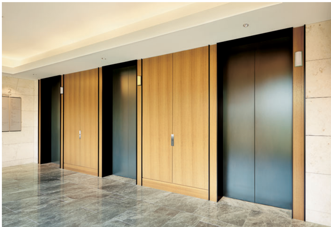
乗用20人乗りエレベーター・2階エレベーターホール(ビーチフロントウイング)

「ハレクラニ沖縄」は、ハワイを代表するラグジュアリーホテル「Halekulani（ハレクラニ）」の日本初進出のホテルです。国内屈指のビーチリゾート沖縄・恩納村に位置し、客室は全360室が海岸線に面したオーシャンビュー。プライベートプールと天然温泉を備えたヴィラ、4つのレストラン、バーなど多彩な施設も揃い、長期滞在が可能です。「ハレクラニ」とはハワイの言葉で「天国にふさわしい館」。日常から離れた特別なひとときを過ごせます。