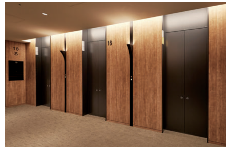
乗用24人乗りエレベーター・16階エレベーターホール