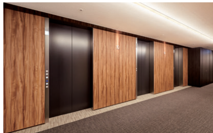
乗用20人乗りエレベーター・10階エレベーターホール