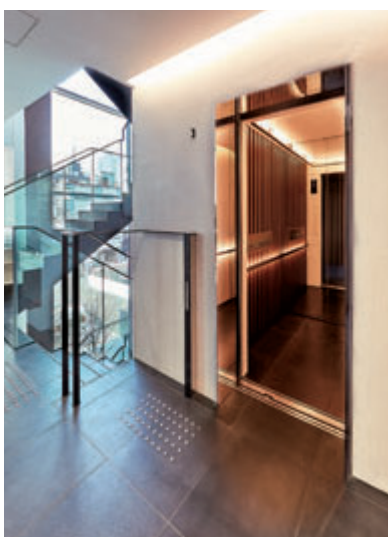
乗用13人乗りエレベーター・3階ホール