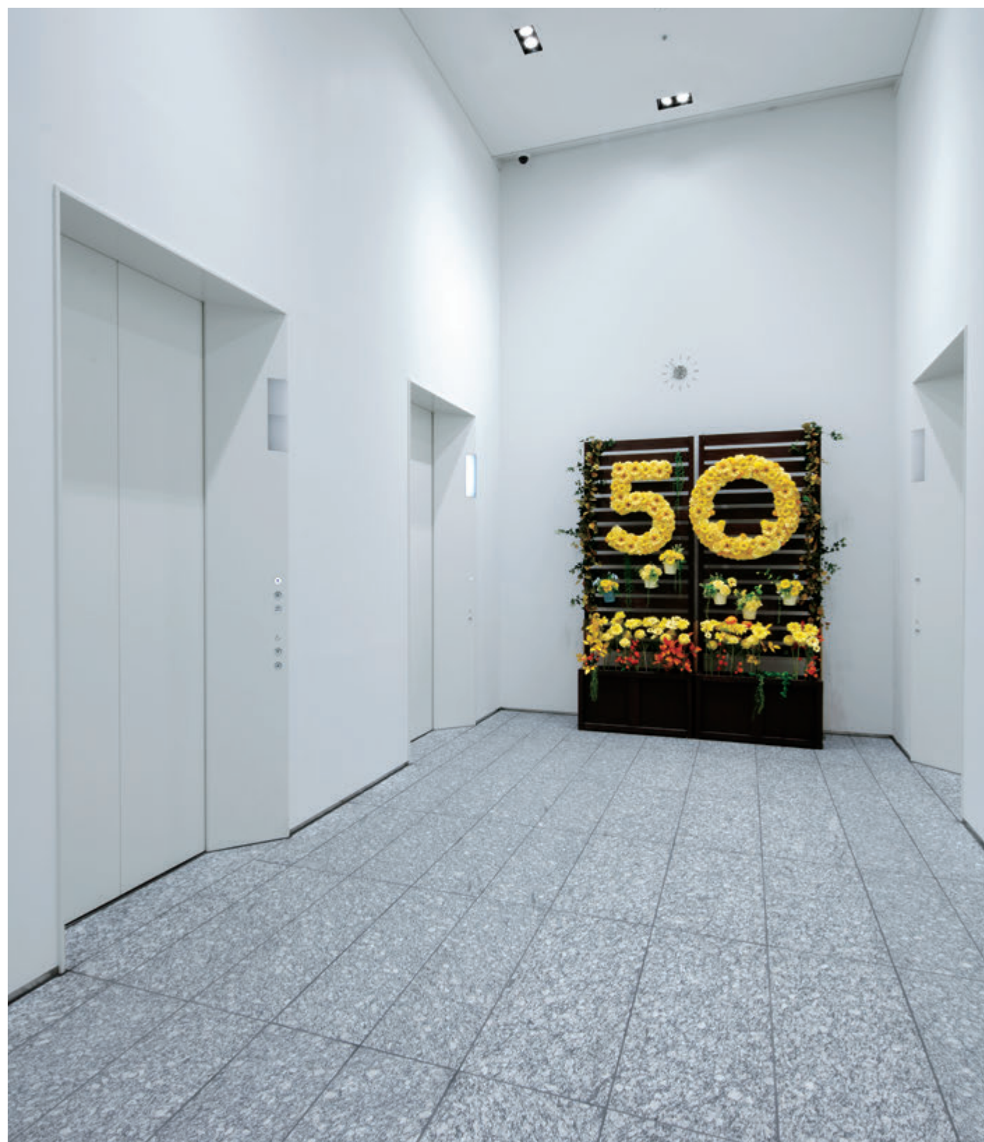
乗用15人乗りエレベーター・1階エレベーターホール(北海道テレビ放送本社)

札幌市の中心部、時計台やテレビ塔など観光スポットが点在する地下鉄大通駅近くに「さっぽろ創世スクエア」が誕生しました。地上28階、地下5階建て、文化施設とオフィスエリアで構成される複合ビルで、高層棟のオフィスエリアには開局50周年を期に本社を移転した北海道テレビ放送 (HTB) 本社が入居し、新たなランドマークとなっています。