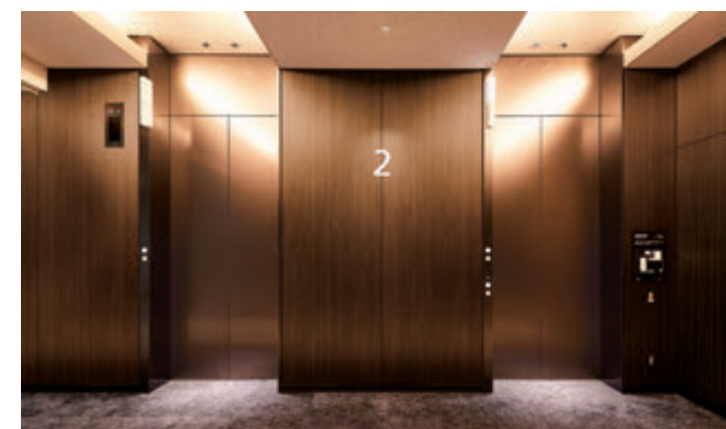
乗用19人乗りエレベーター・2階ホール