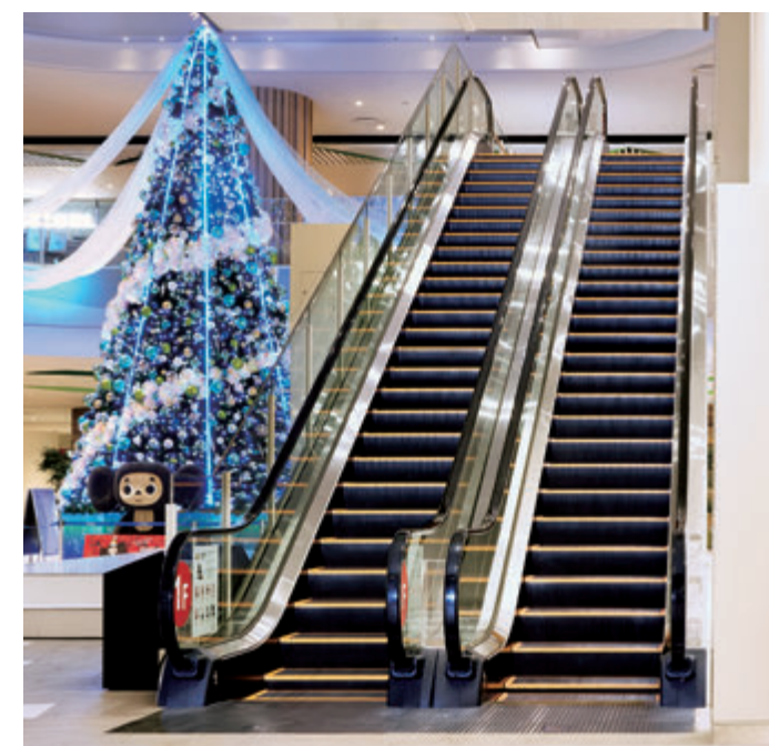
エスカレーター・1階(センターコート)