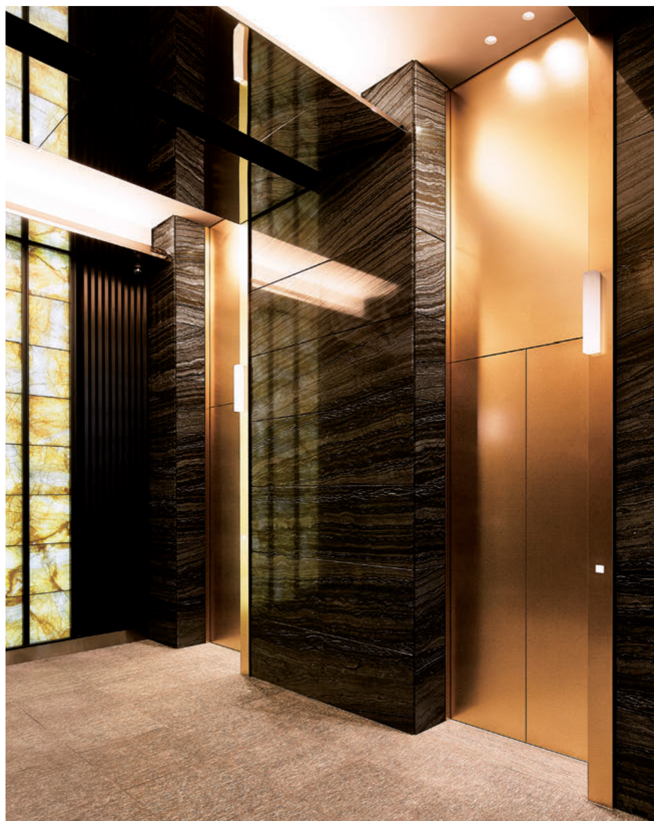
乗用19人乗りエレベーター・1階ホール

福岡県が東京での拠点として開設した、旧ふくおか会館跡地に建つ地上7階、地下1階のオフィスビルです。東京メトロ半蔵門線「半蔵門」駅より徒歩3分、皇居前という好立地に位置し、主要なビジネスエリアや国内外へのアクセスも快適です。1階には福岡県の食をはじめ、観光や伝統文化など、様々な情報を発信するレストランが出店しています。