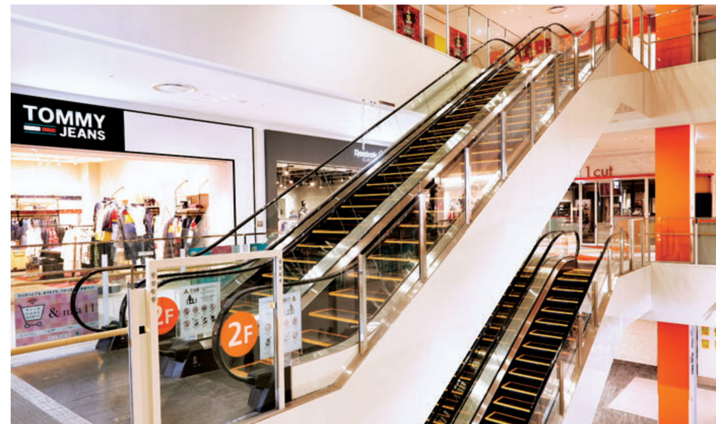
エスカレーター・2階