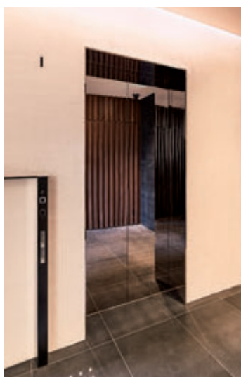
乗用13人乗りエレベーター・1階ホール