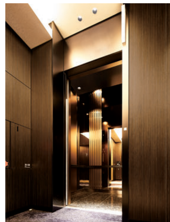
乗用19人乗りエレベーター・かご室