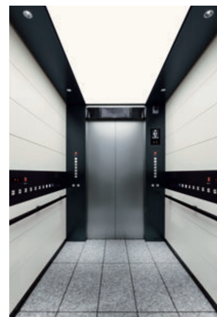
乗用24人乗りエレベーター・かご室