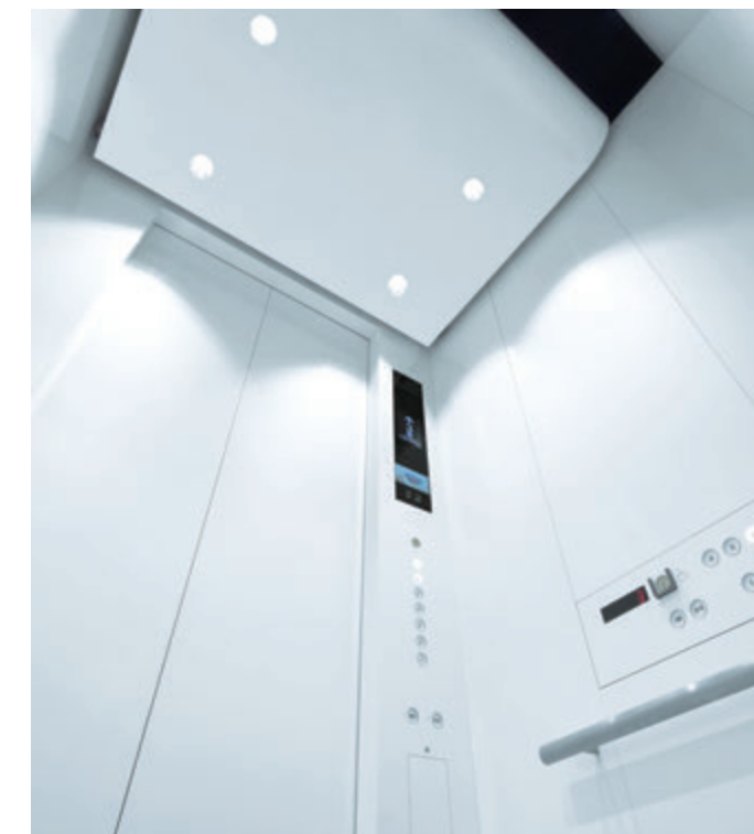
乗用15人乗りエレベーター・かご室天井(北海道テレビ放送本社)