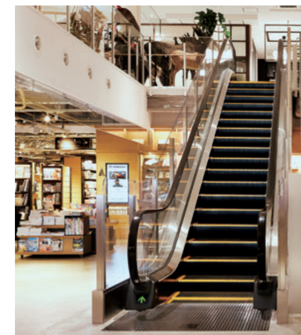
エスカレーター(名古屋みなと 蔦屋書店)