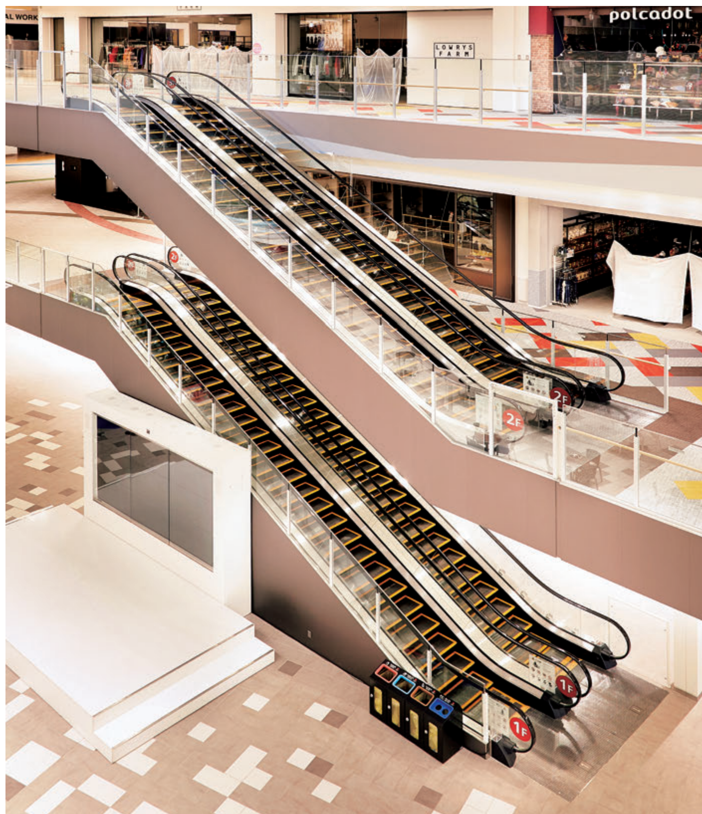
エスカレーター(センターコート)

名古屋の再開発ベイエリアに大型商業施設、三井ショッピングパーク ららぽーと名古屋みなとアクルスがオープンしました。市営地下鉄「港区役所駅」から徒歩2分の好立地に、ファッションや話題の飲食店の他、別棟にはカフェや専門店とつながった「蔦屋書店」など全217店が集結。「ヒトを繋ぎ、トキを紡ぐ“コネクトモール”」をコンセプトに、新たな地域交流・情報発信の場をめざします。