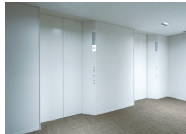
乗用15人乗りエレベーター・6階エレベーターホール(北海道テレビ放送本社)