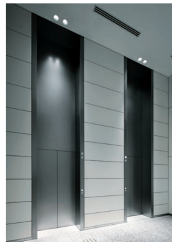
乗用24人乗りエレベーター・1階エレベーターホール