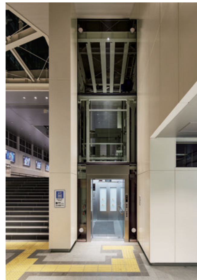
乗用26人乗りエレベーター・2階エレベーターホール(北口東)