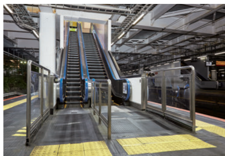
エスカレーター・ホーム階