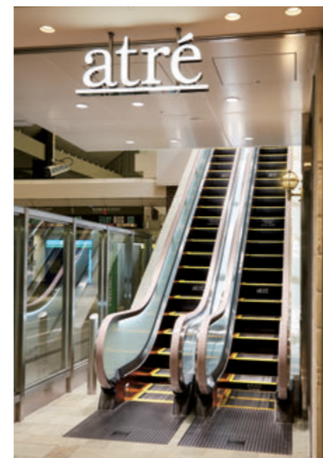
エスカレーター・3階(アトレ川崎)