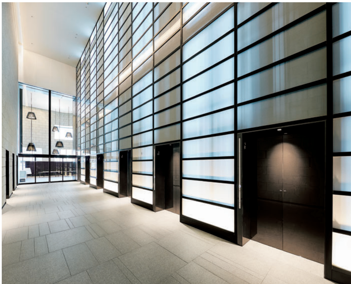
展望用40人乗りエレベーター・1階ホール

官民地域が一体となって推進する「日本橋再生計画」の一環である日本橋高島屋三井ビルディングは、地上32階、地下5階のオフィス・商業施設などで構成される大型複合施設。オフィス部分に関しては「充実したビジネスライフ実現の場」とすることをめざして竣工しました。9階のオフィス行きメインロビーまで、10台ある40人乗りの高速シャトルエレベーターがストレスなくお連れします。