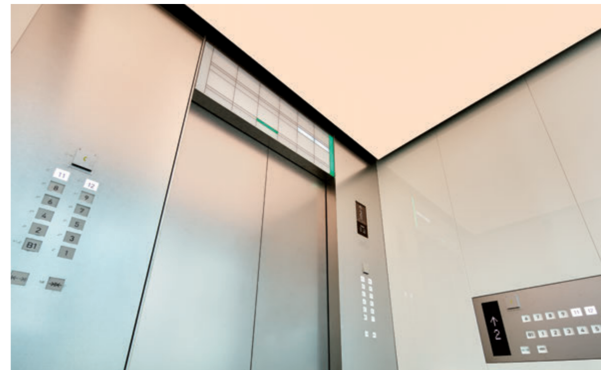
展望用24人乗りエレベーター・かご室天井