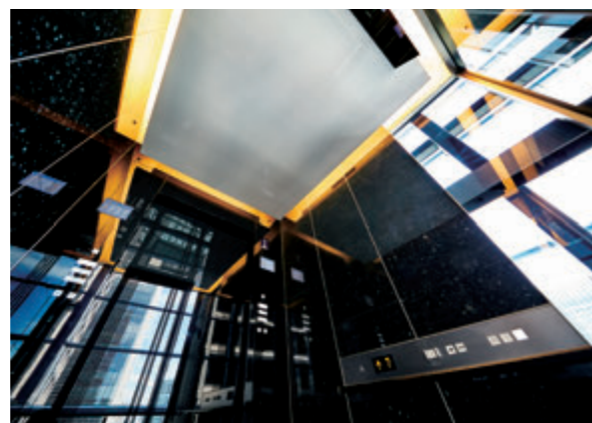
展望用40人乗りエレベーター・かご室天井