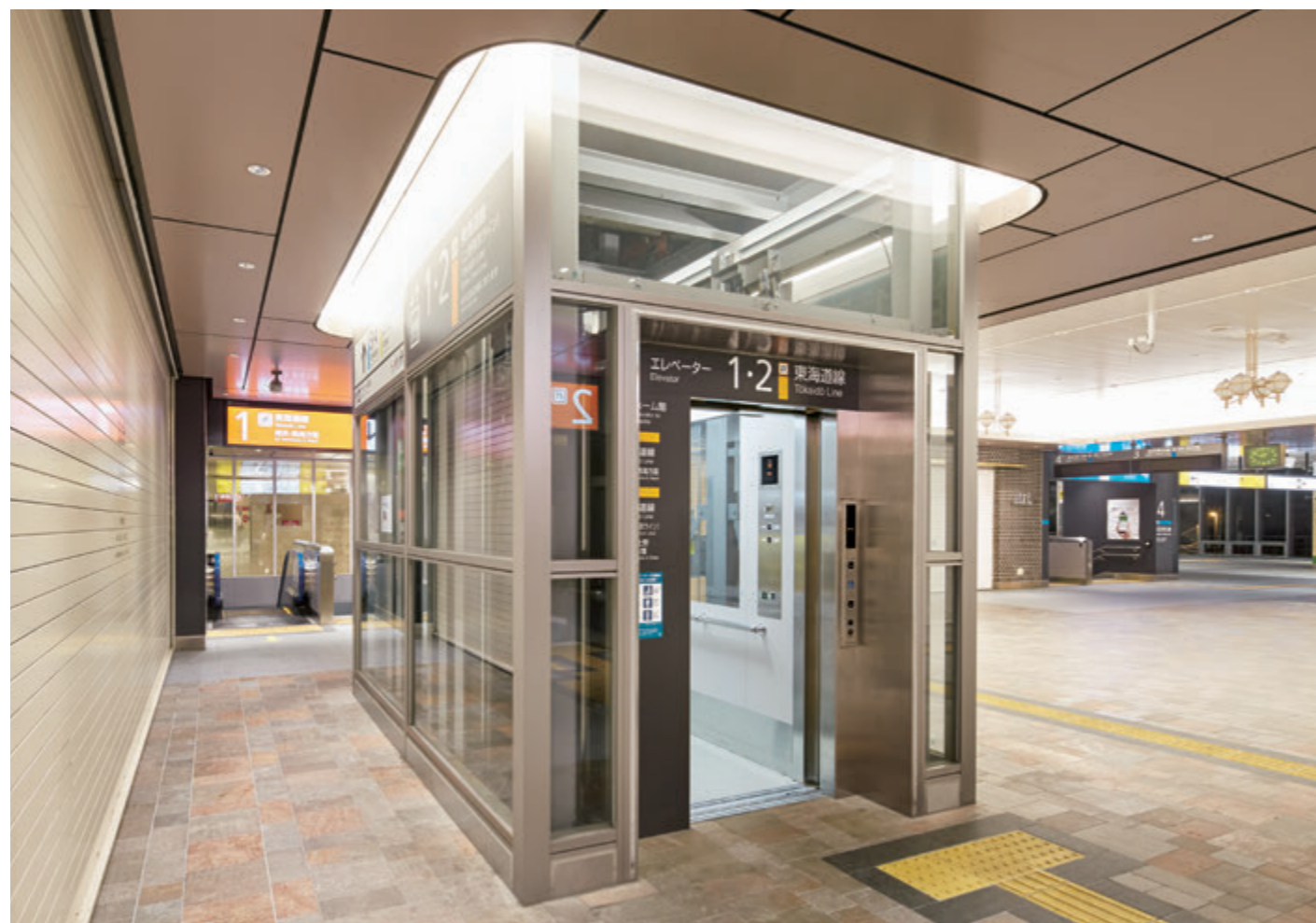
駅舎用15人乗りエレベーター・スリム2方向タイプ・改札階

JR川崎駅は、アクセス向上と混雑緩和のため駅北口を整備しました。新たに開業した北口自由通路には、川崎フロンターレ関連の展示を行う「フロンターレロード」、川崎市の行政サービス施設・観光案内所「かわさききたテラス」もオープンしました。「アトレ川崎」はエキナカ商業施設26店舗を含む46店舗が新たにオープンし、多くの利用者で連日賑わっています。