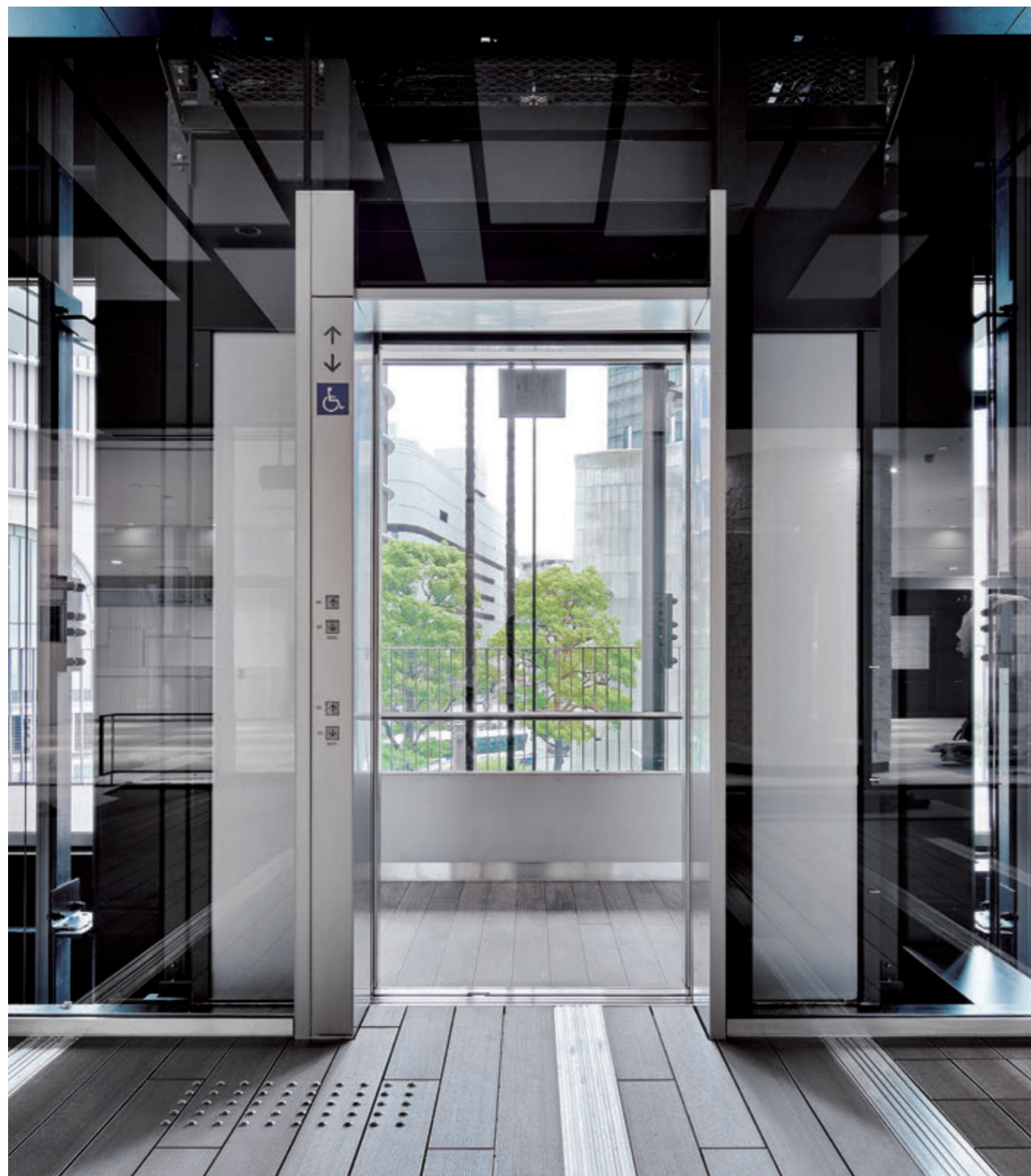
展望用24人乗りエレベーター・かご室

大阪の中心地・梅田エリアに位置する大阪神ビルディングと新阪急ビルの一体的な建替により誕生した本ビルは、2018年4月にI期棟が竣工し、6月には阪神百貨店(阪神梅田本店)が部分開業しました。2022年春の全体竣工時には、百貨店ゾーンのほかオフィスゾーン、カンファレンスゾーンが整備されます。ビルの建替にあわせて、周辺公共施設整備を一体的に行うことにより、バリアフリー機能の向上等を図り、快適で質の高いまちづくりを進めています。