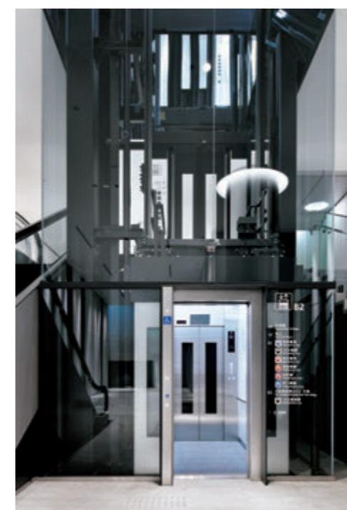
乗用20人乗りエレベーター・B2階エレベーターホール