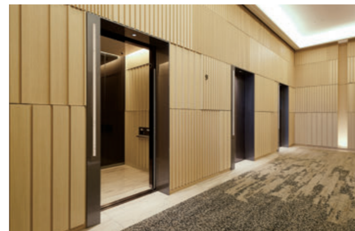
乗用26人乗りエレベーター・9階ホール