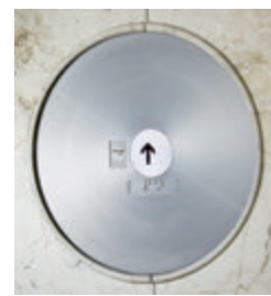
のりばボタン (リニューアル後)