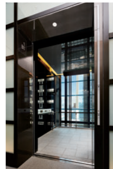
展望用40人乗りエレベーター・かご室