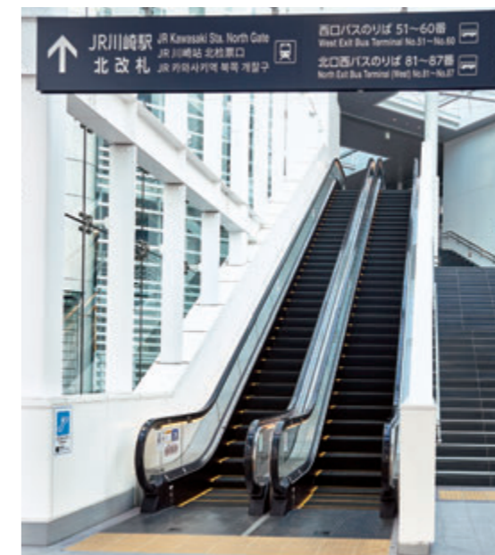
エスカレーター・1階(北口東)