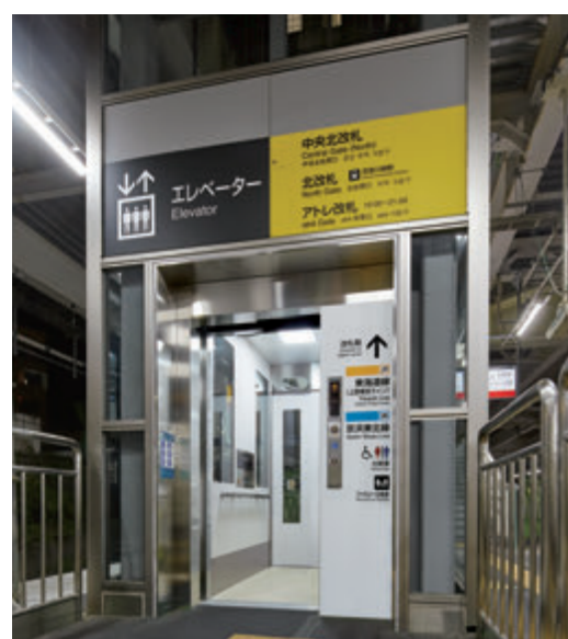
駅舎用11人乗りエレベーター・スリム2方向タイプ・ホーム階