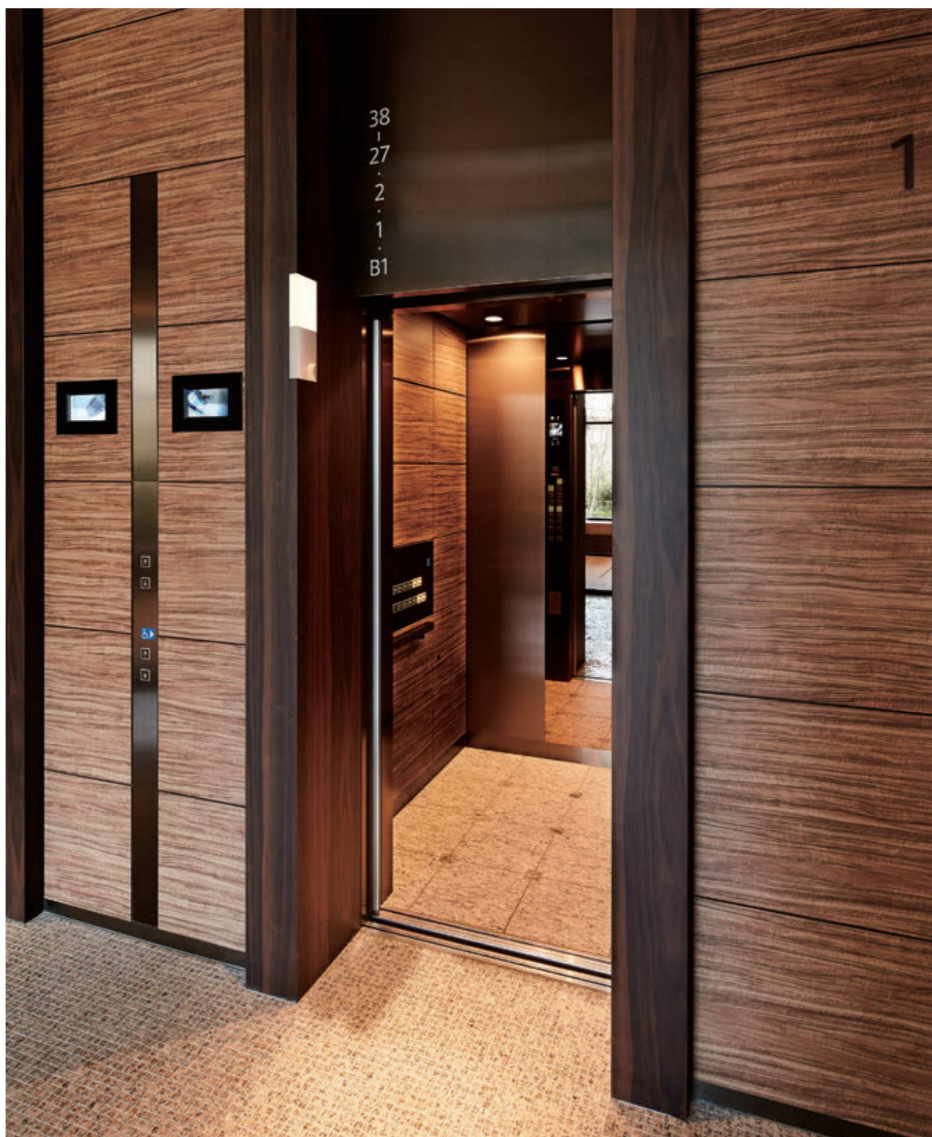
乗用11人乗りエレベーター・かご室

目黒駅前の大規模複合開発が完了し、38階建ての超高層住宅棟・ブリリアタワーズ目黒 サウスレジデンスが誕生しました。同地はかつて大名屋敷があった高台で、敷地内の豊かな植栽と周辺の公園が森を思わせる風景を作り出しています。パーティールームやフィットネスルームなど共用施設も充実し、30階のラウンジからは、都心の景観を一望することができます。