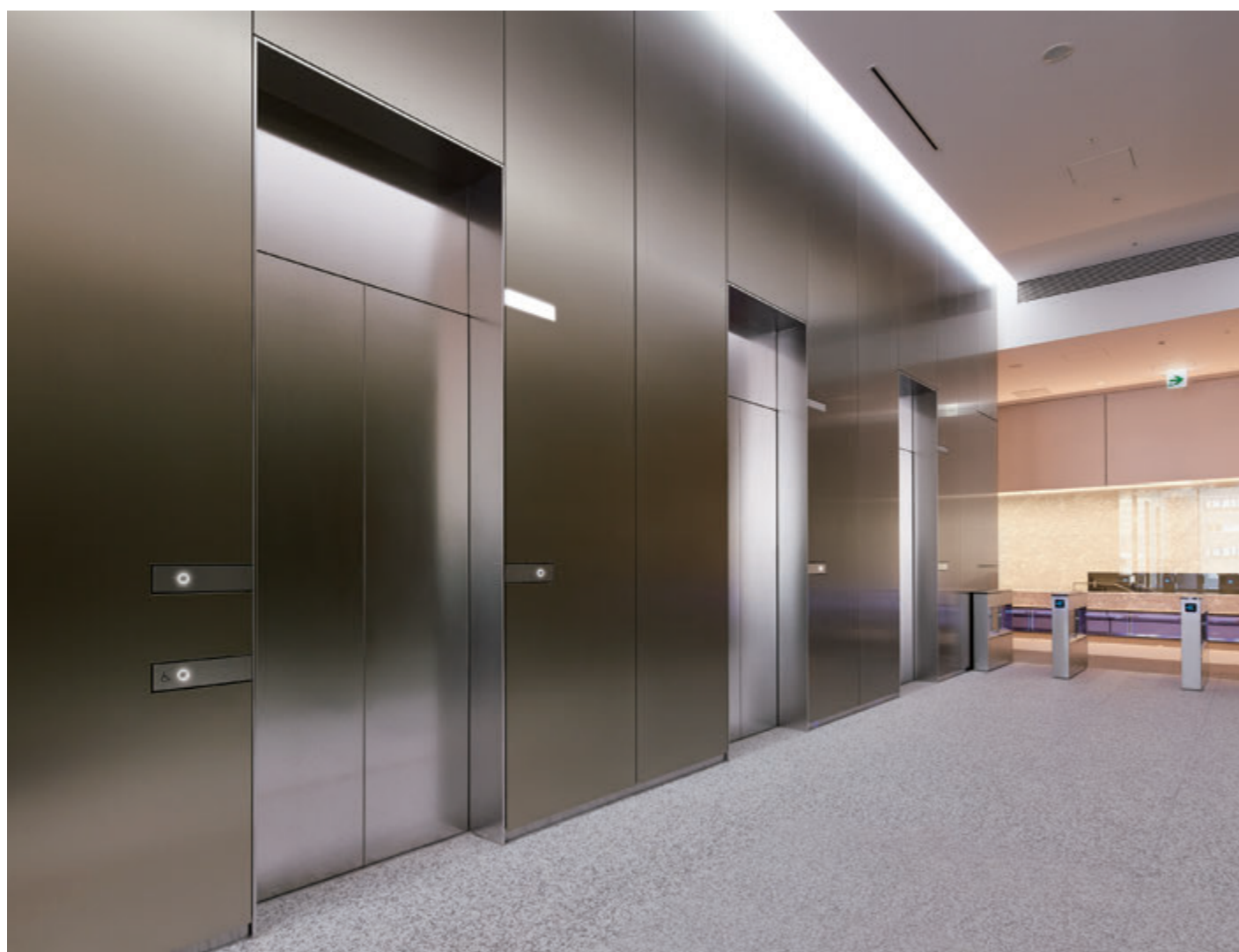
乗用24人乗りエレベーター・3階ホール

目黒セントラルスクエアは、目黒駅東口前の複合開発地区に誕生した地上27階のオフィス棟で、交通アクセスに恵まれ、災害にも強い台地立地にあります。B1～2階はレストランや様々なショップが入る商業エリアになっており、豊かな緑が広がる敷地には"森の広場"が設けられています。潤いのある環境に、快適な都市機能を備えた新しいビジネス拠点が誕生しました。