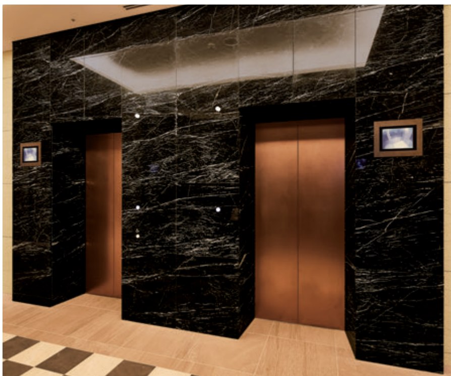
乗用13人乗りエレベーター・1階ホール

パークシティ中央湊 ザ タワーは、JR・地下鉄八丁堀駅から徒歩6分、隅田川に面し、銀座エリアも徒歩圏という立地に誕生した地上36階の超高層マンションです。全416戸、キッズルームやスタディカフェ、ライブラリーなど多彩な共用施設を備えています。"江戸の文化を受け継ぐ"というコンセプトのもと、町屋の格子をイメージさせるデザインが印象的です。