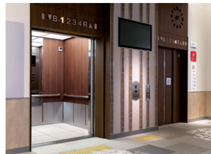
乗用24人乗りエレベーター・1階ホール