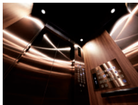
乗用13人乗りエレベーター・かご室天井