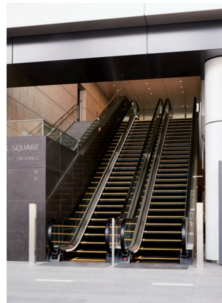
エスカレーター・1階