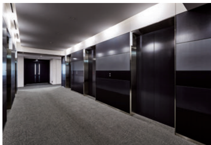
乗用24人乗りエレベーター・9階ホール