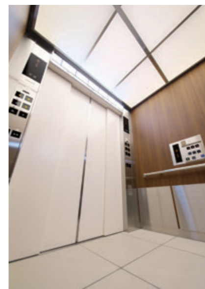
乗用24人乗りエレベーター・かご室