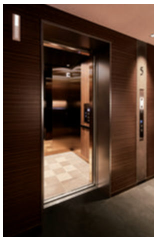
乗用13人乗りエレベーター・かご室