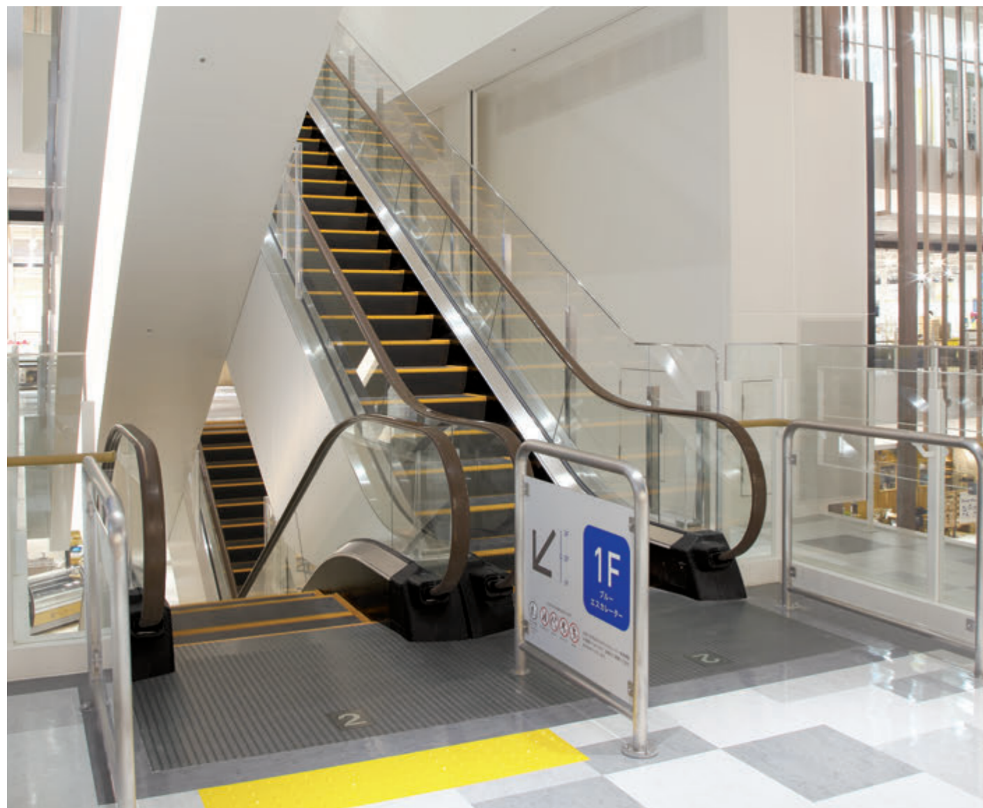
エスカレーター・2階のりば

名古屋市に隣接する愛知県日進市に、セブン&アイ・グループが運営する東海地方初出店の大型ショッピングモールがオープンしました。店舗面積約43,000㎡の広大な空間に、衣料・食品・雑貨・飲食など生活に密着した180の多彩なショップが並び、人体型ロボットインフォメーションやパーティールームなど、先進的できめこまやかなサービスが導入されています。