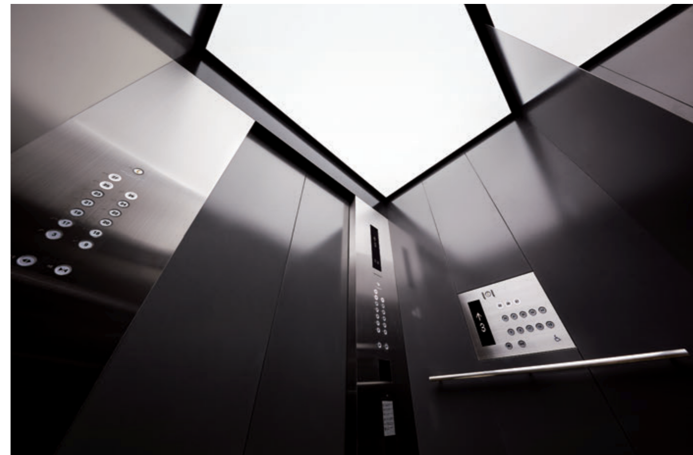
乗用24人乗りエレベーター・かご室天井