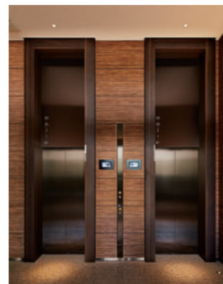
乗用11人乗りエレベーター・1階ホール