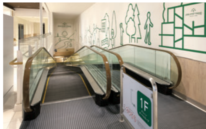
傾斜付き動く歩道・1階のりば