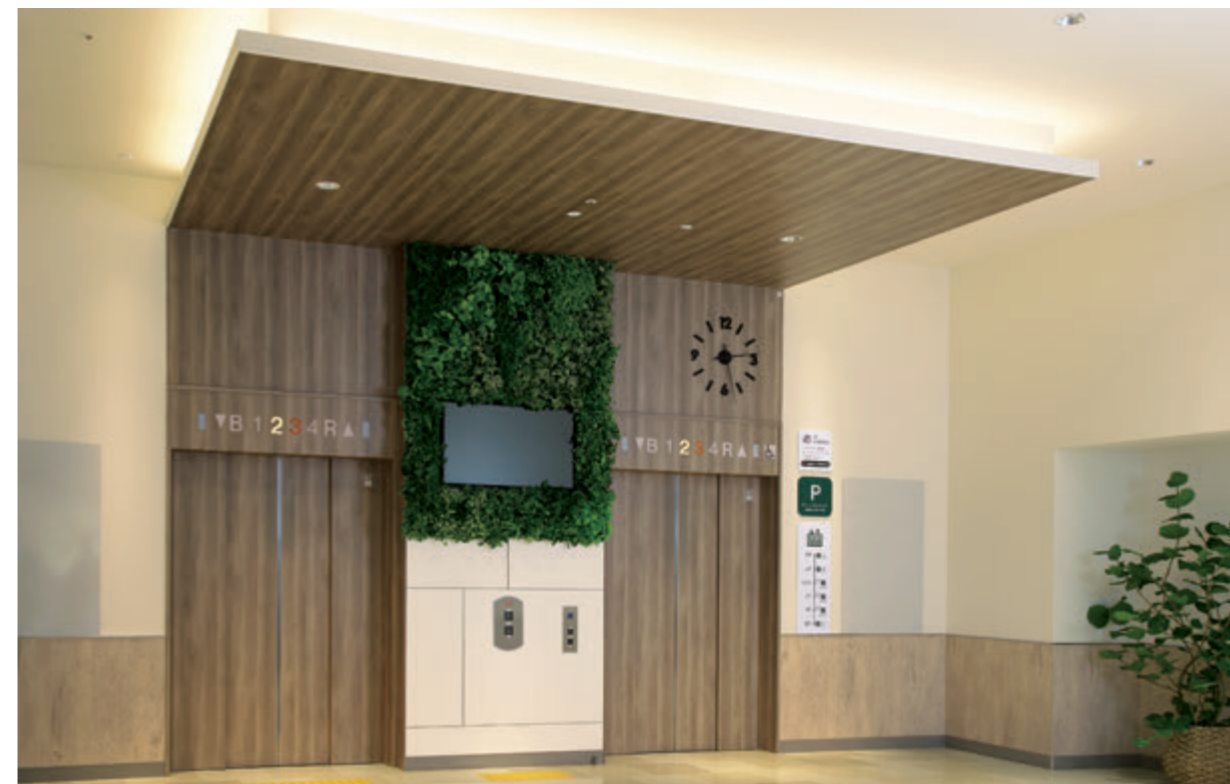
乗用30人乗りエレベーター・2階ホール