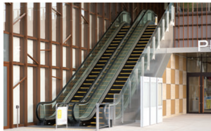
エスカレーター・1階のりば(ランドゲート)