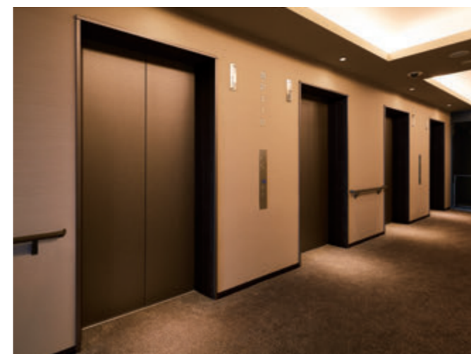
乗用11人乗りエレベーター・30階ホール