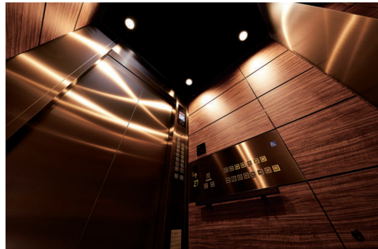
乗用11人乗りエレベーター・かご室天井