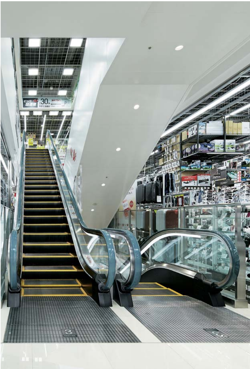
エスカレーター・3階のりば