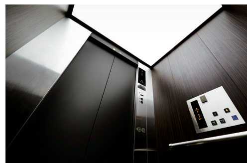
乗用15人乗りエレベーター・かご室天井 (イオンシネマ シアタス調布)