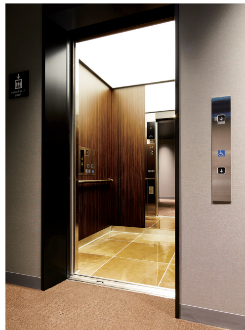
乗用15人乗りエレベーター・4階ホール (イオンシネマ シアタス調布)