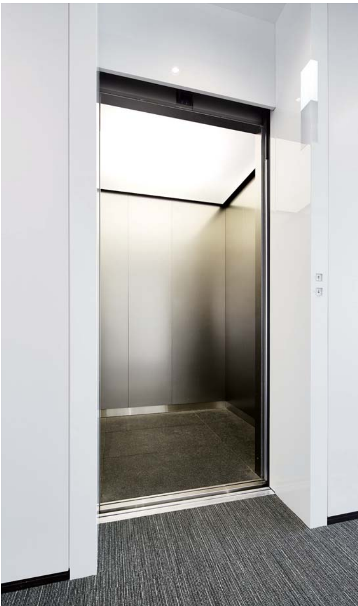
乗用20人乗りエレベーター・かご室