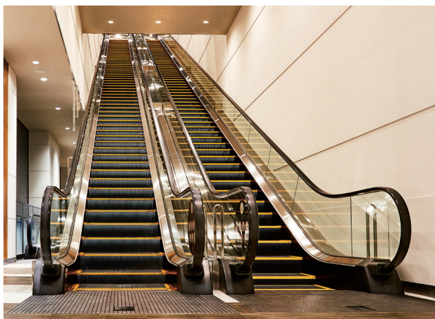
エスカレーター・1階