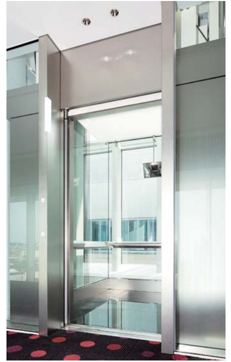
展望用20人乗りエレベーター・かご室