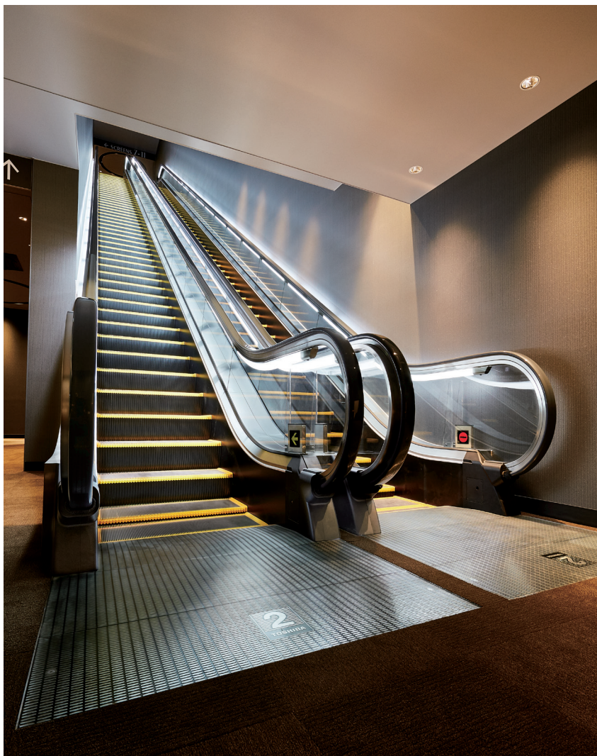
エスカレーター・2階のりば(イオンシネマ シアタス調布)

トリエ京王調布 C館 シネマコンプレックス「イオンシネマ シアタス調布」やカフェ、レストラン等専門店が入っています。