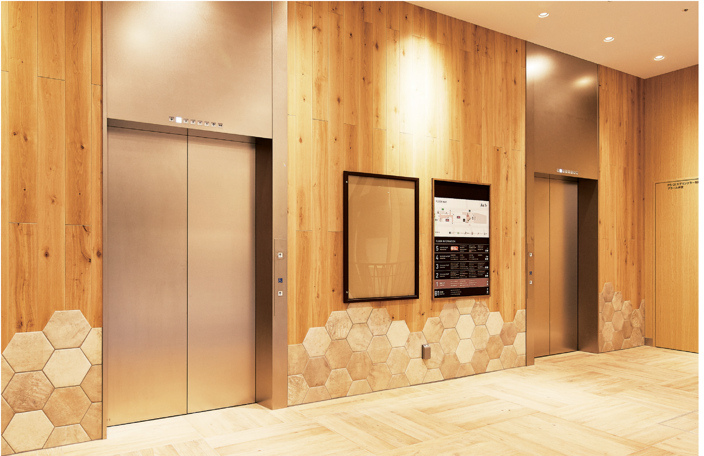
乗用20人乗りエレベーター・1階ホール