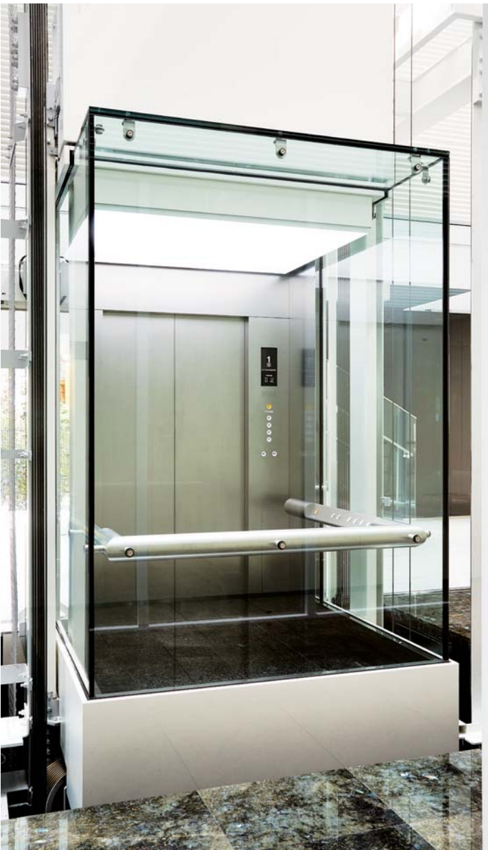
展望用20人乗りエレベーター・かご室