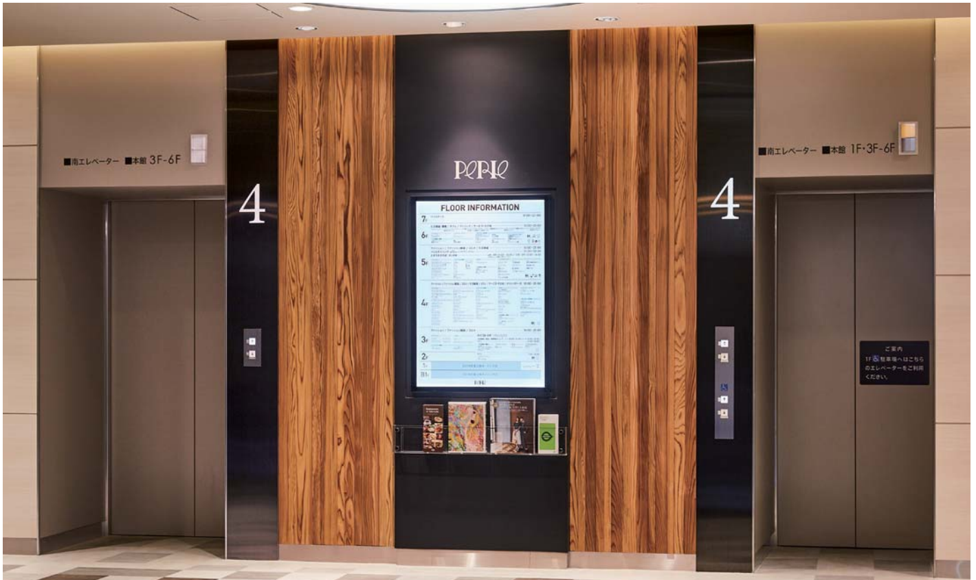
乗用21人乗り／乗用27人乗りエレベーター・4階ホール