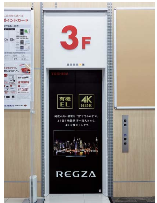
乗用15人乗りエレベーター・3階ホール