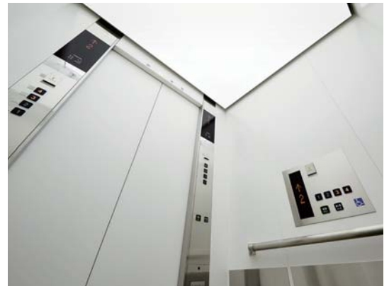
乗用15人乗りエレベーター・かご室天井