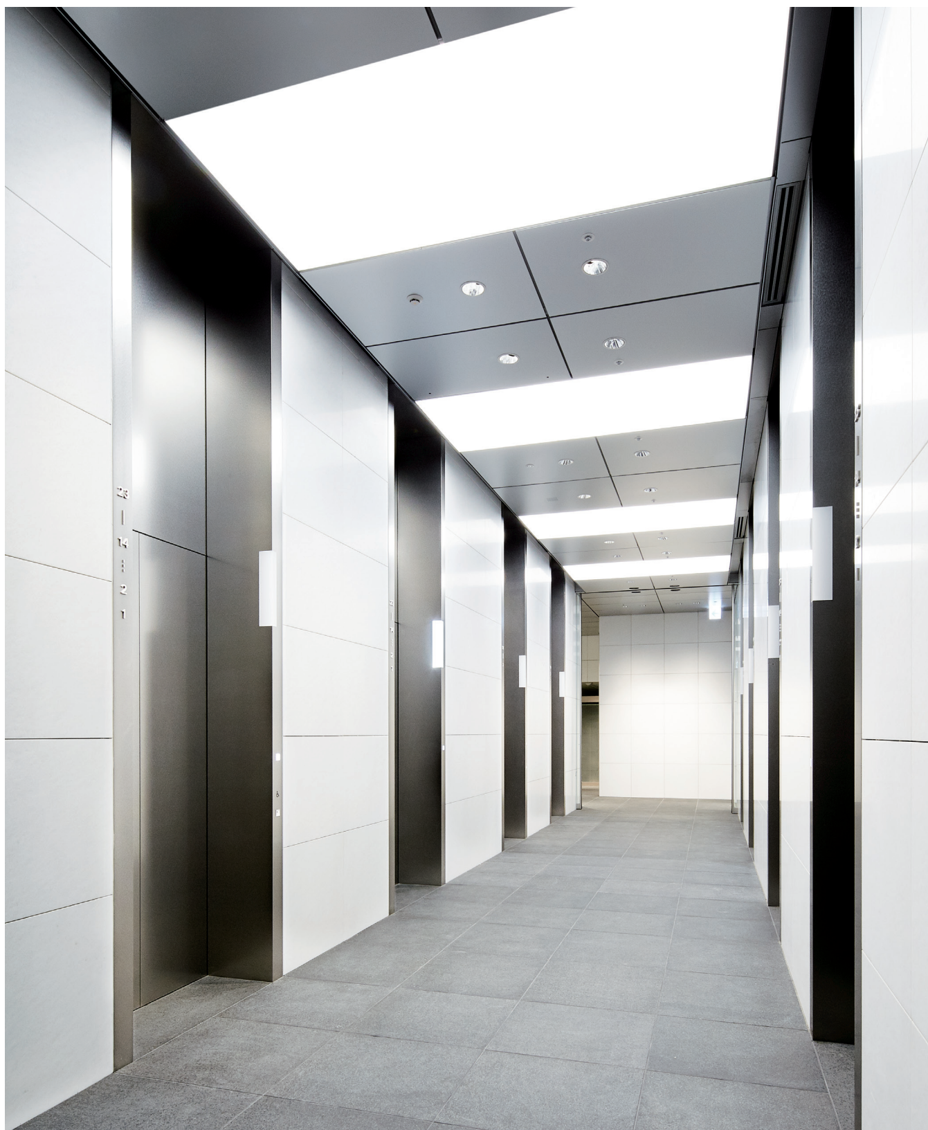
乗用20人乗りエレベーター・1階ホール

神宮前タワービルディングは地上23階の高層オフィスビルです。明治通りと竹下通りが交差する一等地に位置し、地下鉄明治神宮前駅から徒歩4分、JR原宿駅からも7分と、交通アクセスにも恵まれています。ビルには商業施設と駐車場が併設され、北には東郷神社の緑と静けさが、通り沿いには原宿の街の賑わいが広がる、快適で便利なオフィス環境となっています。