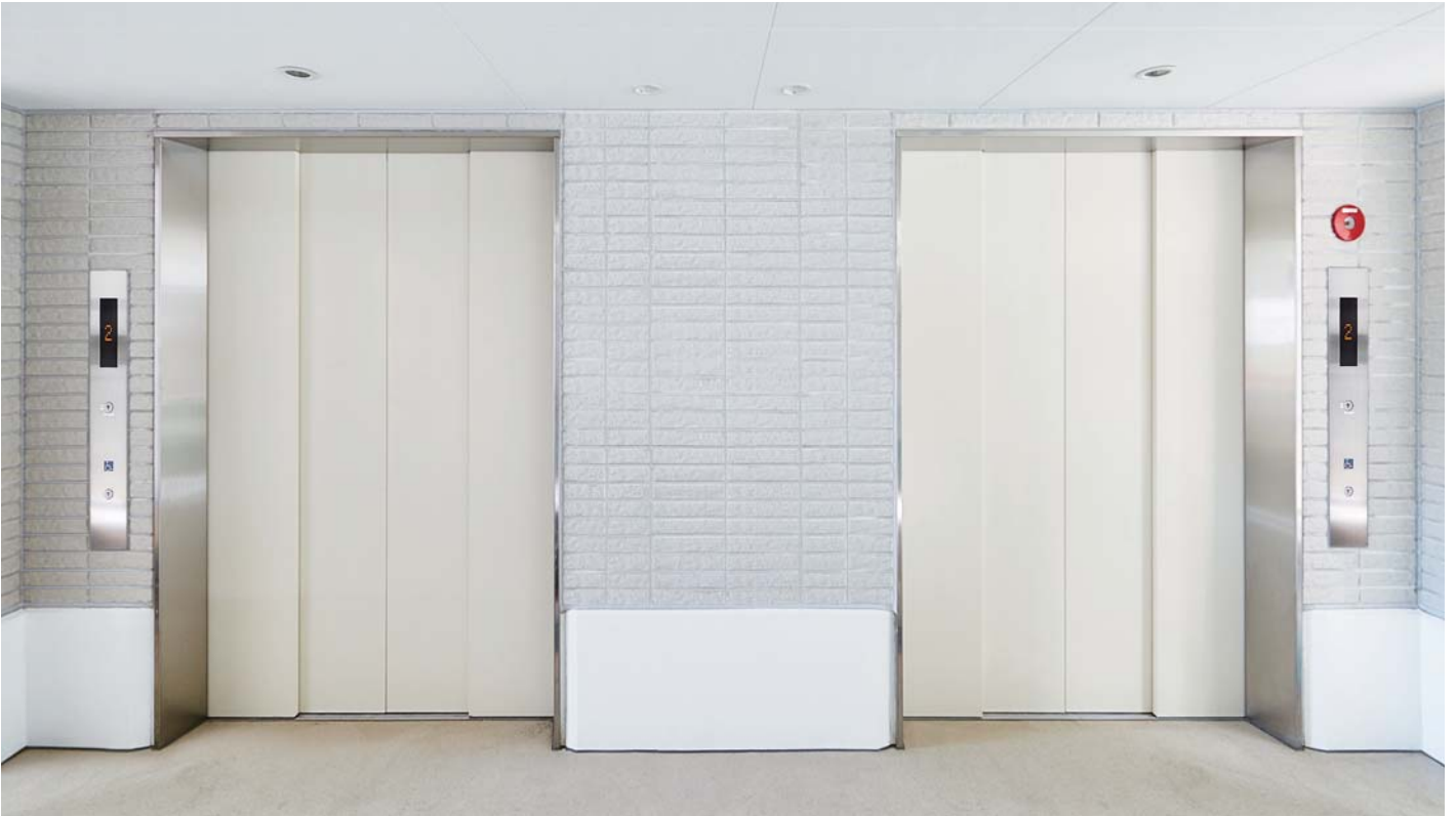
乗用24人乗りエレベーター／乗用(非常用)26人乗りマシンルームレスエレベーター・1階ホール