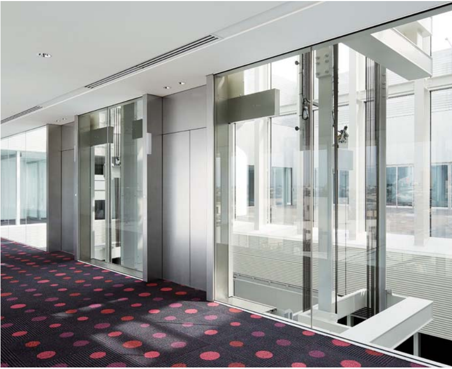
展望用20人乗りエレベーター・4階ホール