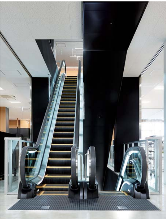
エスカレーター・2階のりば