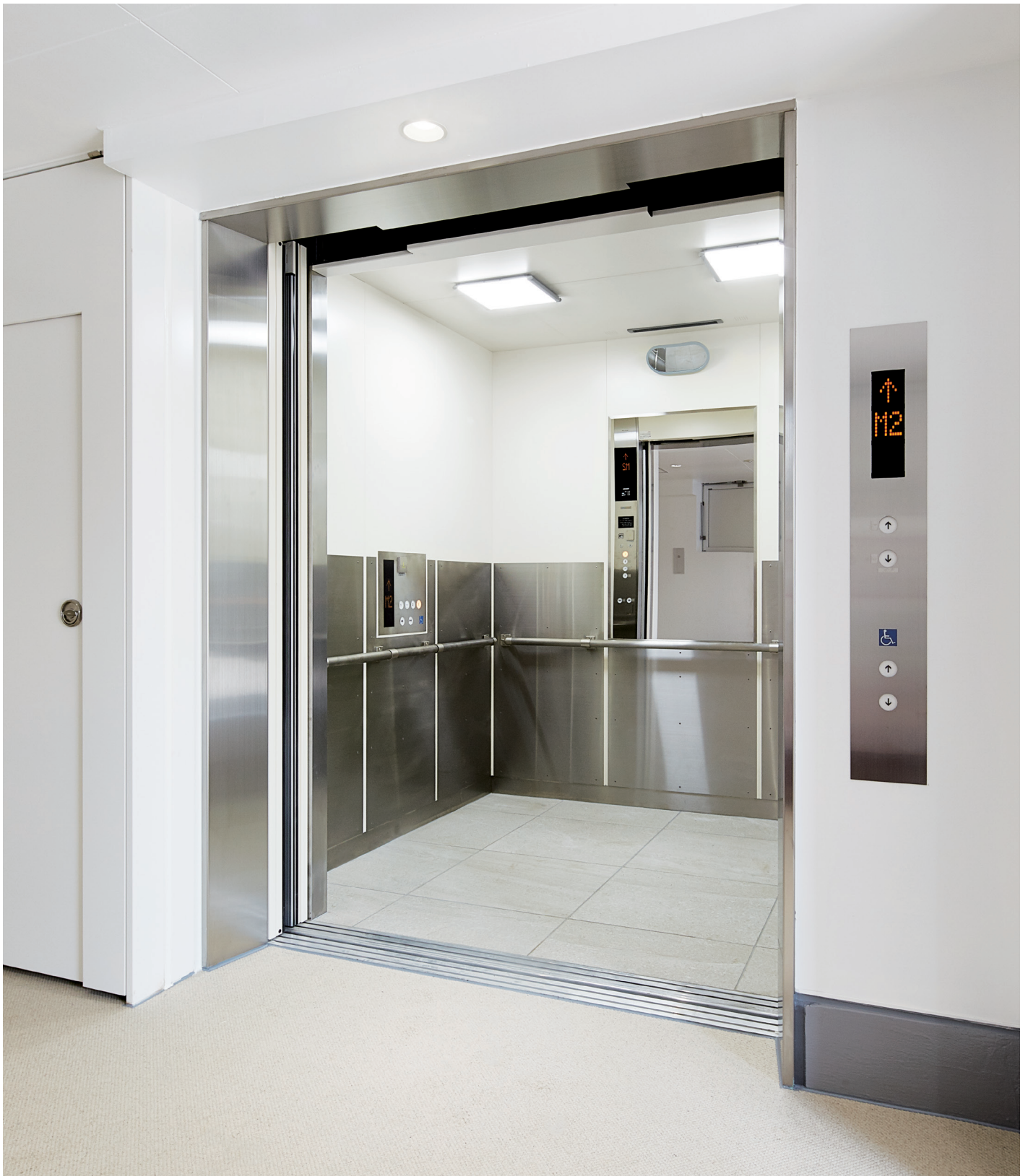
乗用(非常用)26人乗りマシンルームレスエレベーター・かご室

横浜・港北ニュータウンの中心部、市営地下鉄センター南駅から徒歩3分の商業施設キーサウスに、新たにスクエア館がオープンしました。1～3階はスポーツ用品専門店、屋上にはバッティングセンターや人工芝のコートがあり、若者からファミリー層まで賑わいを見せています。弊社の新製品「東芝非常用マシンルームレスエレベーター」が採用されています。