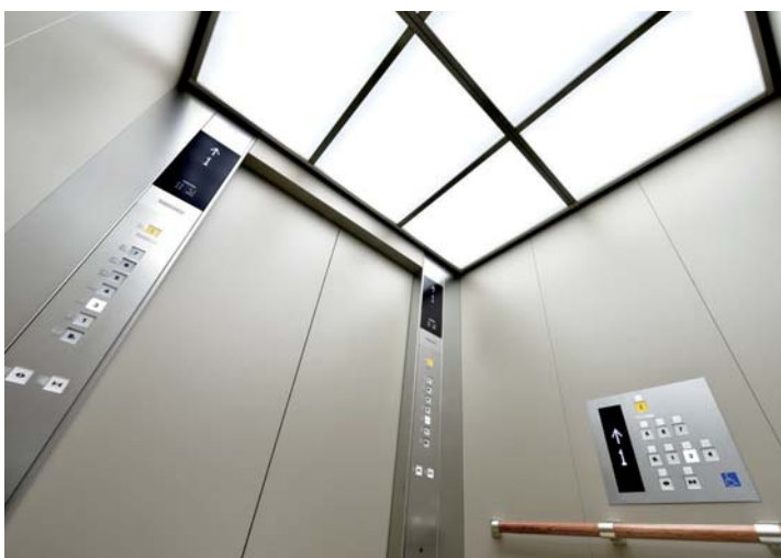
乗用20人乗りエレベーター・かご室天井