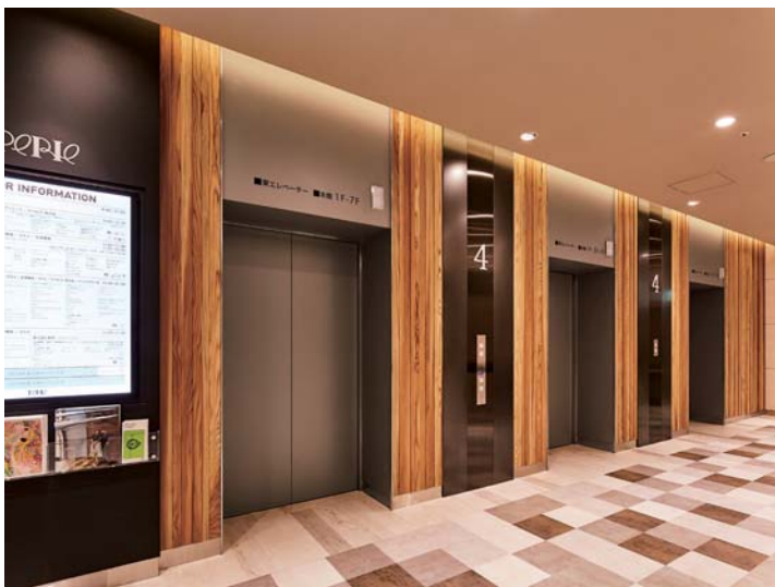
乗用20人乗りエレベーター・4階ホール