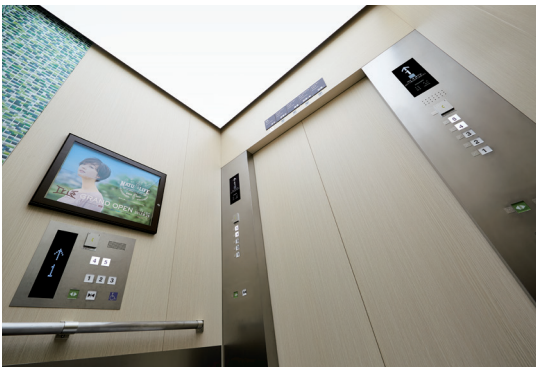
乗用20人乗りエレベーター・かご室天井