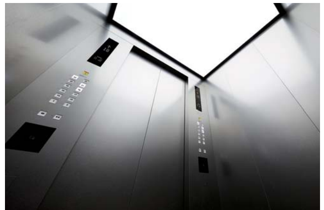
乗用20人乗りエレベーター・かご室天井