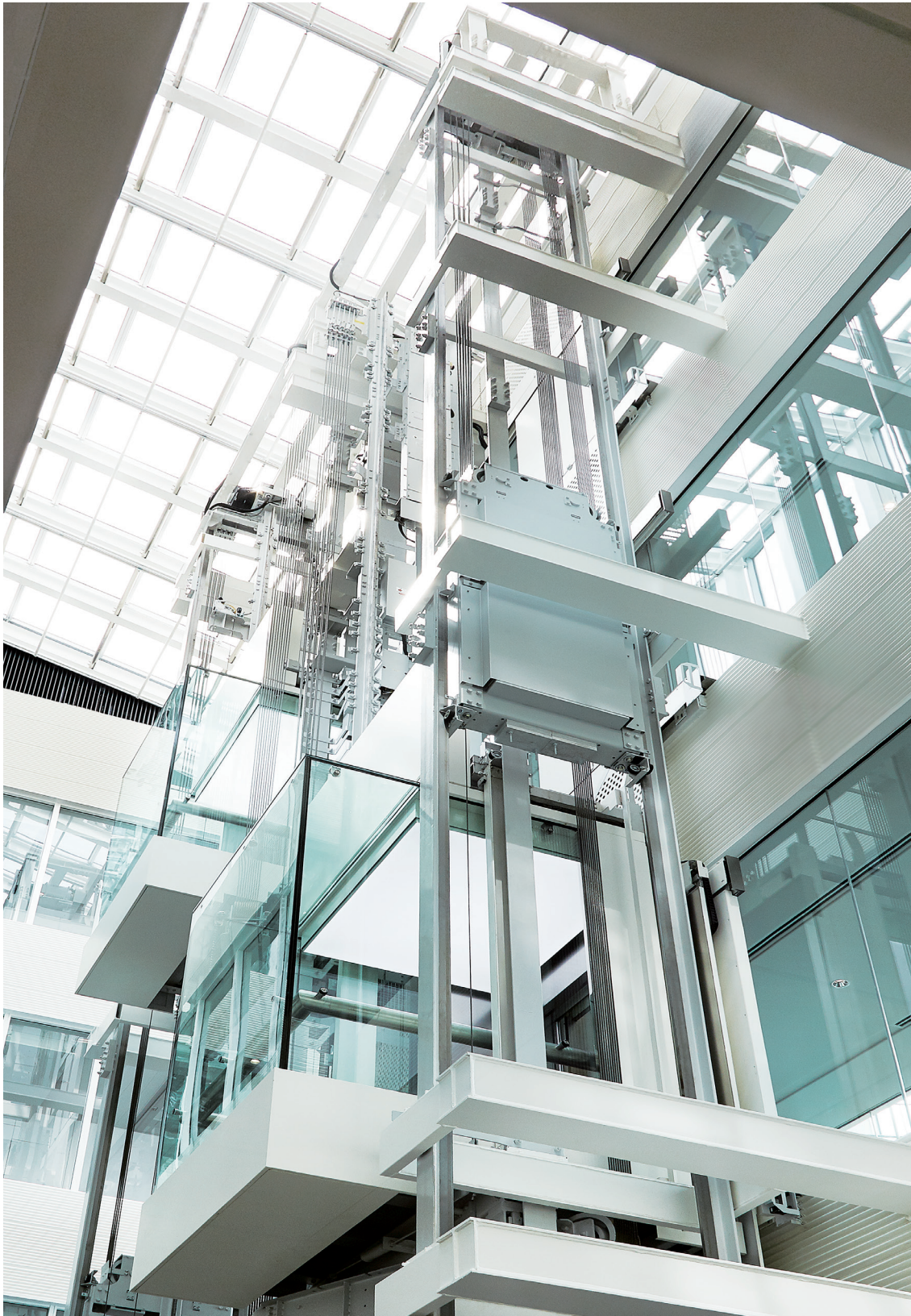
展望用20人乗りエレベーター・昇降路

半世紀以上にわたって数々の名作を送り出してきた東映アニメーション大泉スタジオが生まれ変わりました。新スタジオは4階建て、免震構造の建物で、白を基調とするシャープなデザインの外装には、外部騒音の抑制や熱負荷低減など様々な先進機能が盛り込まれています。日本文化を代表するアニメーションの発信拠点として、新たなスタートが切られました。