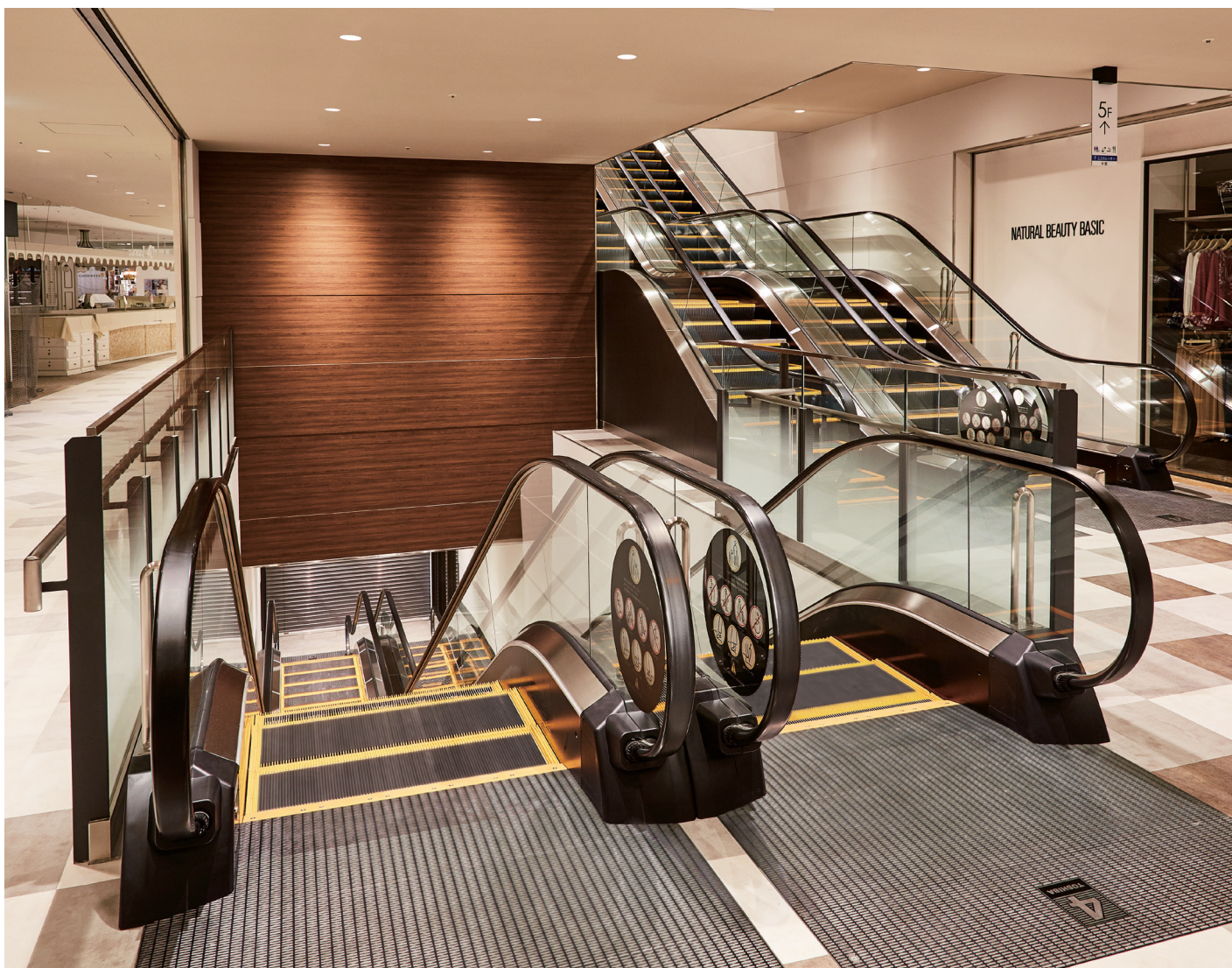
中間踊り場付きエスカレーター・4階

JR千葉駅の新駅ビル・ペリエ千葉の2～7階部分がオープンしました。ファッション・雑貨・飲食など、千葉市初出店 55店を含む 107のショップが並び、都市型の先進的なスタイルと千葉ならではのカジュアルなスローライフを掛け合わせた、豊かなライフスタイルを発信していきます。屋上庭園や多目的ホールも開設され、新たな交流の場となることが期待されています。