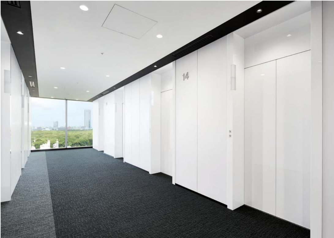
乗用20人乗りエレベーター・14階ホール