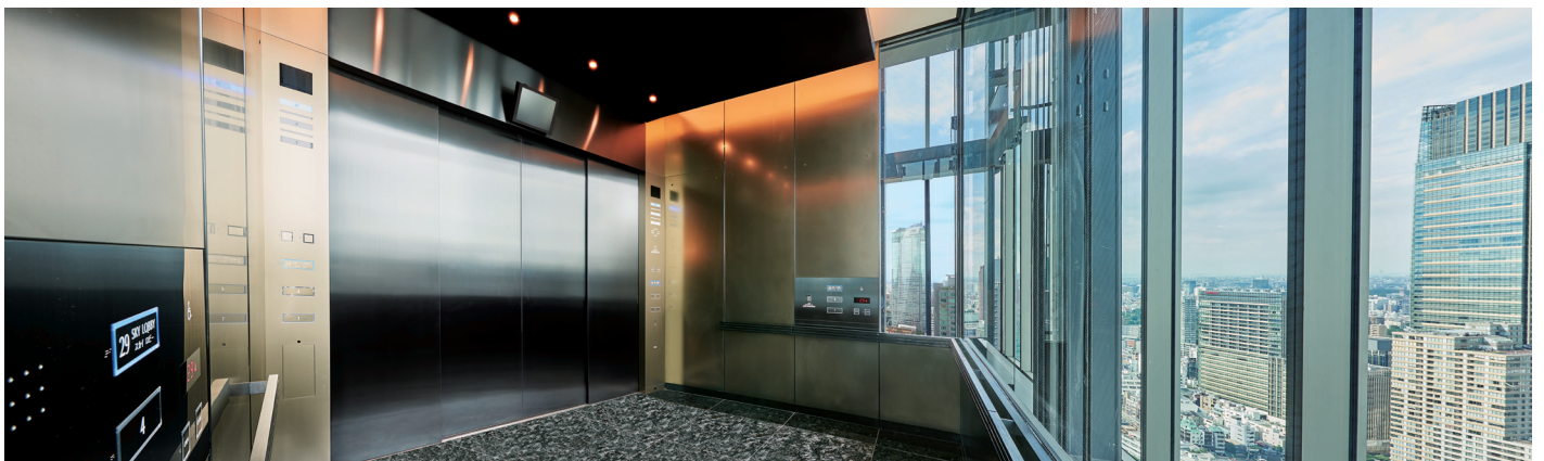
展望用90人乗りエレベーター(シャトルエレベーター)・かご室