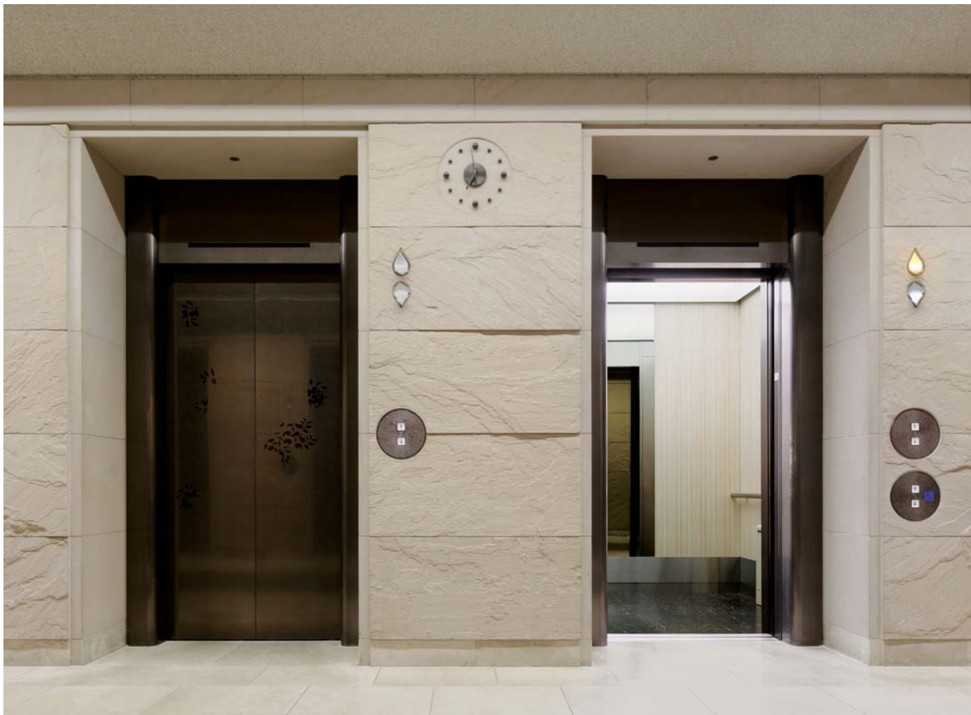
乗用エレベーター・1階ホール(リニューアル後:従来ののりば戸と三方枠を生かしたリニューアル)