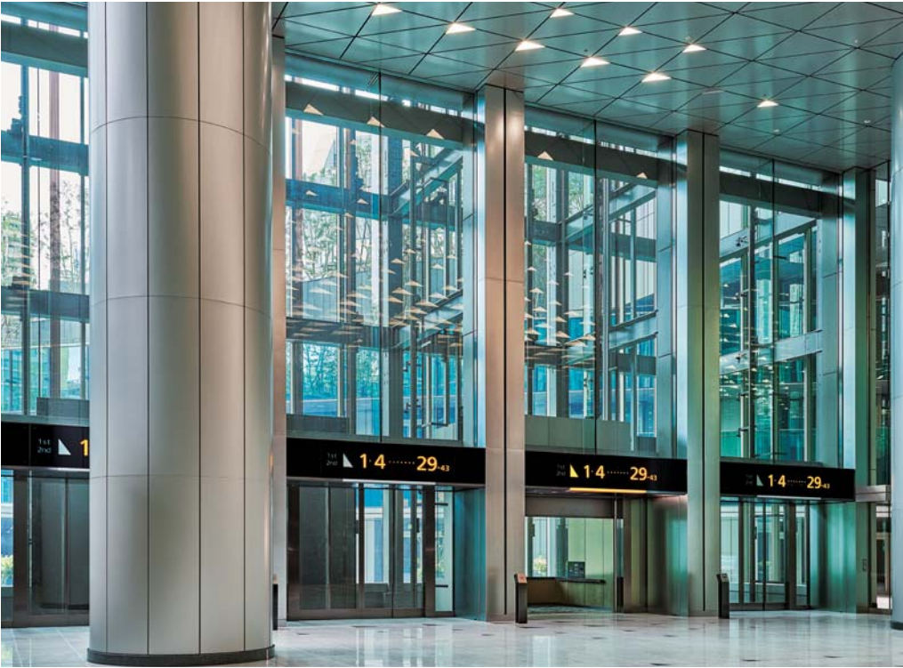
展望用90人乗りエレベーター(シャトルエレベーター)・1階ホール