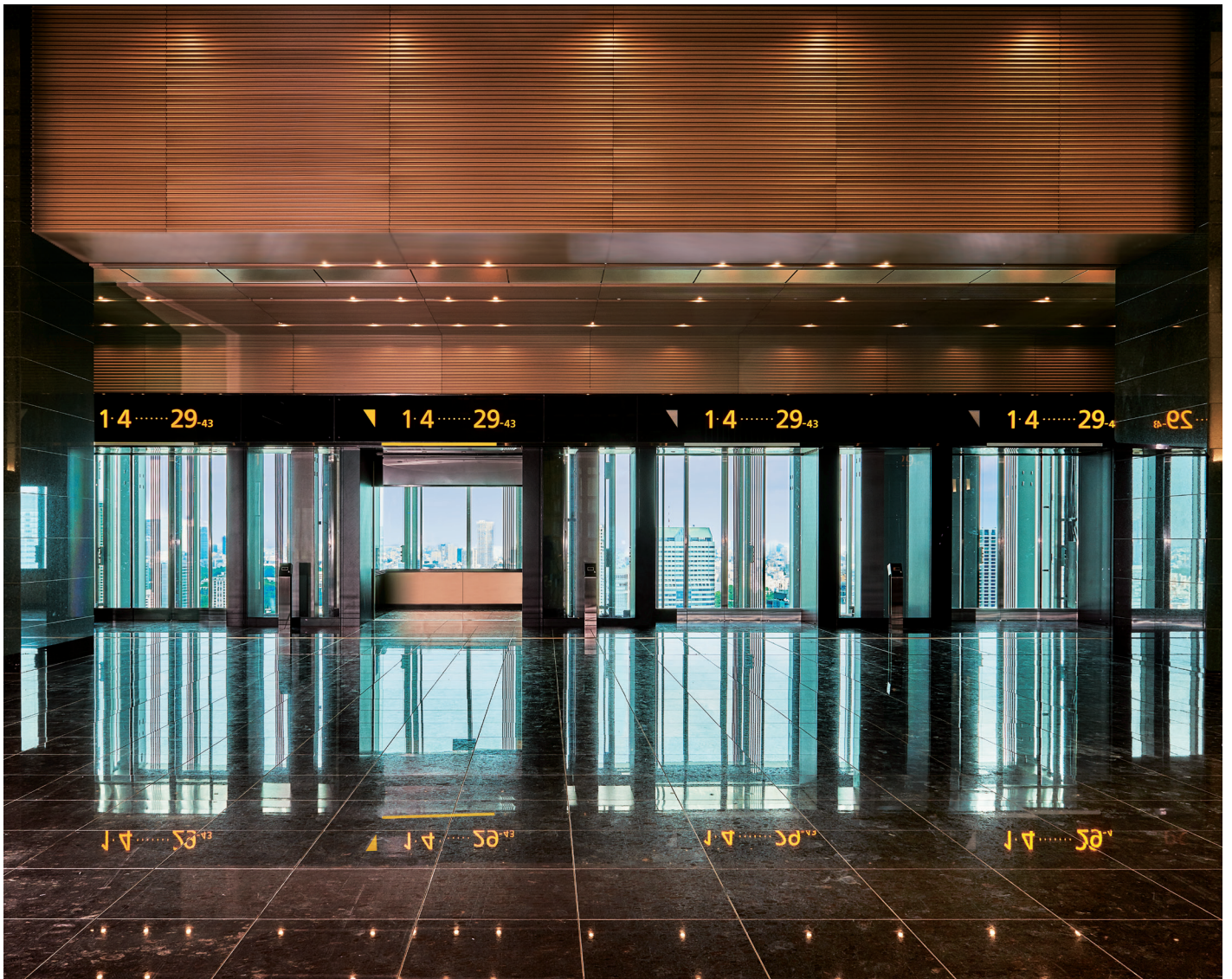
展望用90人乗りエレベーター(シャトルエレベーター)・29階ホール(スカイロビー)

住友不動産が大規模複合開発を進めてきた六本木エリアに、地上43階の新たな超高層オフィスビル・六本木グランドタワーが完成。隣接する2002年に竣工した従来の「泉ガーデン」と合わせ、新たに約6ヘクタールの大街区「泉ガーデン」が誕生しました。日本最大となる90人乗りシャトルエレベーターは、29階のスカイロビーへのスムーズなアクセスを実現しています。