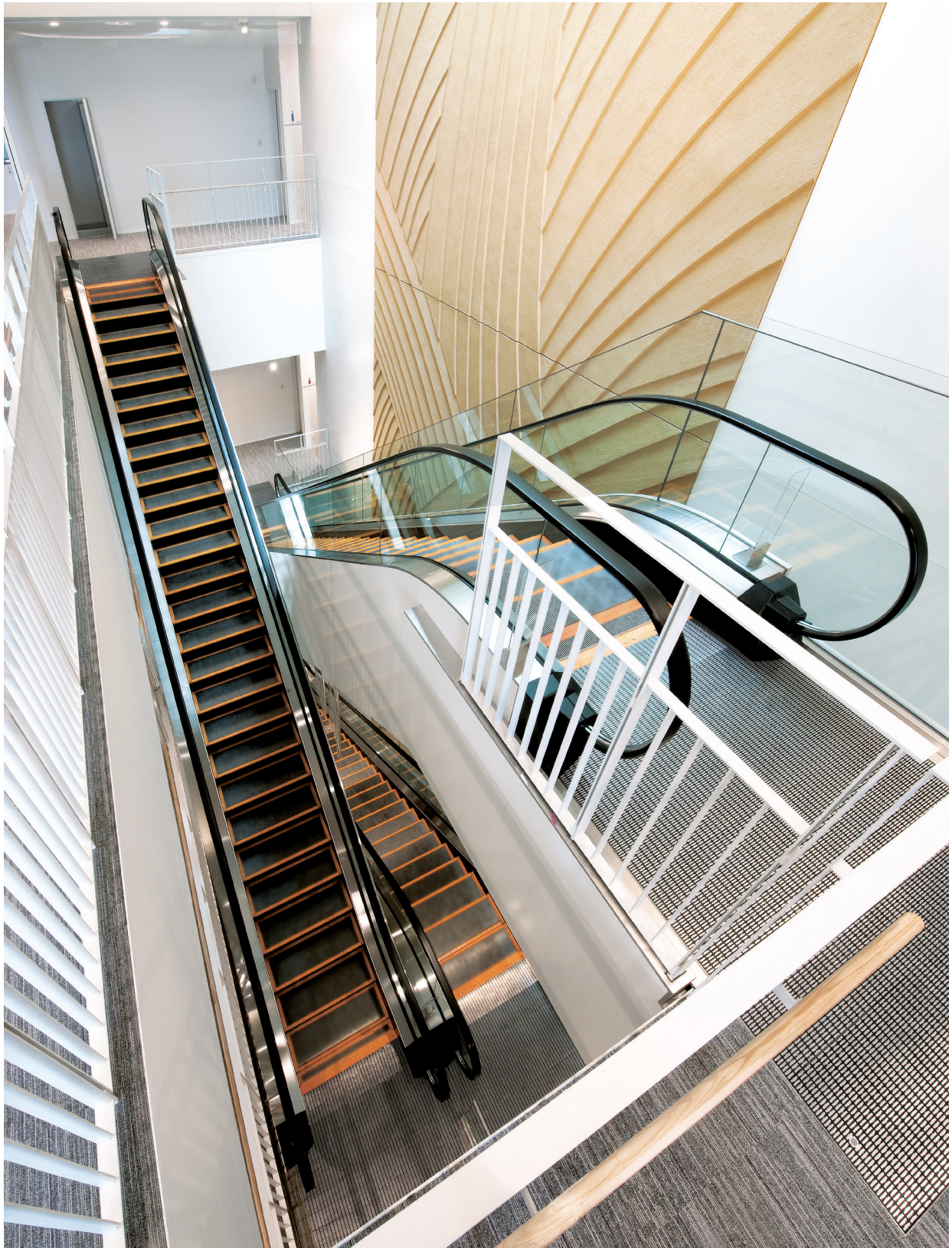
エスカレーター・6階吹き抜け

水と緑に恵まれた周辺環境と調和を保ち、歴史を継承していく—この基本コンセプトのもと、整備計画が進む法政大学市ヶ谷キャンパスの正門前に、キャンパスの新しい顔となる建物が完成しました。地上6階・地下2階の建物には、大中の教室のほか学生ホールやカフェテリア、売店などが入り、ピロティとガラス壁が明るく開放的な雰囲気を生み出しています。