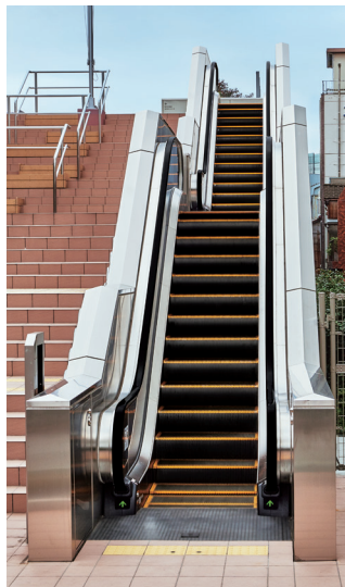
エスカレーター（屋外）