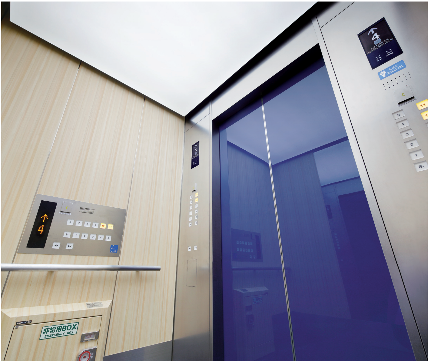
乗用20人乗りエレベーター・かご室(リニューアル後)

徳島県庁では、エレベーターのリニューアルを進めており、このたび一部が完了しました。徳島県特産の果実「すだち」をあしらった1階ののりば戸はそのままに、かご室には県産品の天然木の不燃シート「恋樹百景」を使用。かご戸は、県の伝統文化である「阿波藍」を模した美しい藍色に仕上げられています。エレベーターのリニューアルは3月に完了する予定です。