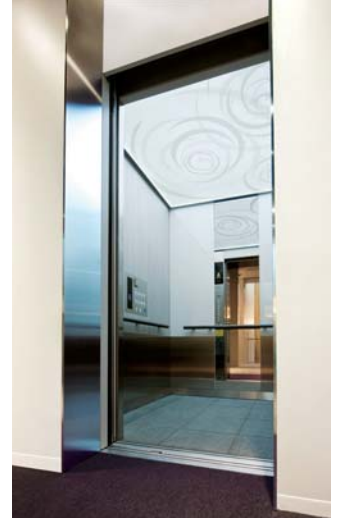
乗用15人乗りエレベーター・かご室