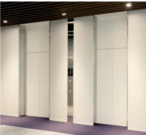
乗用20人乗り／15人乗りエレベーター・6階ホール