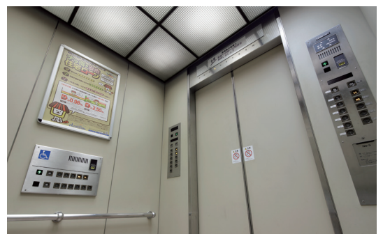
乗用24人乗りエレベーター・かご室(リニューアル前)