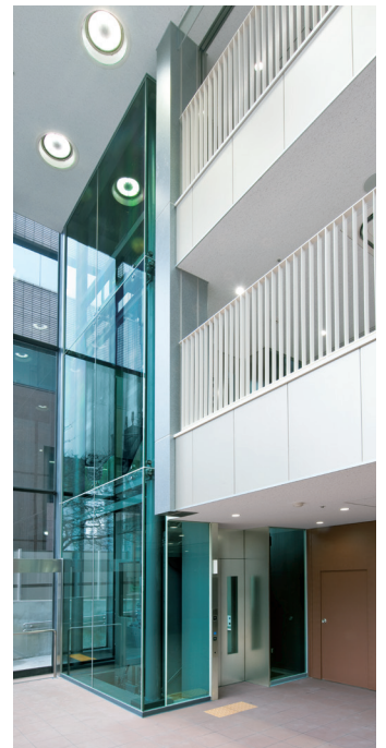
展望用11人乗りエレベーター・昇降路