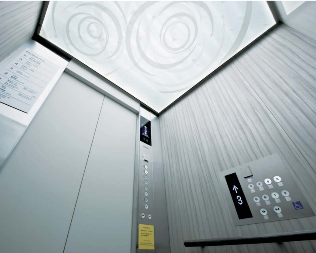
乗用15人乗りエレベーター・かご室天井