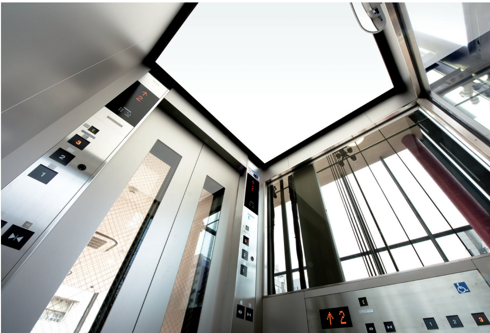
展望用11人乗りエレベーター・かご室天井

東京の食を支える築地、そのブランドと伝統を継承していく新施設が築地場外市場に誕生しました。多彩な水産物・青果物の販売店舗、フードコート形式の食堂とイベントスペースに加え、晴海通り側には大階段と屋外エスカレーターが設置され、食のプロだけでなく、一般客・観光客を広く迎え入れて、築地のにぎわいを高めていくことが期待されています。