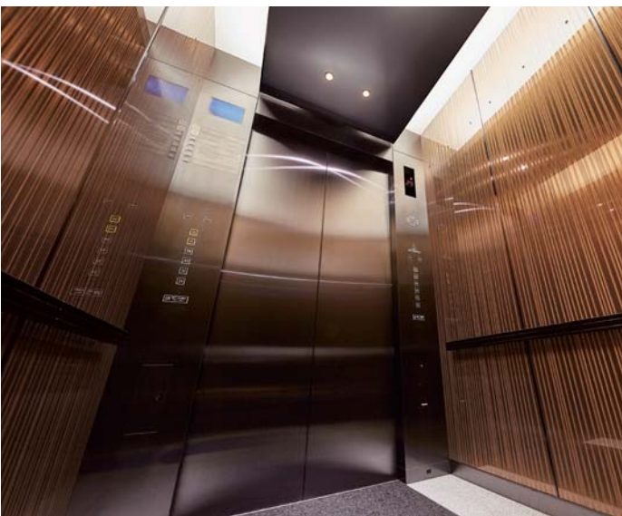
乗用34人乗りエレベーター・かご室