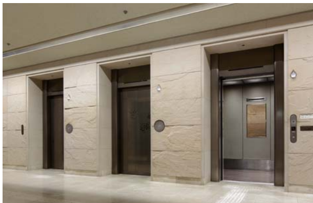
乗用エレベーター・1階ホール(リニューアル前)