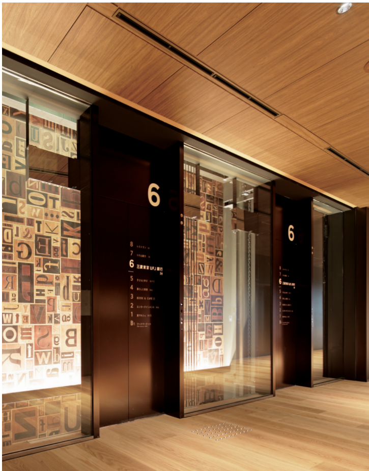
展望用24人乗りエレベーター・6階ホール

新時代のライフスタイルを提案し、情報発信をしていく最先端の商業施設 T-SITE の関西初店舗が、枚方市駅前に登場しました。枚方は蔦屋書店の創業の地。スタイリッシュな8階建てのビルに、TSUTAYAをはじめとする41の多彩な専門店が入り、スマートフォンでレストランの予約や電子決済などができる、情報時代ならではのサービスも提供しています。