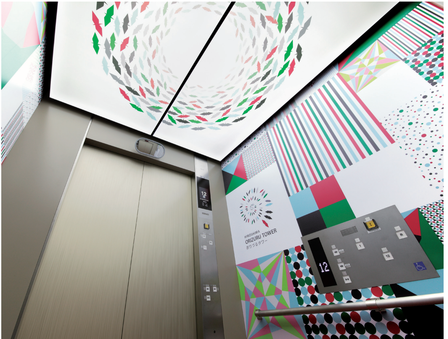
乗用27人乗りエレベーター・かご室

広島・平和記念公園に隣接するオフィスビルが、商業・観光施設とオフィスの複合ビルとして生まれ変わりました。眼下に原爆ドームを望み、12・13階の展望フロアからは遠く宮島までが見渡せます。北側の壁面には、来場者が自分で折った折り鶴を投入できるガラス張りの吹き抜け空間「おりづるの壁」を設置。平和を祈る街・広島にふさわしい“おりづるタワー”の登場です。