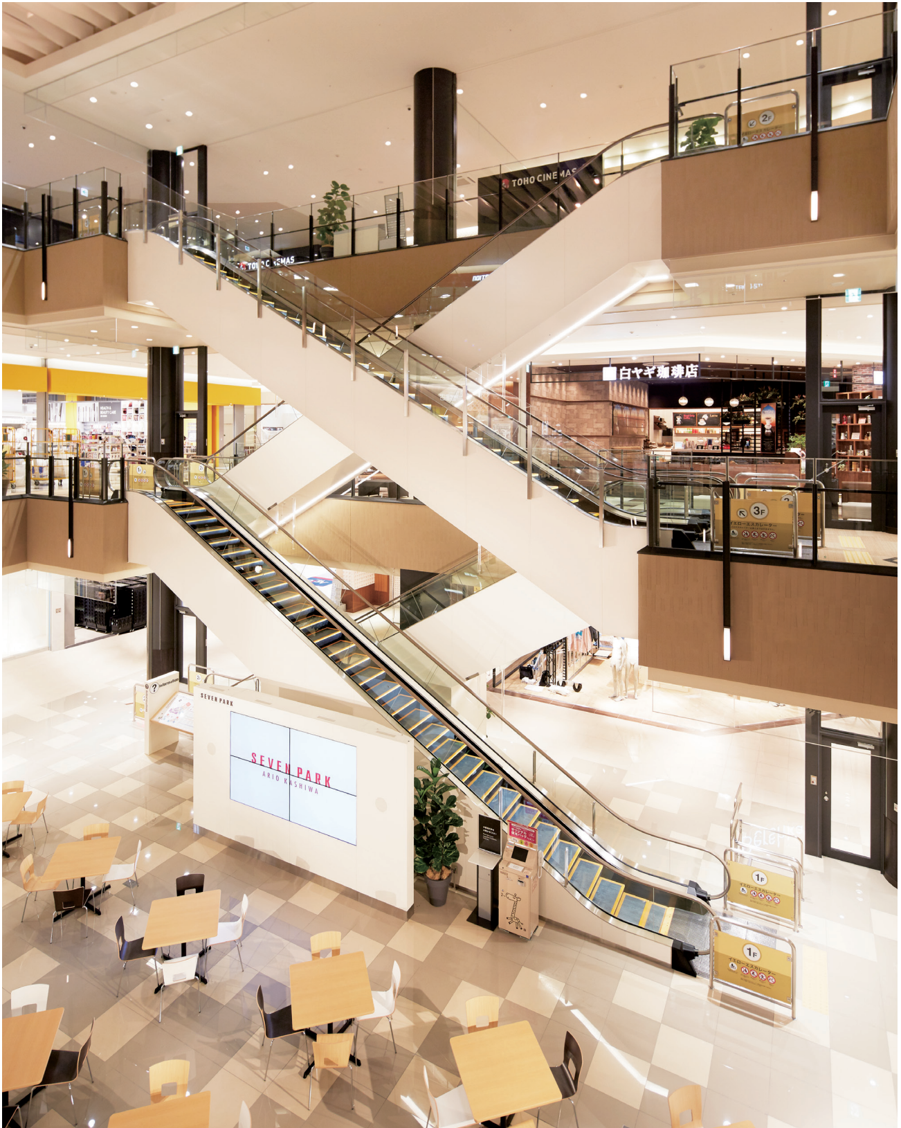
エスカレーター・吹き抜け(イエローエスカレーター)

セブンパーク アリオ柏は、約13万㎡の広大な敷地に多彩な施設が集う、新形態の商業施設です。200の店舗が並ぶショッピングモール、シネマコンプレックス、バーベキューもできる屋外イベント広場、様々なスポーツ・アミューズメントを楽しめる施設などが設置され、買い物と遊びが一体化した新しい体験型施設として、大勢のお客様でにぎわっています。