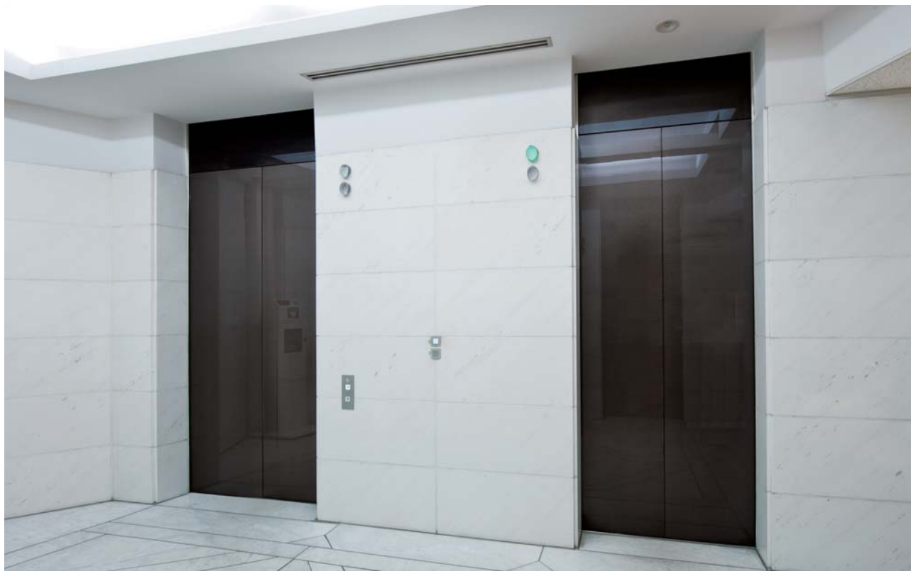
乗用24人乗りエレベーター・1階ホール