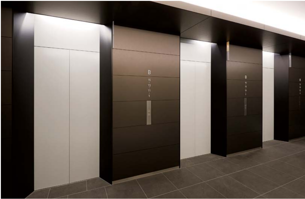
乗用22人乗り(44人乗り)ダブルデッキエレベーター・3階ホール