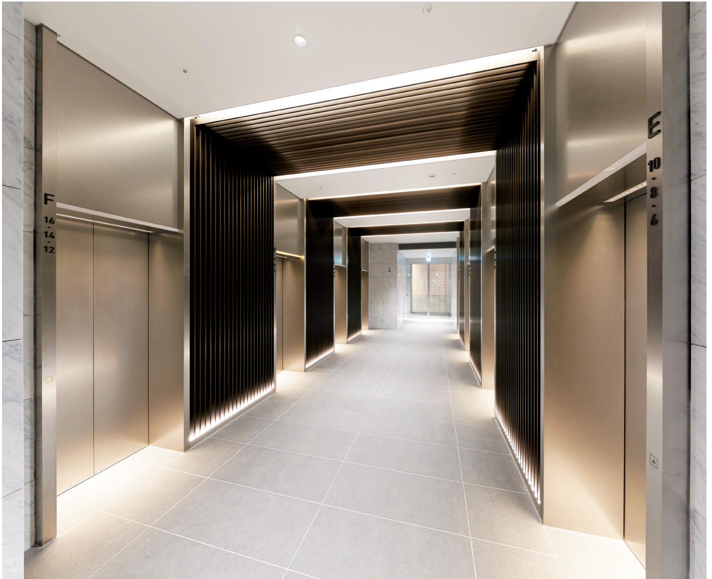
乗用22人乗り(44人乗り)ダブルデッキエレベーター・2階ホール

グランドプリンス赤坂跡地に誕生した複合市街地・東京ガーデンテラス紀尾井町—この街を構成する建物のひとつが、地上36階の紀尾井タワーです。地下鉄永田町駅に直結し、赤坂見附駅からも徒歩1分、オフィスフロアへのアクセスは大容量の階間調整式ダブルデッキエレベーター（二階建てエレベーター）が快適にサポートします。1～4階は、レストランやカフェが集う商業施設・紀尾井テラスとなっています。