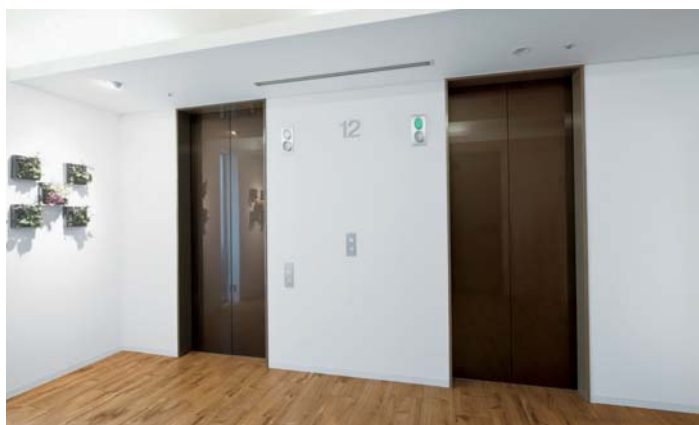
乗用24人乗りエレベーター・12階ホール