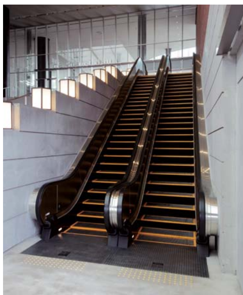
エスカレーター・六角堂広場