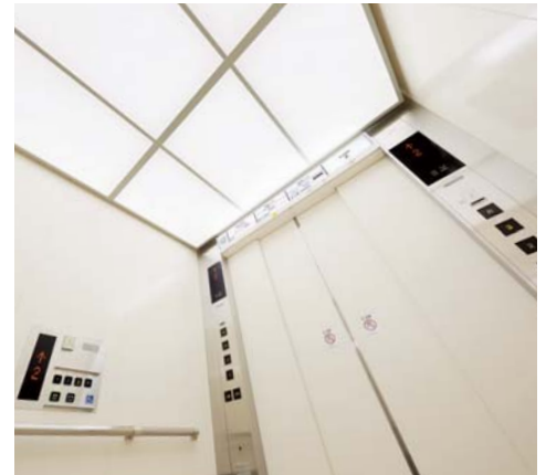
乗用30人乗りエレベーター・かご室天井