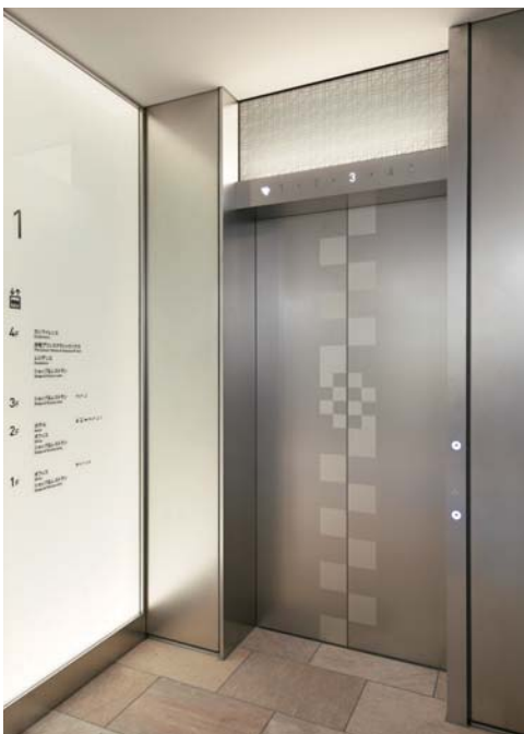
乗用15人乗りエレベーター・2階ホール