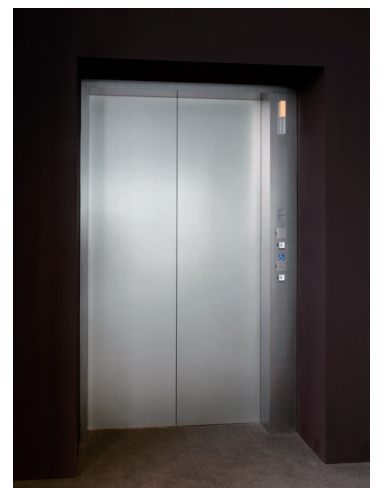
乗用27人乗りエレベーター・12階ホール