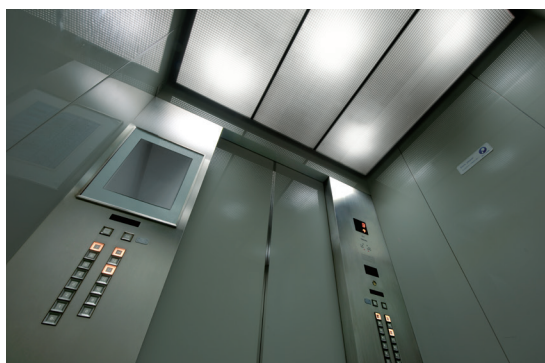
乗用24人乗りエレベーター・かご室天井(リニューアル前)