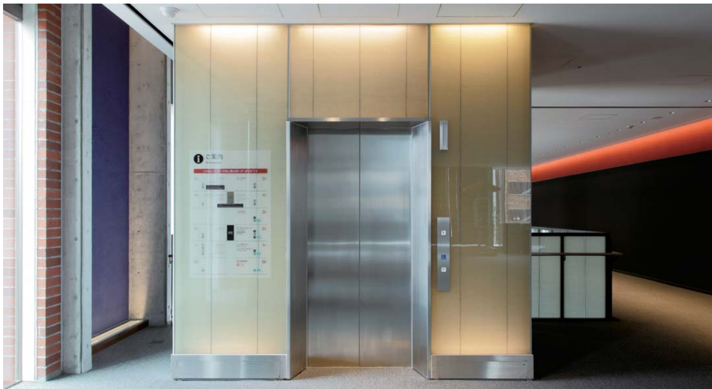
乗用15人乗りエレベーター・3階のりば