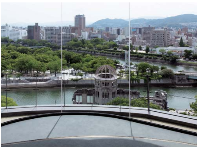
おりづる広場(12階)から原爆ドームを望む