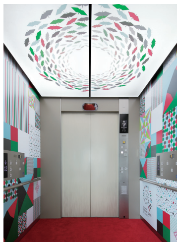
乗用27人乗りエレベーター・かご室