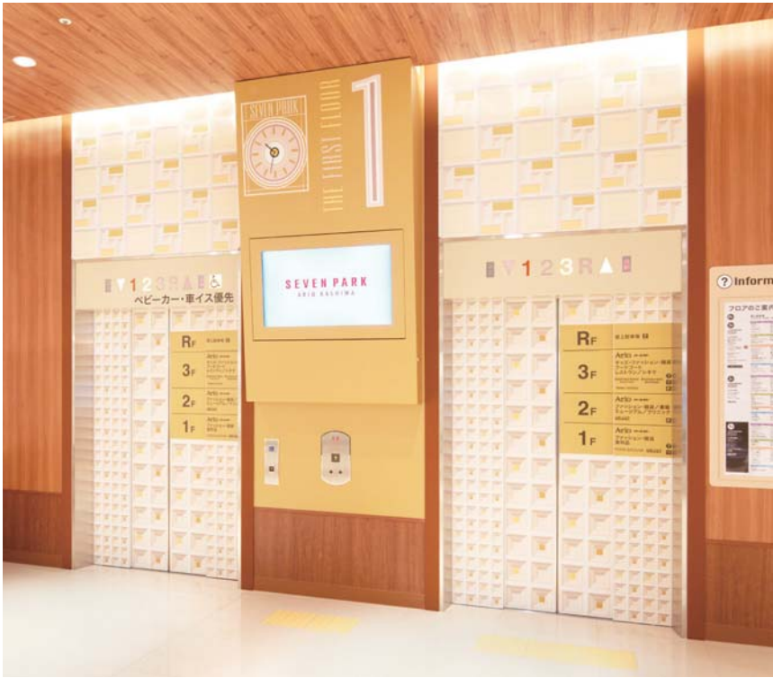
乗用30人乗りエレベーター・1階ホール(イエローエレベーター)