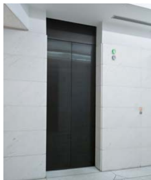
乗用12人乗りエレベーター・1階ホール(リニューアル前)