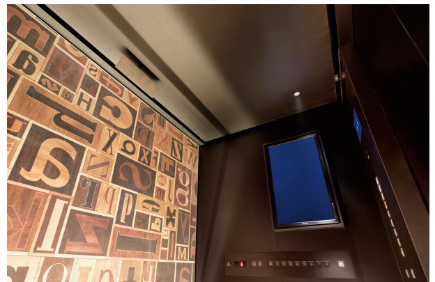
展望用24人乗りエレベーター・かご室(背面)