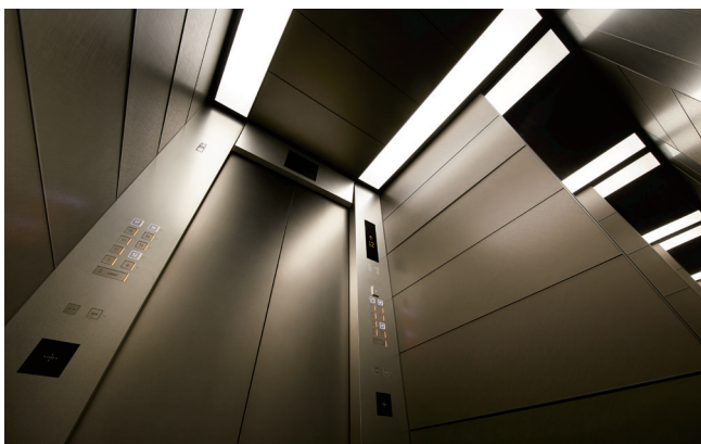
乗用22人乗り(44人乗り)ダブルデッキエレベーター・かご室天井