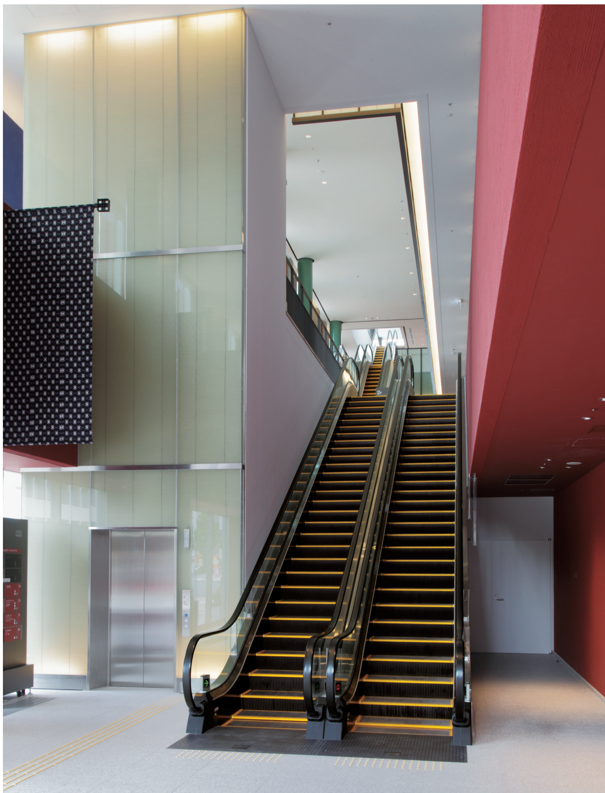
乗用15人乗りエレベーターとエスカレーター・1階ホール

久留米市に、大中小の3つのホールを中心に、会議室や交流スペース、全天候型のイベント広場などを備えた複合施設がオープンしました。優れた音響性能を誇る4層1500席のザ・グランド・ホールは、コンサートやオペラ、本格的舞台芸術に対応。文化施設としてはもちろん、市民や企業間の交流施設として、街の活性化に寄与することが期待されています。