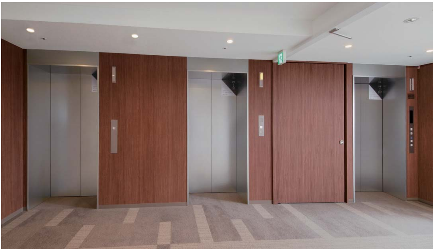
乗用17人乗り・人荷用17人乗りエレベーター・12階ホール