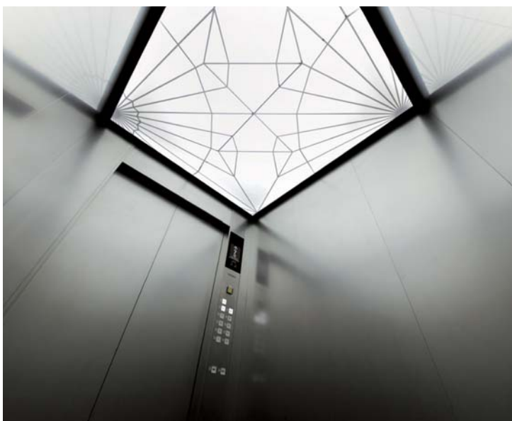
乗用17人乗りエレベーター・かご室天井