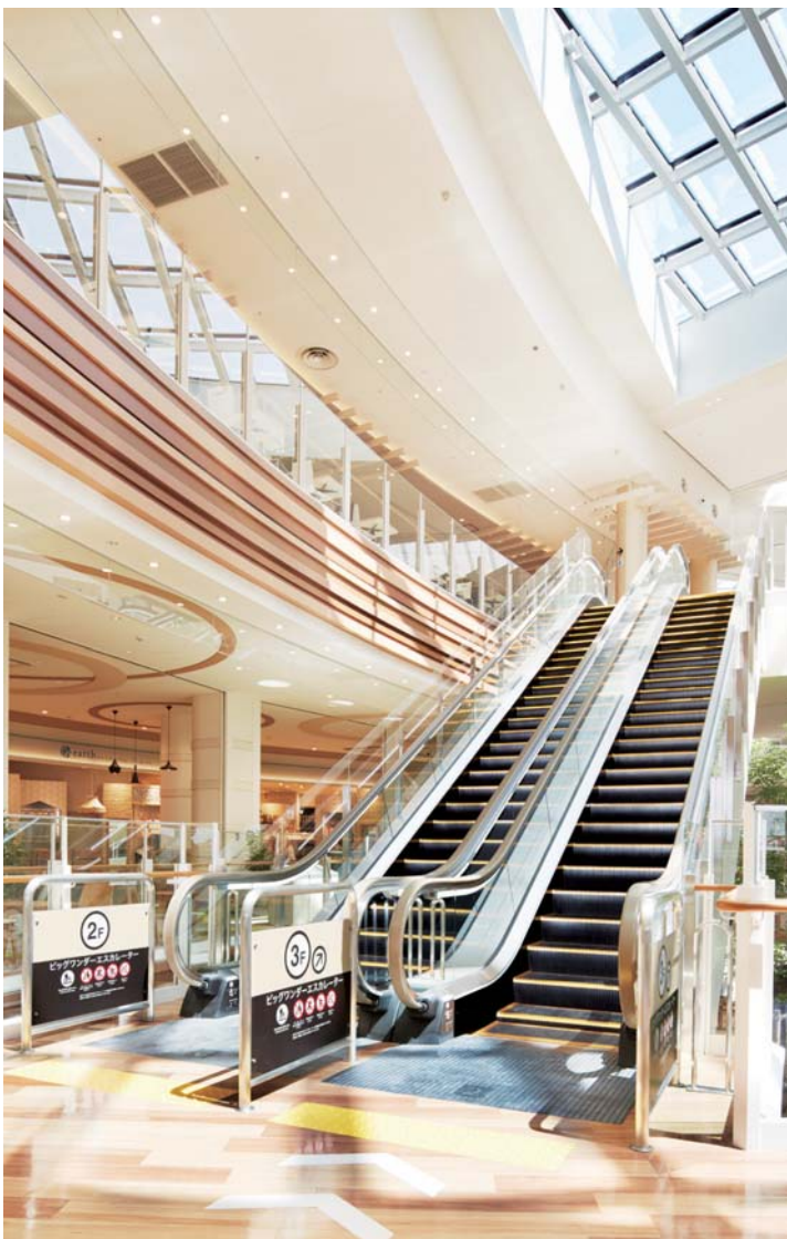
エスカレーター・2階(ビッグワンダーエスカレーター)