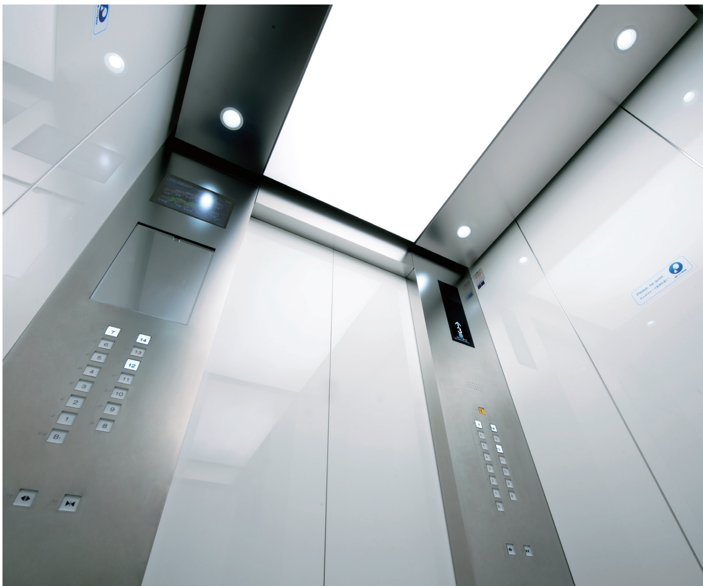
乗用24人乗りエレベーター・かご室天井

うま味調味料「味の素」の販売を開始して100年余、アミノ酸の技術を中核に食品から医薬品原料までを手がけるグローバル企業として発展してきた味の素は、“Eat Well, Live Well.”をスローガンに、人々の食と健康を支えつづけています。白いタイルとガラス窓の縞模様が印象的な現在の本社ビルが建設されたのは1991年—竣工25周年を迎えて、エレベーターがリニューアルされました。