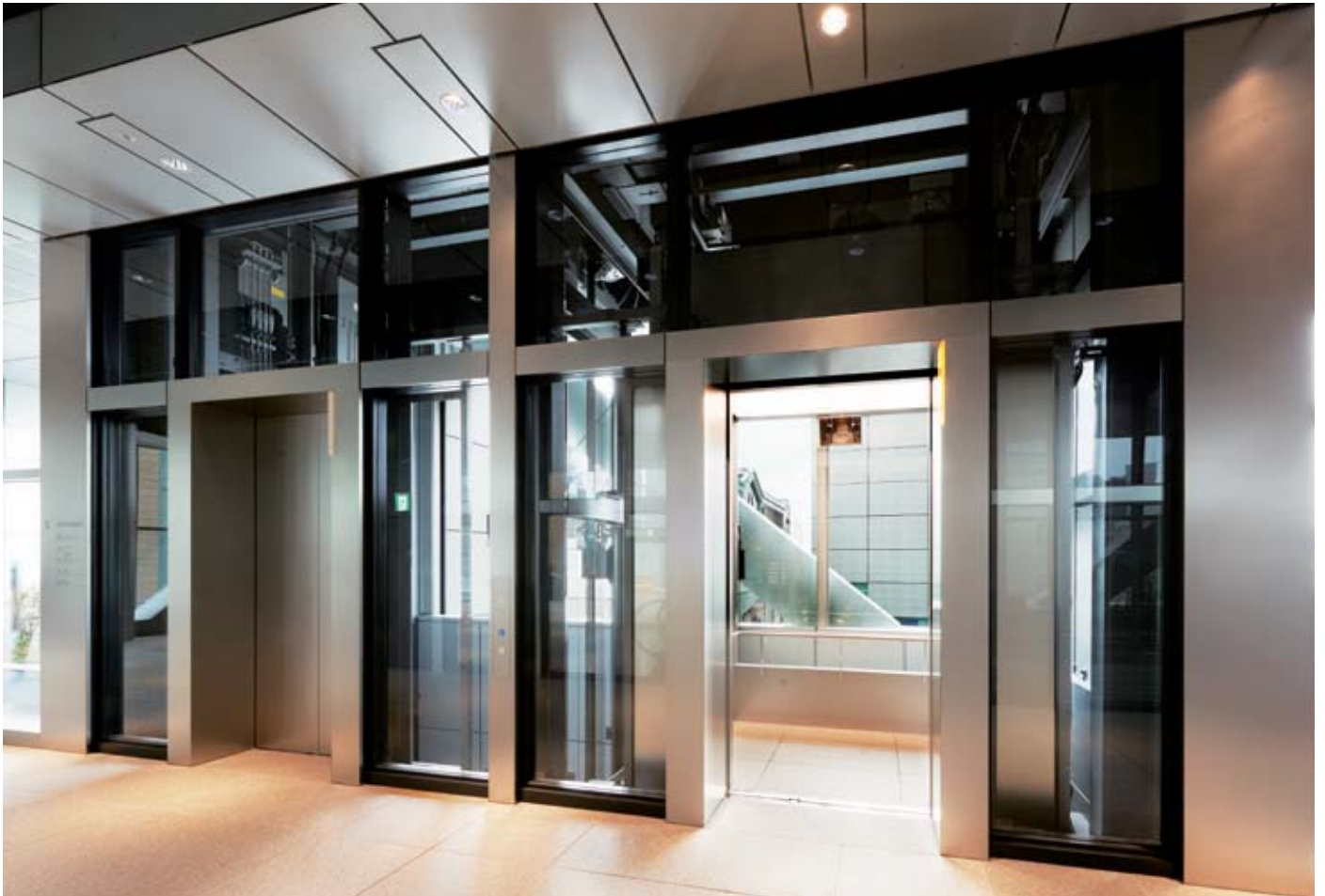
展望用16人乗りエレベーター・5階ホール