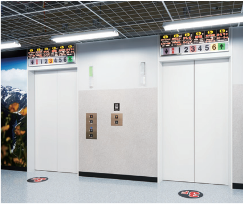
乗用20人乗りエレベーター・3階ホール

JR新潟駅構内で20年間営業を続けてきたヨドバシカメラ新潟店が駅前の新店舗に移転、リニューアルオープンしました。1～6階の店舗フロアは総面積5900㎡の広さで、品数も11万点とこれまでの約2倍に増加。スマートフォンや4Kテレビといった話題性の高い商品はもちろん、プラモデルやゲームなど県内でもトップクラスの品ぞろえで話題を集めています。