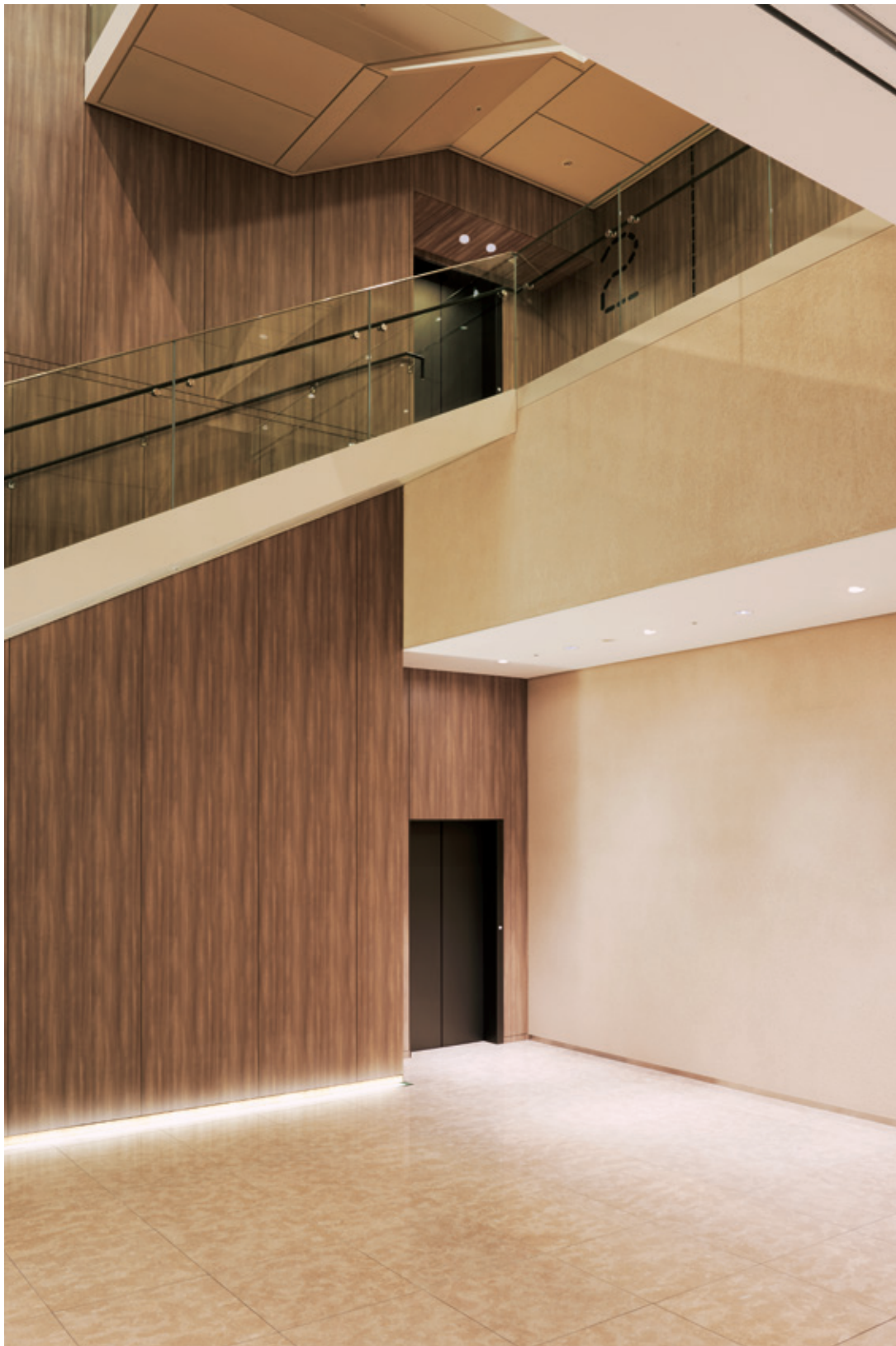
乗用15人乗りエレベーター

東京・芝浦エリアに、オンワードベイパークビルディングが完成しました。オフィスフロアは仕切りのないオープンスペースになっており、木をふんだんに使ったステップテラスが、ぬくもりのあるコミュニティ空間を作り出しています。また、2階にはレストラン「シェアパークカフェ&ダイニング」が設置され、レインボーブリッジを望む、洗練された大人のダイニングを楽しめます。