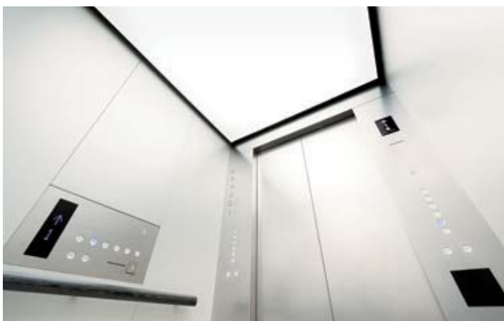
乗用24人乗りエレベーター・かご室天井