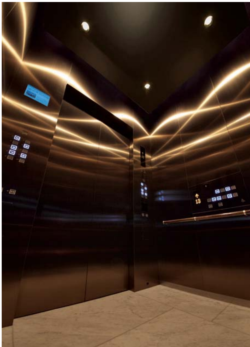
乗用24人乗りエレベーター・かご室天井