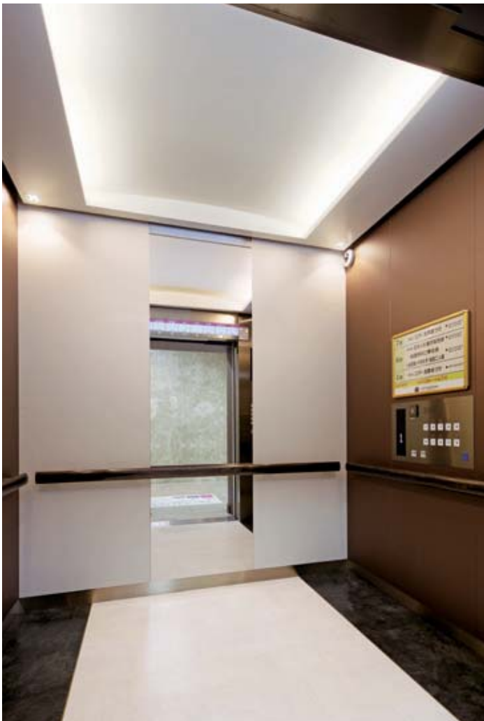
乗用24人乗りエレベーター・かご室