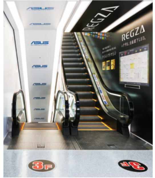
エスカレーター・3階のりば