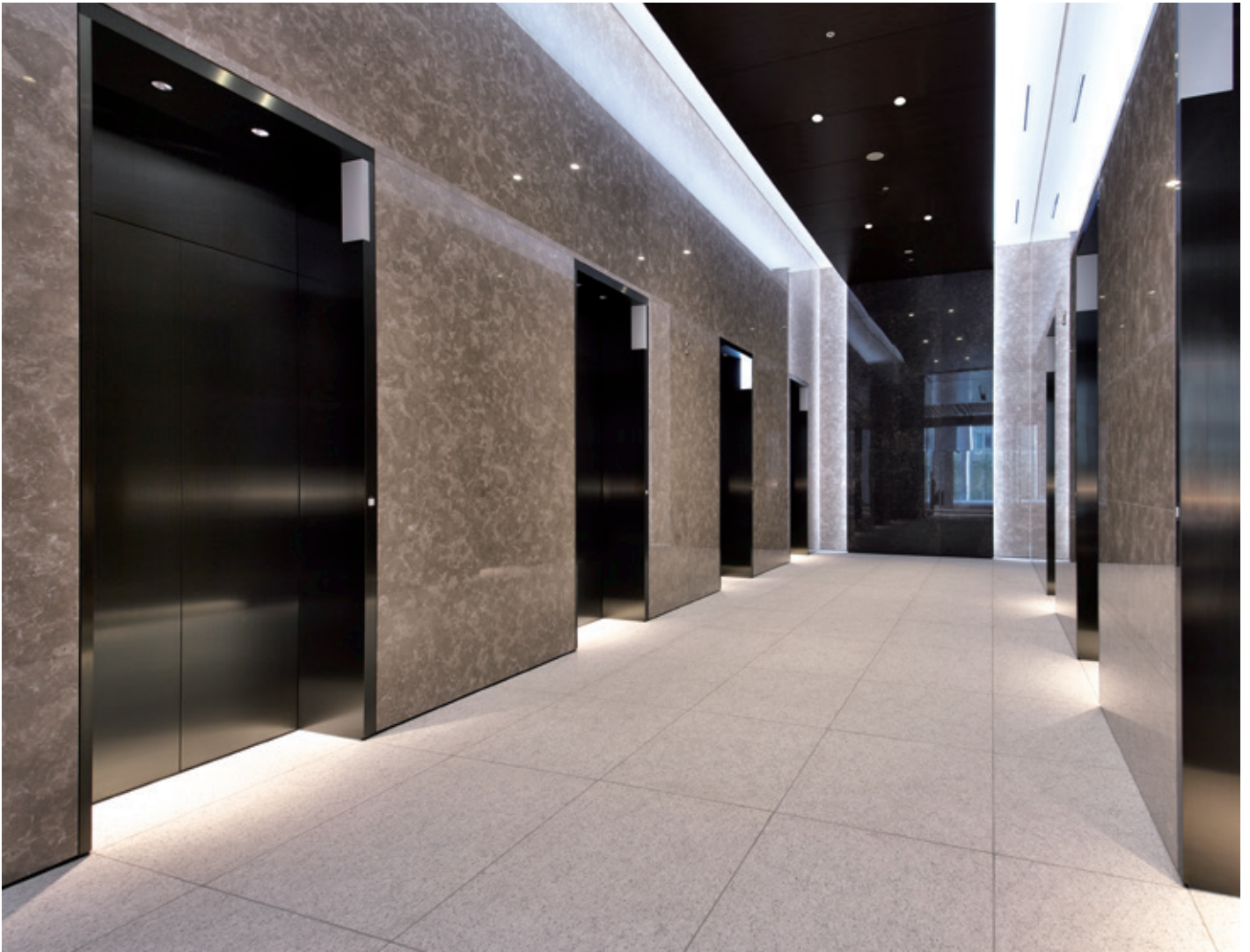
乗用24人乗りエレベーター・2階ホール

建設ラッシュが続くJR名古屋駅前、旧名古屋中央郵便局跡地に、新たなタワービルが誕生しました。駅から徒歩1分、2階のオフィスエントランスと駅は貫通路で結ばれています。地下3階、地上40階・延床面積約18万㎡の中部圏最大級のタワービルです。多彩なショップとレストランが集う商業施設KITTE名古屋も配置され、ビジネスマンにとって快適で便利な環境が整えられています。