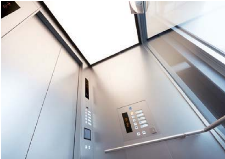
展望用16人乗りエレベーター・かご室天井