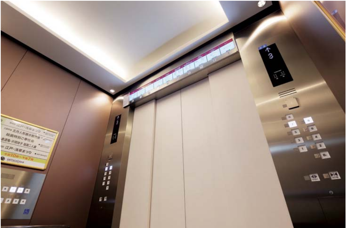
乗用24人乗りエレベーター・かご室天井