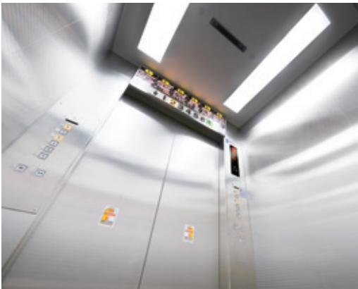
乗用20人乗りエレベーター・かご室天井