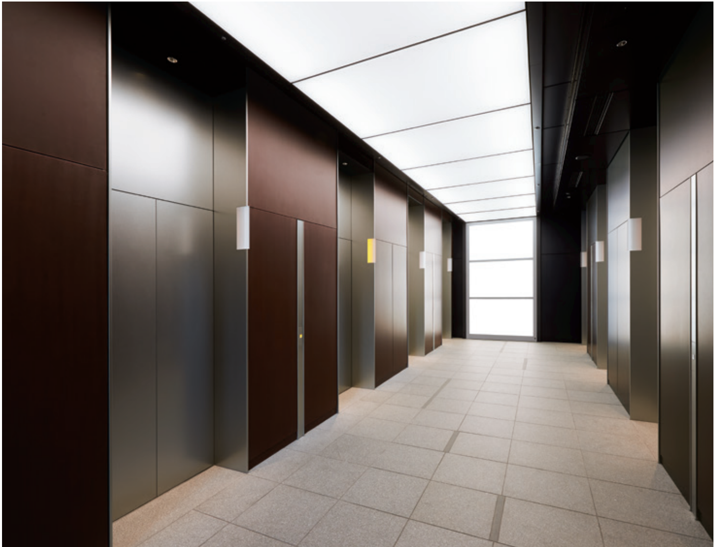
乗用27人乗りエレベーター・5階ホール

JR新宿駅に直結した地上32階建の超高層オフィスタワーが誕生しました。改札につながる2階エントランスから5階オフィスロビーまでダイレクトに行くことができます。商業、クリニック、ホール、子育て支援施設、バスターミナルなども併設した複合施設として、新宿に新しいにぎわいを創出します。