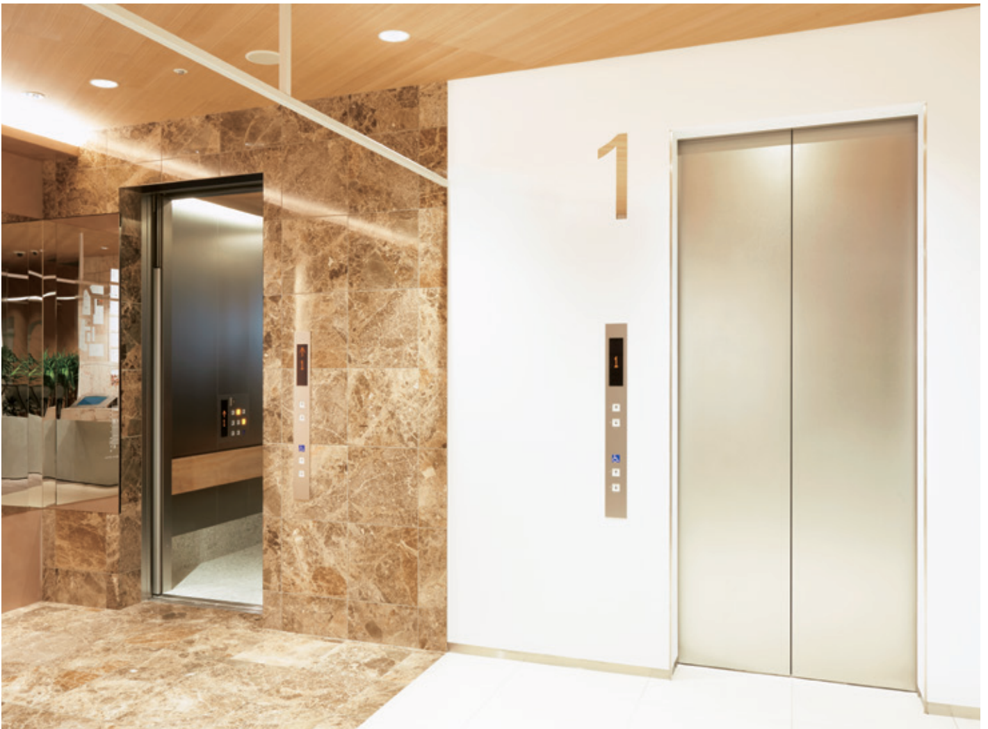
乗用24人乗りエレベーター・1階ホール

NEWoMan(ニューマン)はJR新宿ミライナタワーの商業施設です。大人の女性をメインターゲットに、ファッションからビューティ、フード、カルチャーにいたるまで、新しいライフスタイルを提案する世界の最先端ショップ約50店が集結。さらに認可保育所やクリニックなど、働く女性のためのサービスも充実しています。