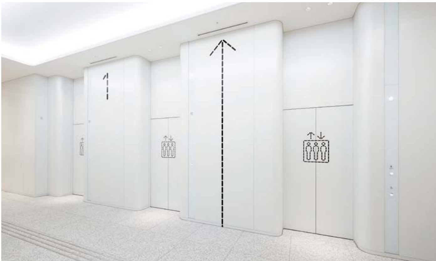
乗用24人乗りエレベーター・1階ホール