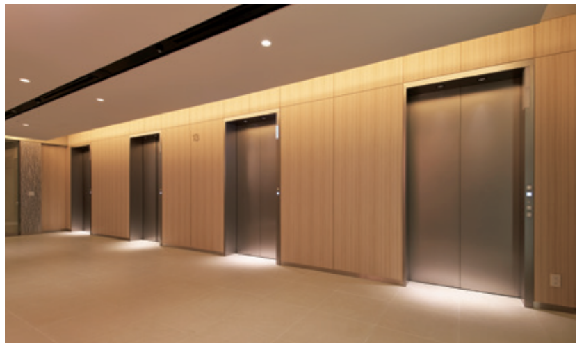
乗用24人乗りエレベーター・13階ホール