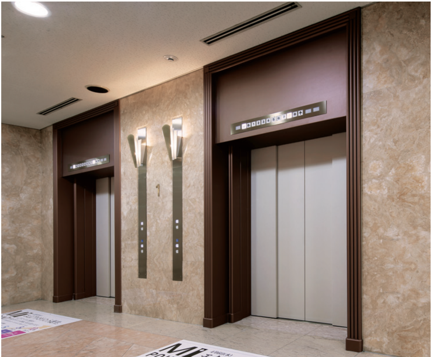
乗用24人乗りエレベーター・1階ホール

今年70周年を迎える松山三越は、道後温泉にもほど近い松山市の中心部にある老舗の百貨店です。戦後まもない1946年に開店し、松山の産品を都市圏に送るなどして全国の復興に貢献。以降、ファッションショーをはじめ、話題性のあるイベントを次々に開催し、松山と全国の文化・経済をアクティヴに結ぶ役割を担ってきました。このほどエレベーターがリニューアルされました。