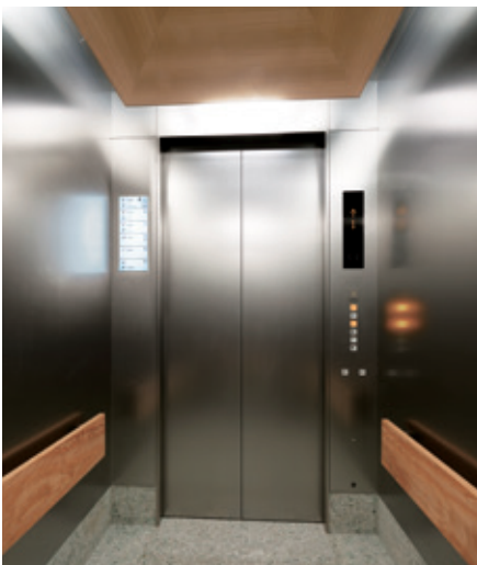
乗用24人乗りエレベーター・かご室