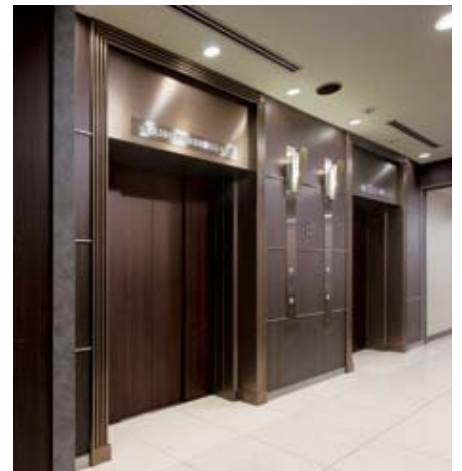
乗用24人乗りエレベーター・地下1階ホール