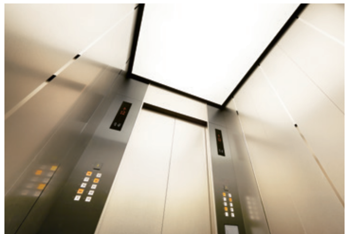
乗用27人乗りエレベーター・かご室天井