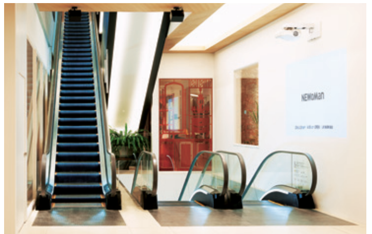
2階エスカレーター