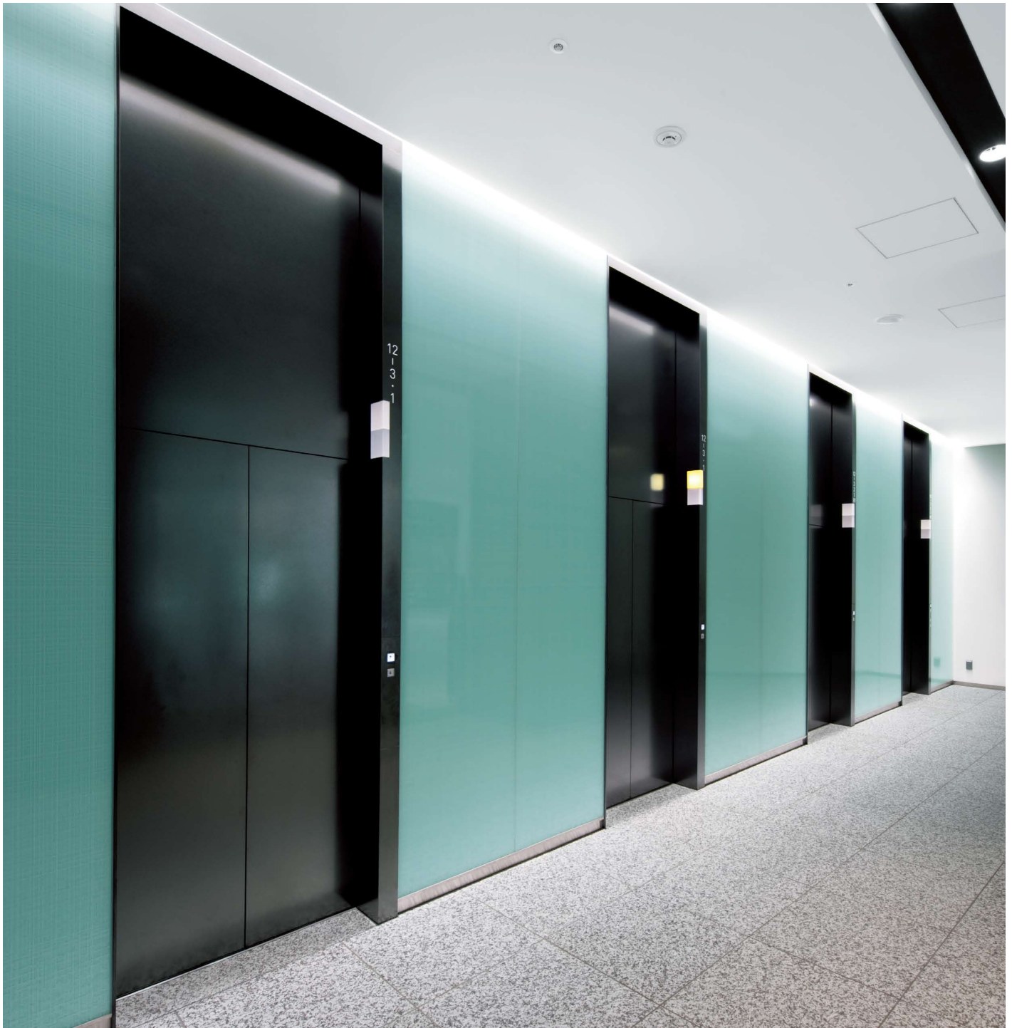
乗用17人乗りエレベーター・1階ホール

東京駅から10分、ビジネスエリアとして発展する日本橋地区に、オンワードホールディングスの新社屋が竣工しました。同社の本社機能を中心にした地上16階のオフィスビルで、布地の縦糸と横糸をイメージさせるデザインが、印象的な外観を作り出しています。敷地外周部には緑豊かな公共スペースが配置され、地域の人々も活用できる憩いの場となっています。