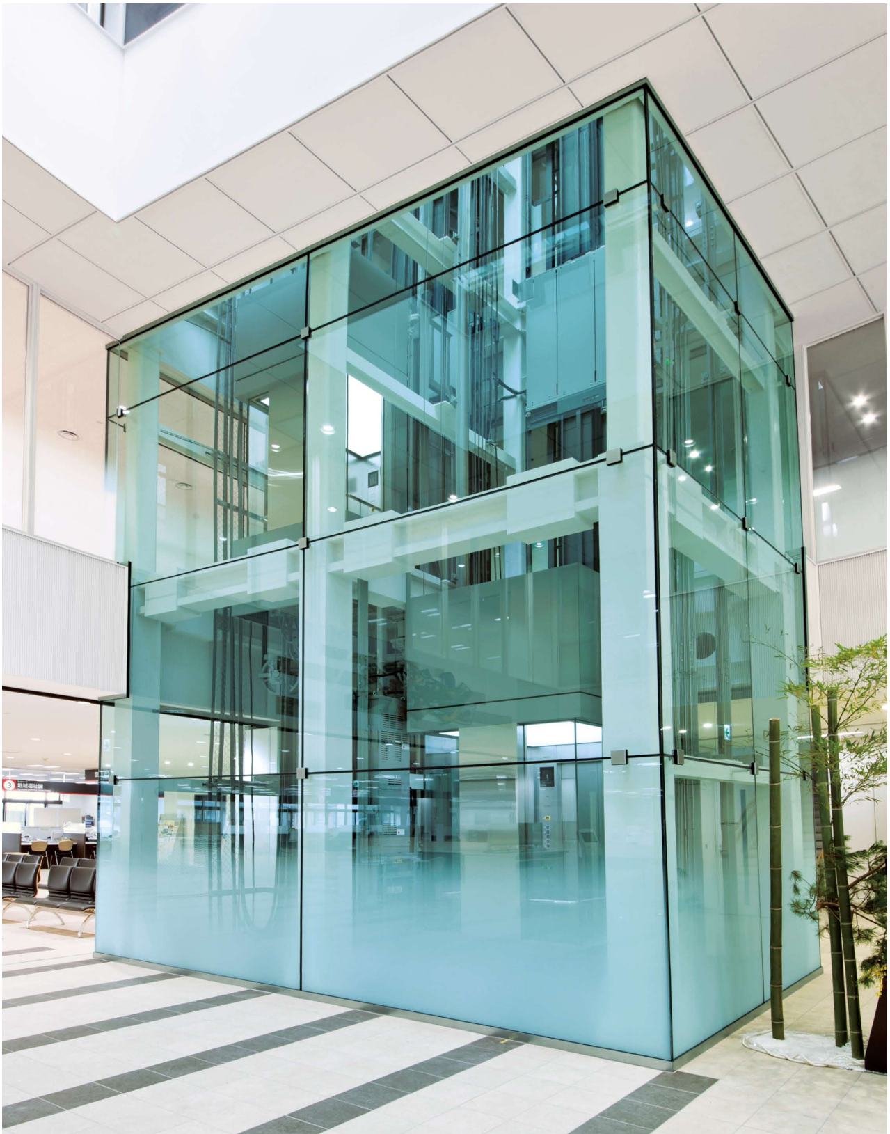
展望用エレベーター・昇降路

半田市は古くから海運業・醸造業で栄え、愛知県知多地域の政治・経済・文化の中心都市として発展してきました。新庁舎は同市のシンボルともなっている黒板囲いの製造蔵をイメージしたもので、市民の知恵を集積・共有・活用する“現代の蔵”として、また、災害時には緊急避難施設および災害復興拠点として、市民の安全と安心を守る役割を果たしていきます。