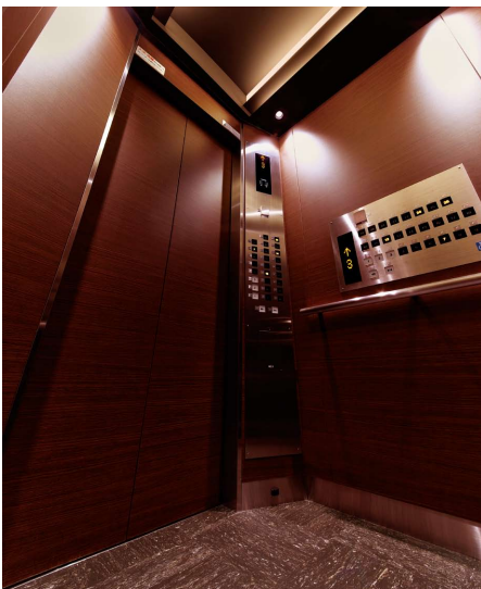
乗用11人乗りエレベーター・かご室