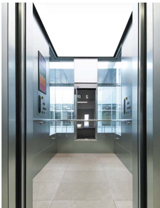
展望用エレベーター・かご室