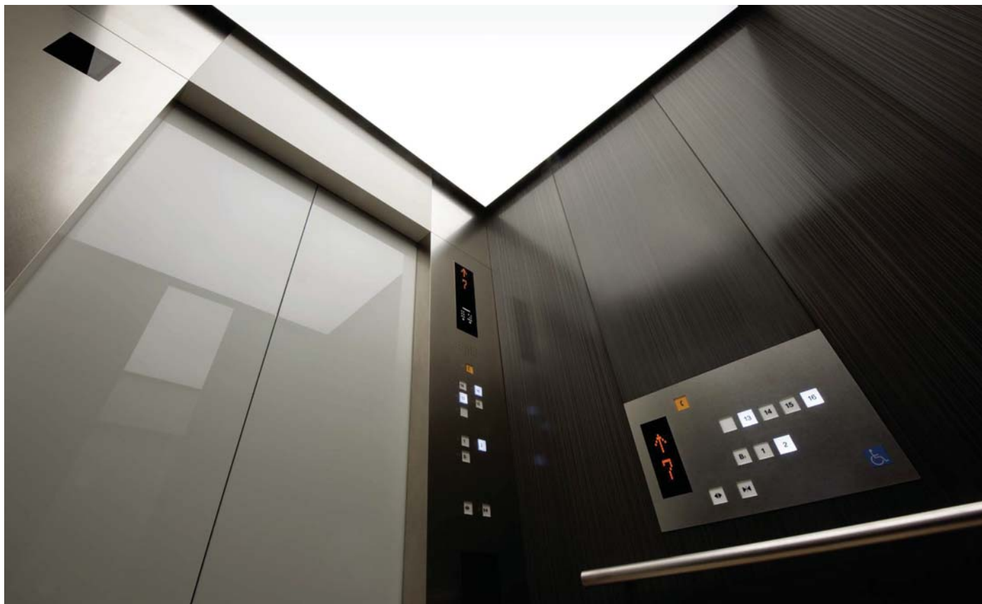
乗用17人乗りエレベーター・かご室天井