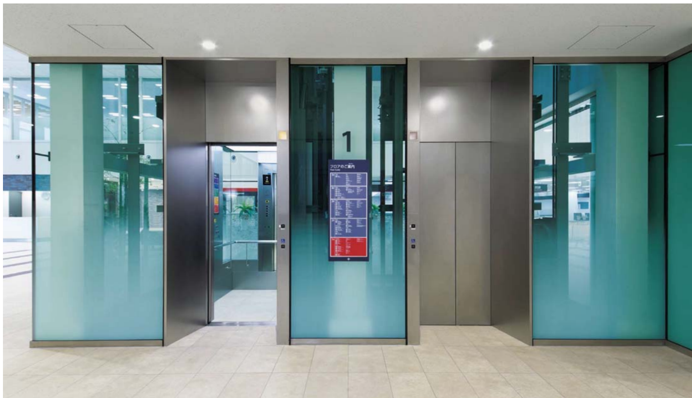
展望用エレベーター・1階ホール