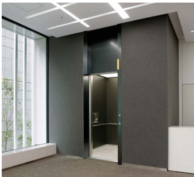
乗用20人乗りエレベーター・2階のりば