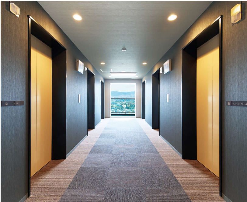
乗用11人乗りエレベーター・26階ホール

新しい街づくりが進むJR高槻駅前地区に、地上42階のジオタワー高槻ミュージズガーデンが誕生しました。駅から徒歩5分、直結する歩行者デッキで駅周辺の商業施設にも快適にアクセスできます。敷地にはマンションを囲む広大な庭が広がり、居住者専用のプライベートガーデンも設置されて、豊かな緑や四季折々の花を暮らしの中で楽しめるようになっています。