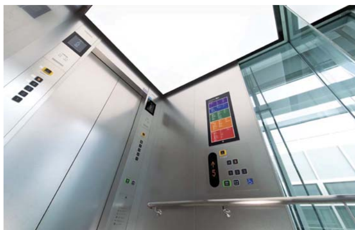
展望用エレベーター・かご室天井