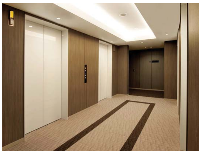
乗用11人乗りエレベーター・22階ホール