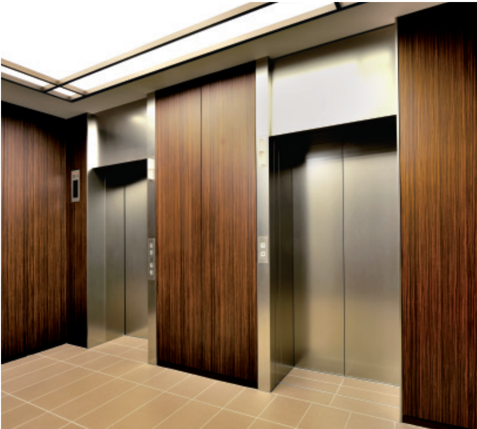
乗用・非常用エレベーター(No.2、3)・2階ホール