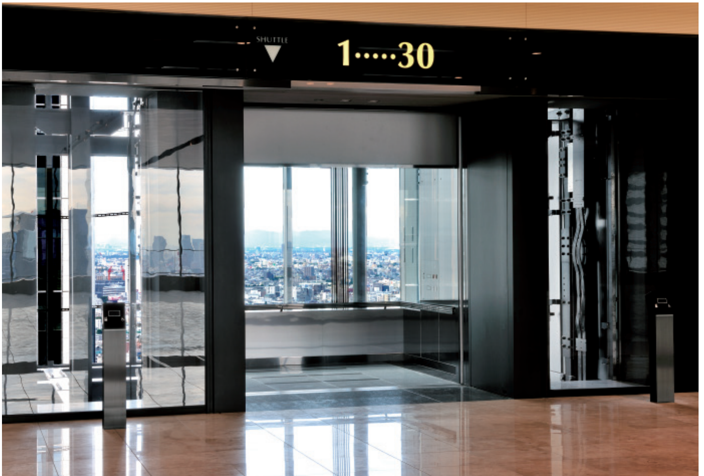
展望用75人乗りシャトルエレベーター・30階ホール

住友不動産新宿グランドタワーは、1～30階を33秒で移動できる75人乗りのシャトルエレベーターをはじめ最先端の設備を備えたオフィスと集合住宅の超高層複合ビルです。約2ヘクタールの敷地にはイベントホールや商業施設が並び、緑豊かな広場は災害時の防災拠点として機能するなど、時代の要請を総合的に反映した“街空間”が実現しています。