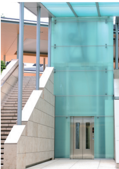
乗用15人乗りエレベーター(No.11)・昇降路(屋外)