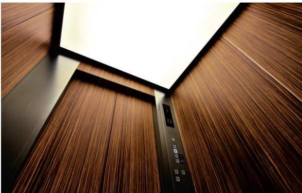
乗用15人乗りエレベーター・かご室(No.2)