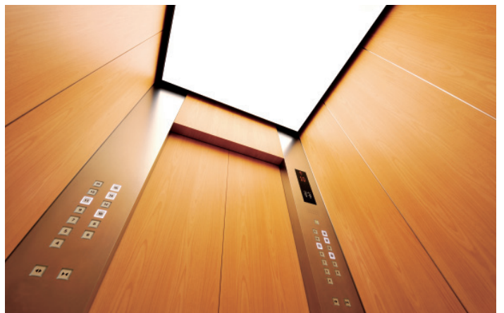
乗用15人乗りエレベーター・かご室天井