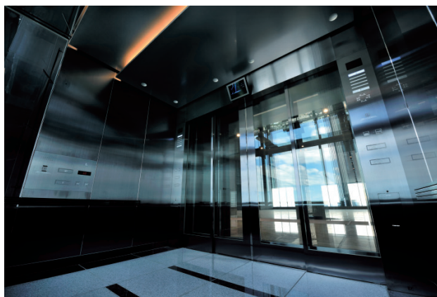
展望用75人乗りシャトルエレベーター・かご室