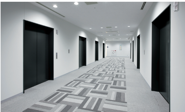
乗用エレベーター・9階ホール