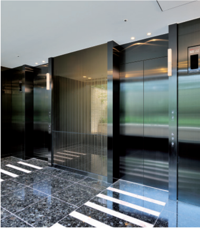
人荷用(兼非常用)26、17人乗りエレベーター・地下1階ホール(レジデンス)