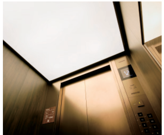
乗用エレベーター・かご室天井