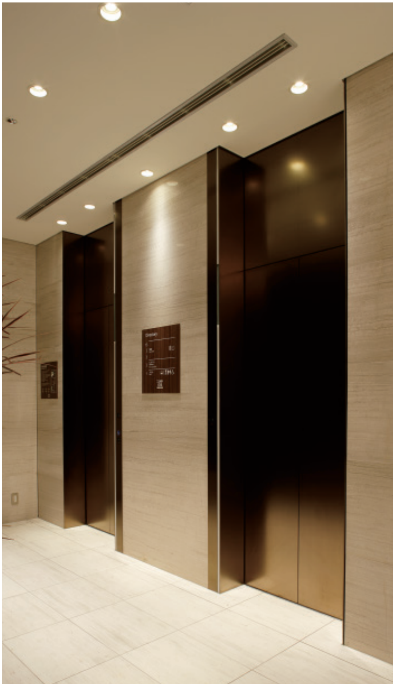
乗用エレベーター・ロビー階ホール

全国で「西鉄イン」を展開してきた西鉄グループが、一段グレードアップされた「ソラリア西鉄ホテル」を銀座にオープンしました。コンセプトは“銀座を訪れる人々の都市別荘”―機能的なシングルから豪華なエグゼクティブダブルルームまで5種類の客室が用意され、ビジネスはもちろん、ショッピングや観劇など銀座ならではのハイグレードな時間を楽しめるホテルです。