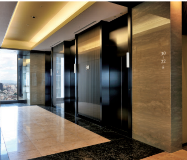
乗用33人乗りエレベーター・30階ホール