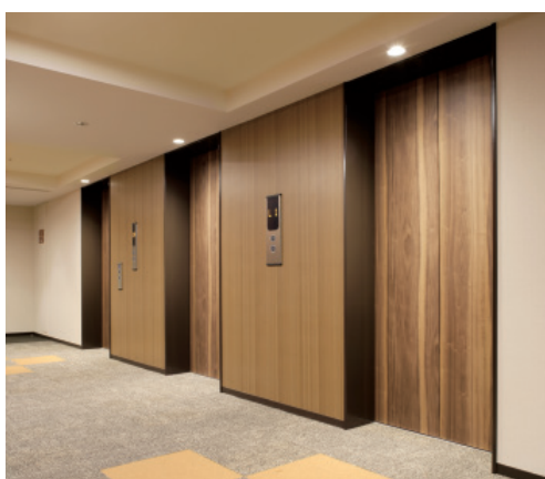
乗用13人乗りエレベーター・客室階ホール