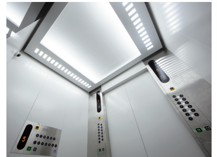
乗用エレベーター・かご室天井