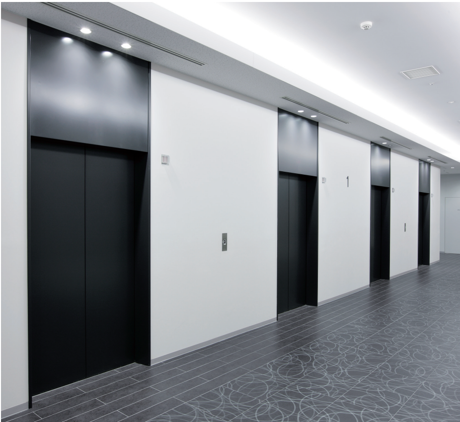
乗用エレベーター・1階ホール

神戸・ハーバーランド地区に新設した川崎重工業の新総合事務所棟は、太陽光や風力などの自然エネルギーを積極的に取り入れた、建物周りの広範な緑化によるヒートアイランドの軽減などが高く評価され、CASBEE（建築環境総合性能評価システム）の最高ランクを獲得しました。