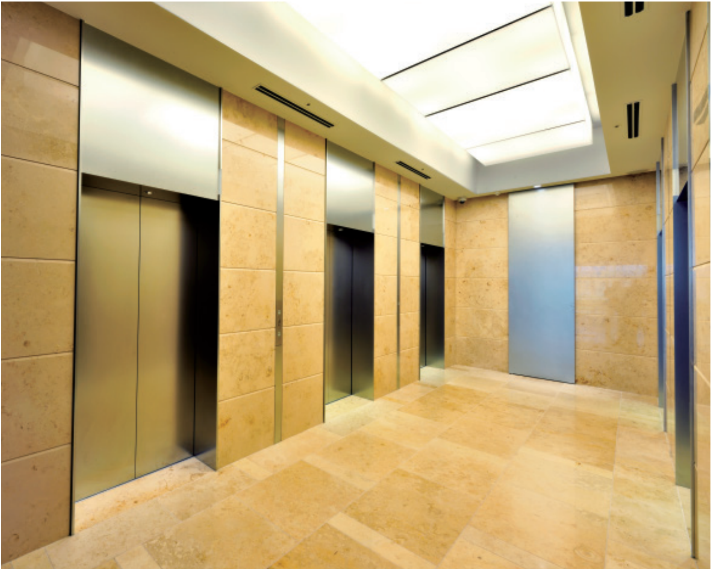
乗用15人乗りエレベーター(No.5~10)・ロビー階ホール

JR・地下鉄の目黒駅から徒歩4分、既存のアルコタワーに隣接して、地上16階・地下1階の新たな先進オフィスビルが誕生しました。広大な敷地には、意匠をこらした建築で知られる創業80年余の目黒雅叙園の和風庭園があり、その豊かな緑の中に、やわらかな曲線を描くアウトラインと明るいガラス壁が開放感あふれる景観をつくりだしています。