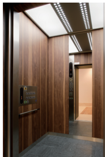
乗用13人乗りエレベーター・かご室