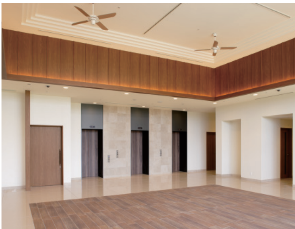
乗用13人乗りエレベーター・ロビー階ホール

再開が進む沖縄・那覇市の“新都心”おもろまちに、客室数243室の大型ホテルがオープンしました。空港からモノレールで19分、近くには世界最大級の免税店やショッピングモールが並び、最上階のレストランからは那覇市街や泊港の夜景を楽しめます。ビジネス拠点としての機能性とリゾートテイストを兼ね備えた新感覚のビジネス・リゾートホテルです。