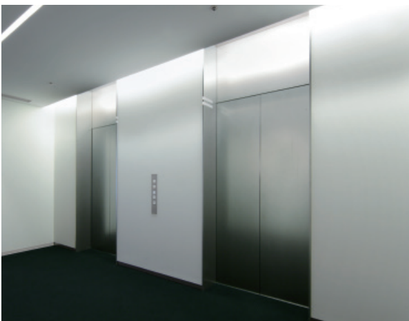
乗用15人乗りエレベーター・8階ホール(事務所)