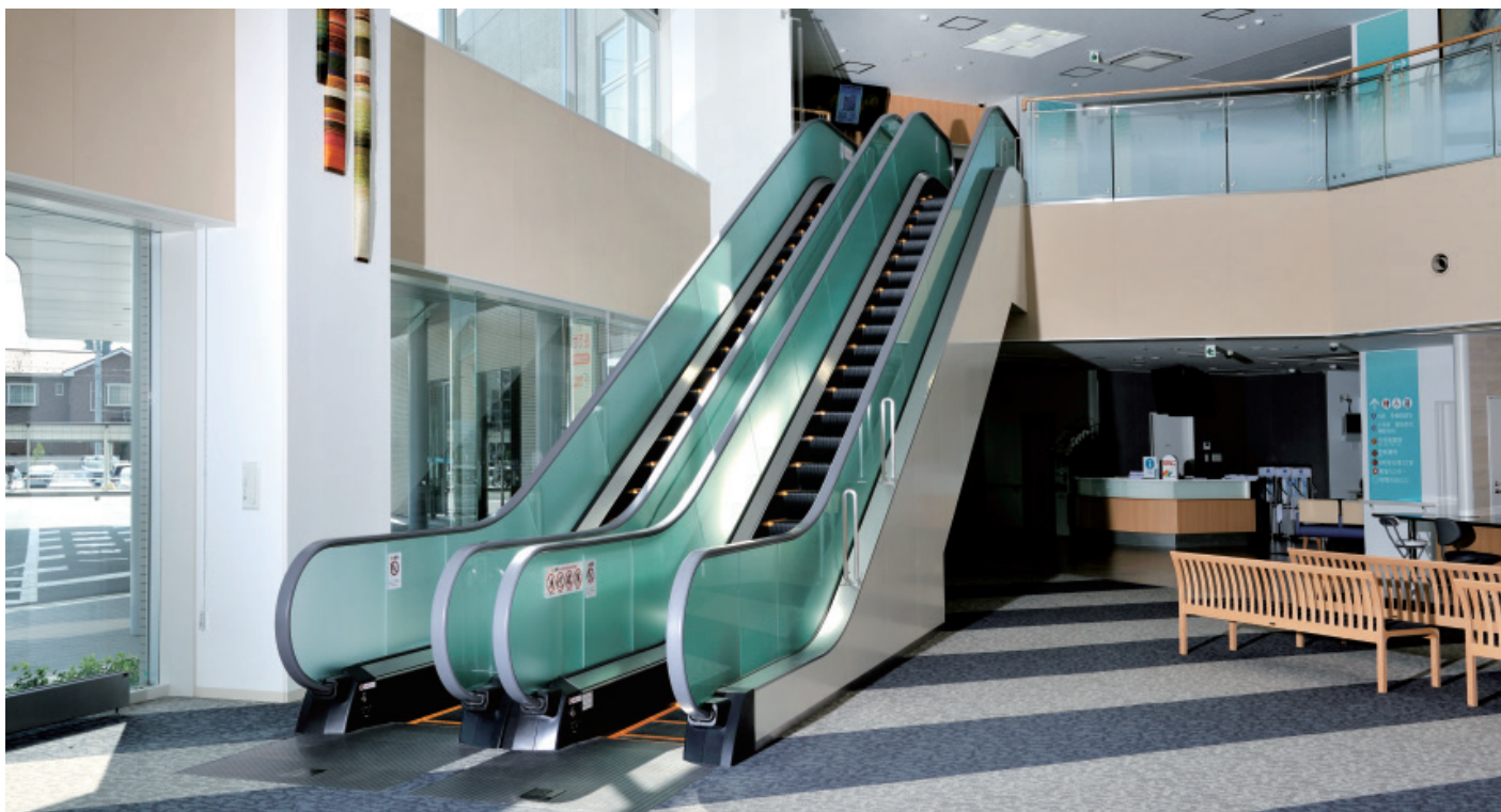
エスカレーター・1階

木戸病院は1976年にスタートして、以来35年間、地域に根ざした医療活動を続けてきました。新病院は312床・26診療科目、系列病院・施設との連携のもと、地域の人々に、従来にも増して充実した総合的な健康支援の場を提供していきます。