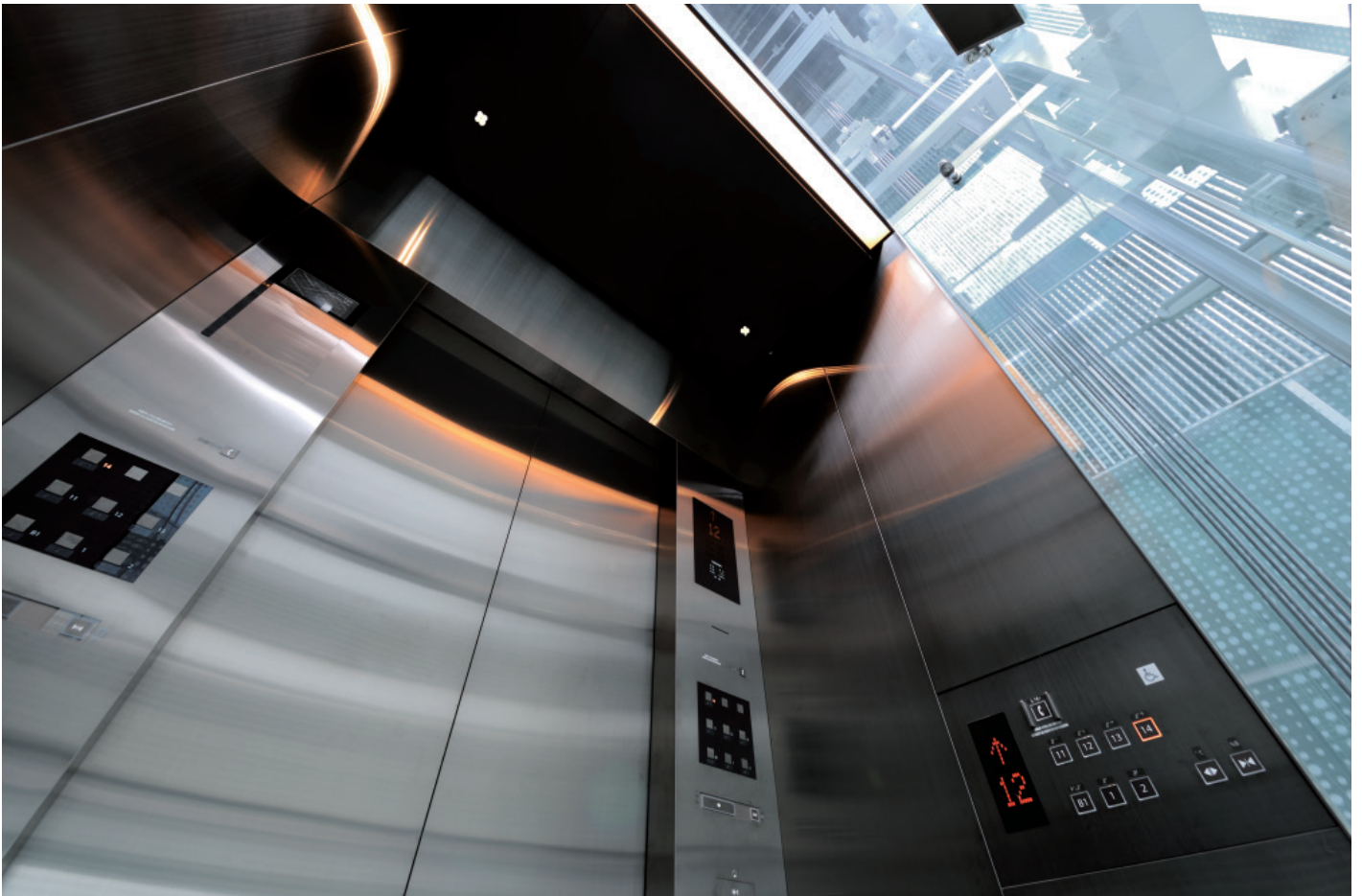
展望用エレベーター・かご室天井