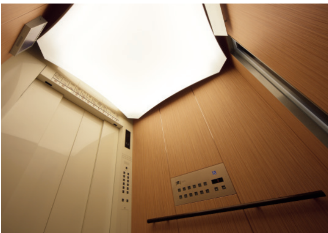
乗用エレベーター・かご室天井