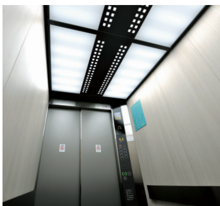
寝台用エレベーター・かご室