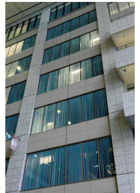
乗用エレベーター外観