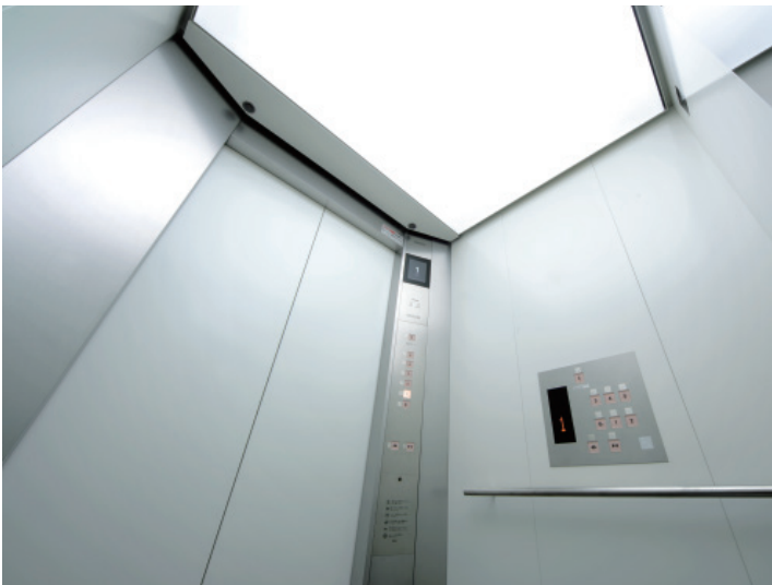
乗用15人乗りエレベーター・かご室天井(店舗)