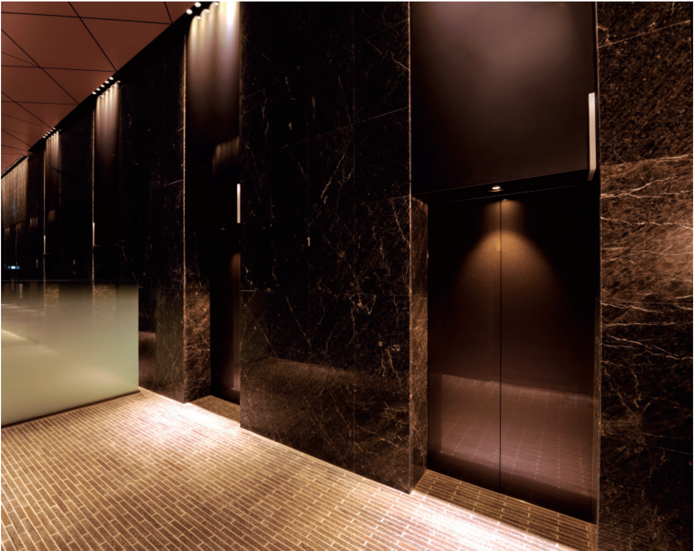
乗用エレベーター・1階ホール

再開発が進む豊洲のビジネスエリアに地上14階・地下1階のオフィスビルが誕生しました。環境への先進的な対応が高く評価されているビルで、緑豊かな植栽に囲まれたガラスの壁面に映し出される新しい街の風景が印象的です。1階には商業施設と多目的ホールも併設され、街のシンボルとして、豊洲にいっそうのにぎわいをもたらすことが期待されています。