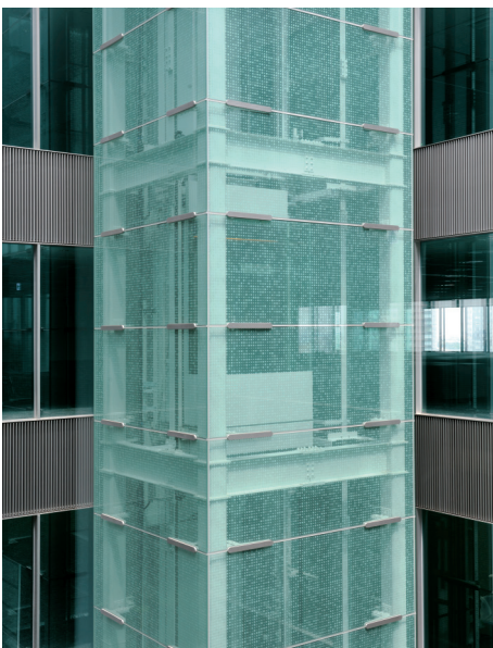
展望用エレベーター・昇降路