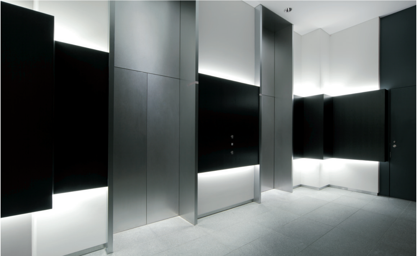
乗用15人乗りエレベーター・1階エレベーターホール(事務所)