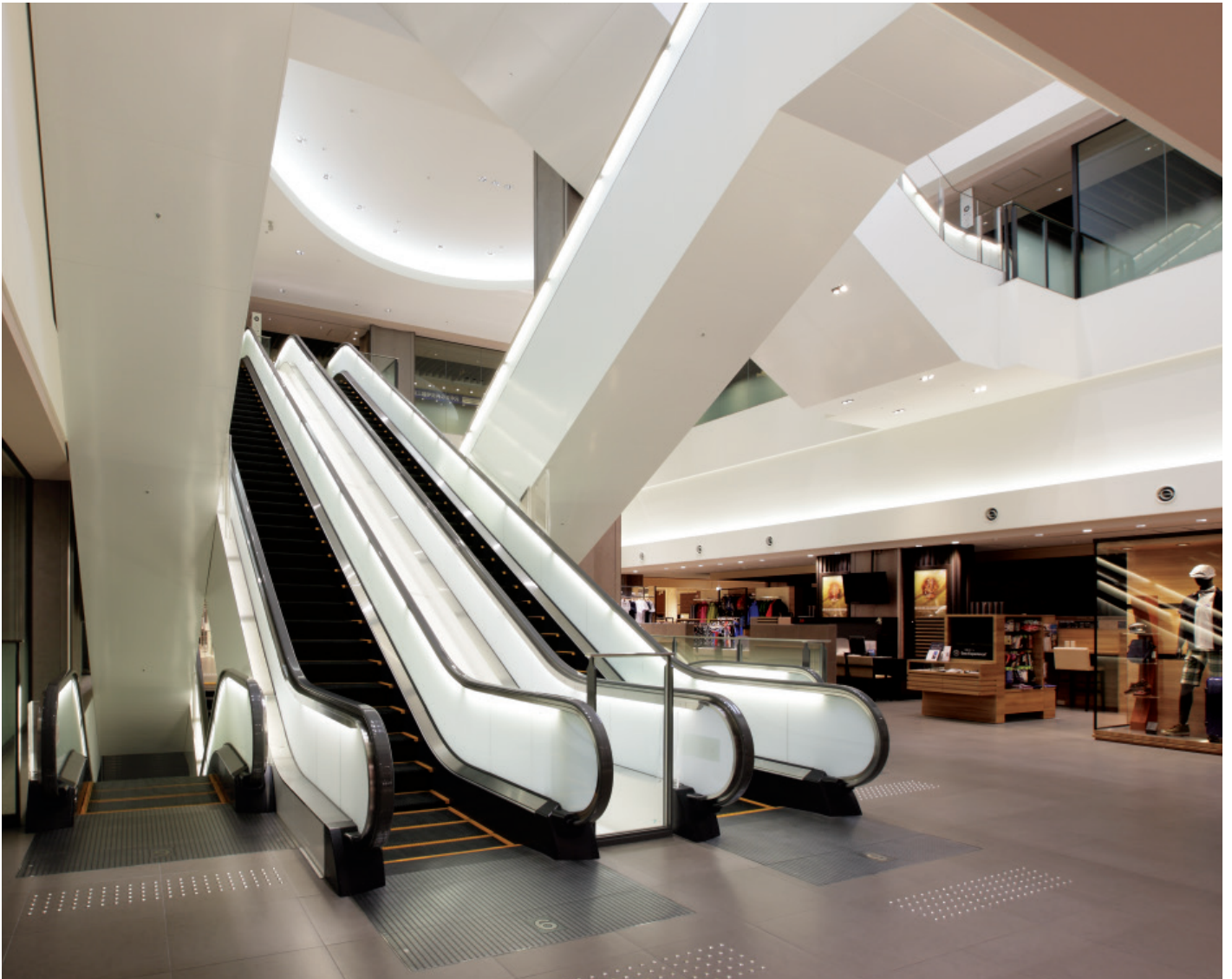
エスカレーター・9階

駅全体が“まち”として生まれ変わったJR大阪駅、その中核をなすノースゲートビルディングに登場したのが、JR大阪三越伊勢丹です。“マイストーリーストア”をコンセプトに、リビング・雑貨・食品にいたるまで顧客ひとりひとりの感性にきめこまかく応える、JR大阪三越伊勢丹ならではのファッションナブルな売場構成が注目を集めています。