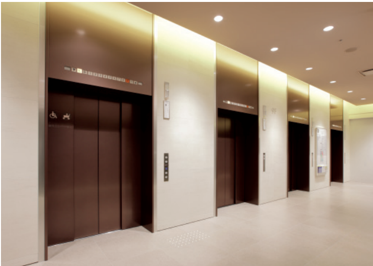
乗用エレベーター・9階ホール