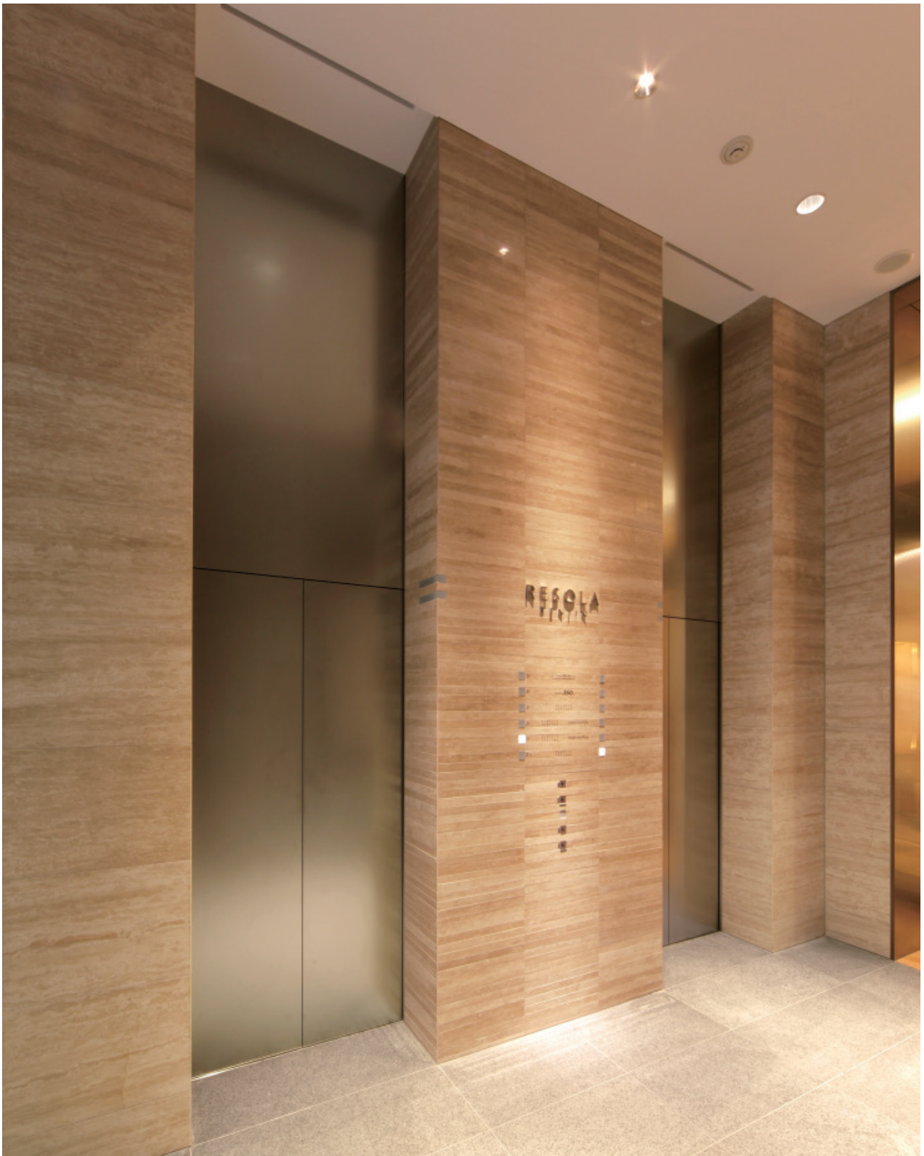
乗用15人乗りエレベーター・1階ホール(店舗)

レソラ天神は、オフィスとの複合ビルの地下1階～地上5階部分を占める商業施設です。「ルイ・ヴィトン福岡店」を核テナントに、九州初進出の高級セレクトショップ「バーニーズ ニューヨーク福岡店」、ミシュラン二つ星のイタリアンレストランなど、世界を代表する選りすぐりの一流店からなるスタイリッシュな店舗構成が大きな話題を呼んでいます。