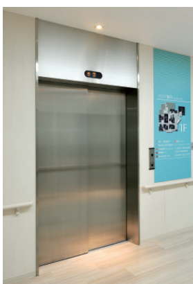
寝台用エレベーター・1階のりば