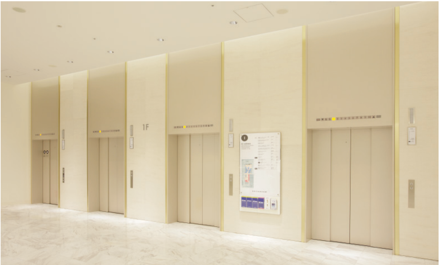
乗用エレベーター・1階ホール