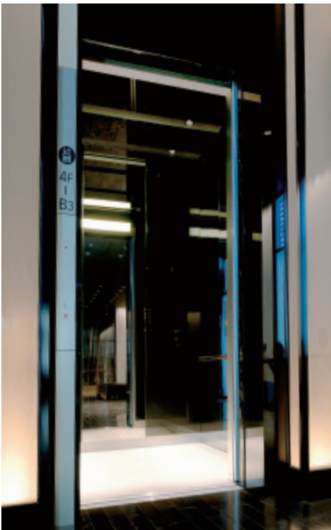
乗用20人乗りエレベーター・かご室