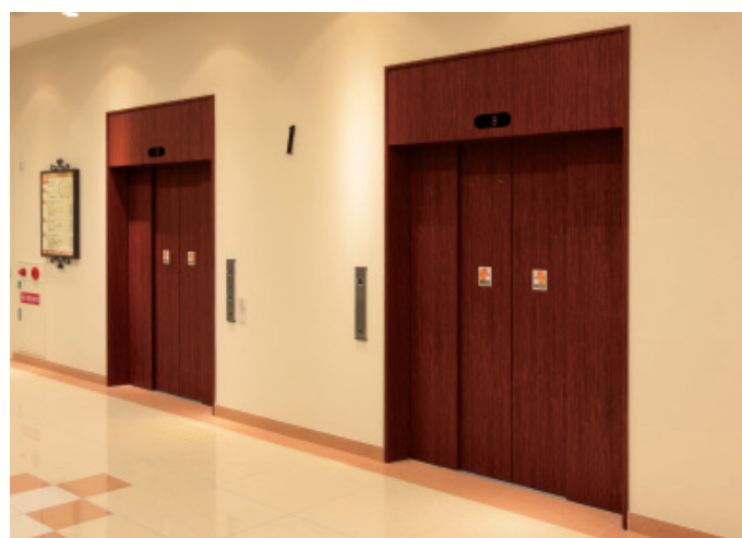
乗用24人乗りエレベーター・1階エレベーターホール(オペラパーク専門店)