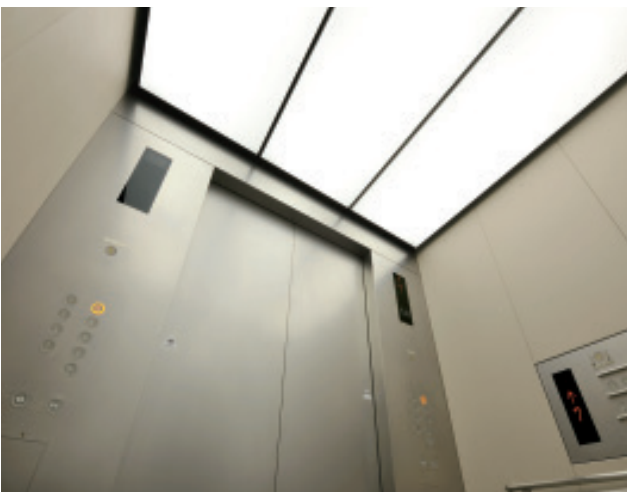
乗用24人乗りエレベーター・かご室天井