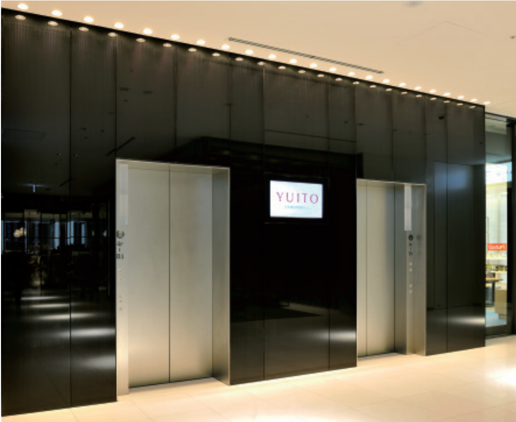
乗用20人乗りエレベーター・2階エレベーターホール