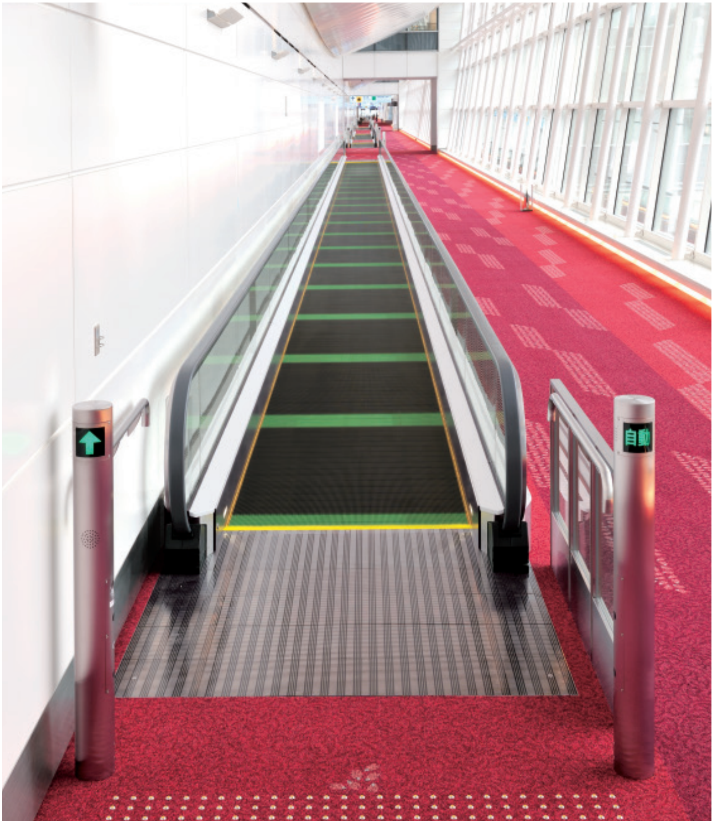
薄形動く歩道・到着コンコース(A・B工区)

2010年10月、羽田空港に新しい国際線ターミナルがオープンし、羽田と海外とのネットワークが大幅に拡大しました。「Made In Japan～羽田 Only One」をテーマに日本の文化を体感できるスペースや多彩な施設・店舗を備えた商業施設を展開するほか、出発・到着階は、多数の動く歩道が設置され、“移動のしやすさ”が徹底された機能的な構成となっています。