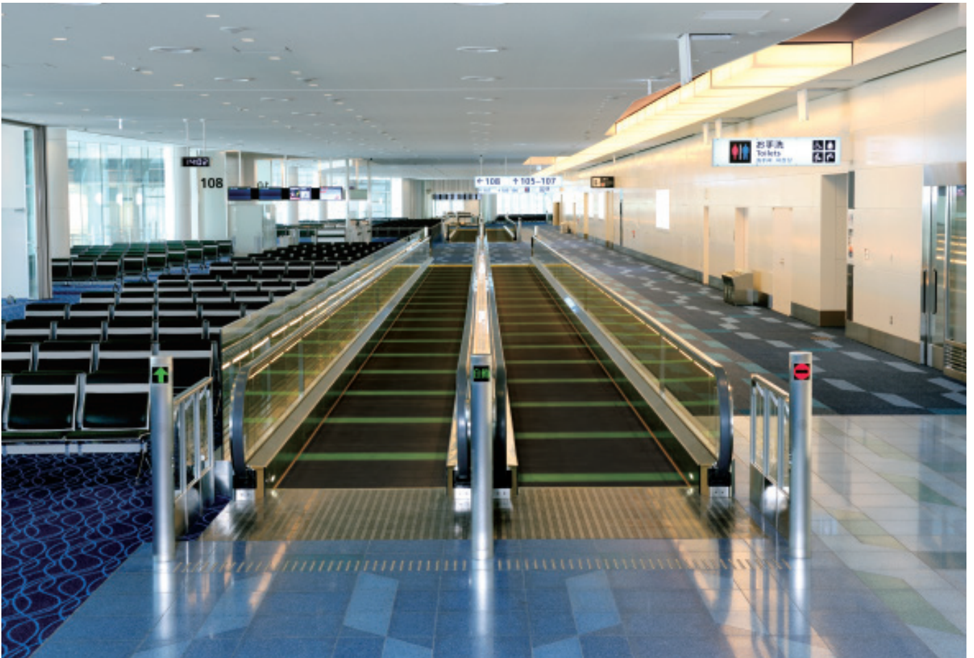
薄形動く歩道・出発コンコース(A・B工区)