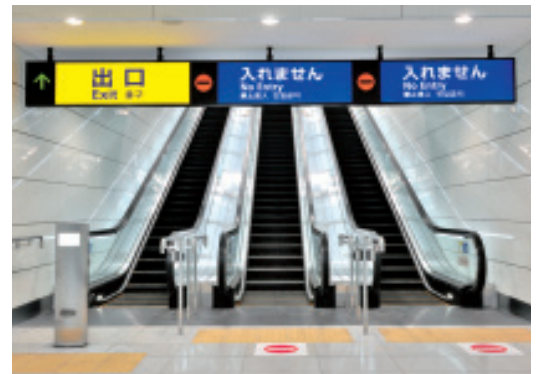
ホーム階・改札行エスカレーター