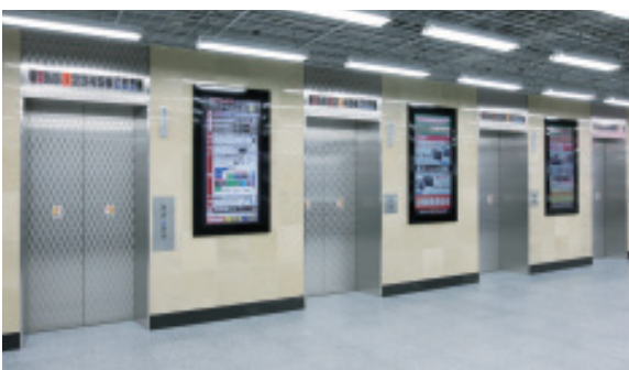
乗用24人乗りエレベーター・1階エレベーターホール