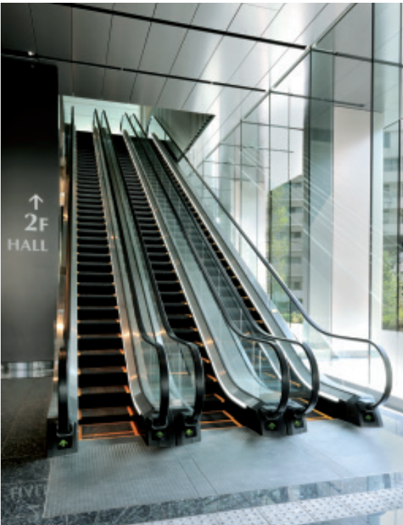
エスカレーター(ベルサール渋谷ファースト)