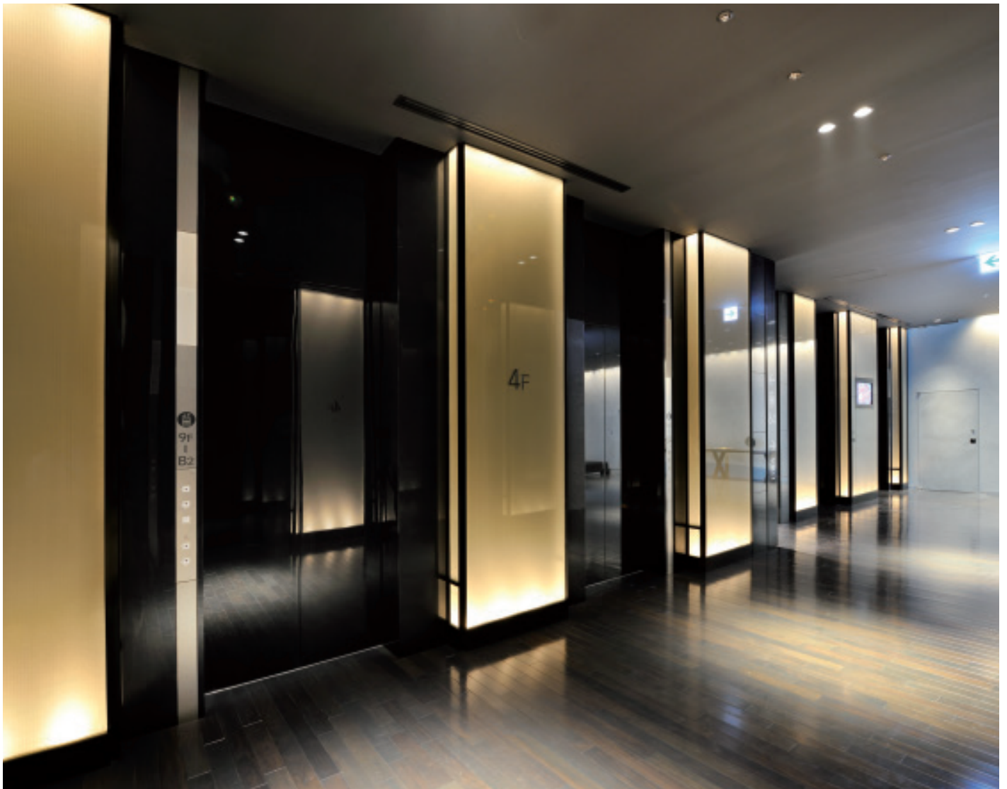
乗用24人乗りエレベーター・4階エレベーターホール

都市再生特区に指定された日本橋室町東地区、その先陣を切って完成した日本橋室町野村ビルは、地下5階・地上21階、商業施設YUITO(ユイト)とオフィスの複合ビルです。中央通りに面した部分は31メートルの高さで他のビルと連続したラインを構成するデザインになっており、プロジェクト完了時には地区全体に歴史を感じさせる景観が生み出されます。