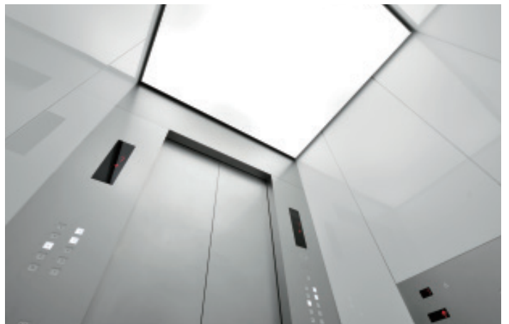
乗用24人乗りエレベーター・かご室天井