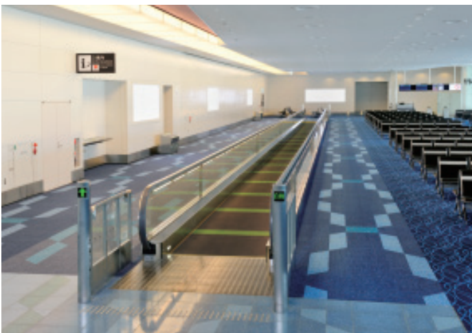
薄形動く歩道・出発コンコース(C工区)