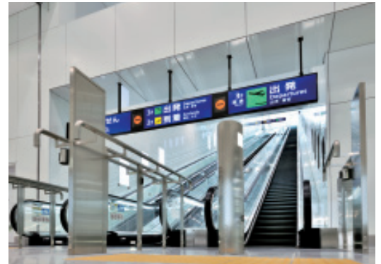
出発・到着ロビー行エスカレーター