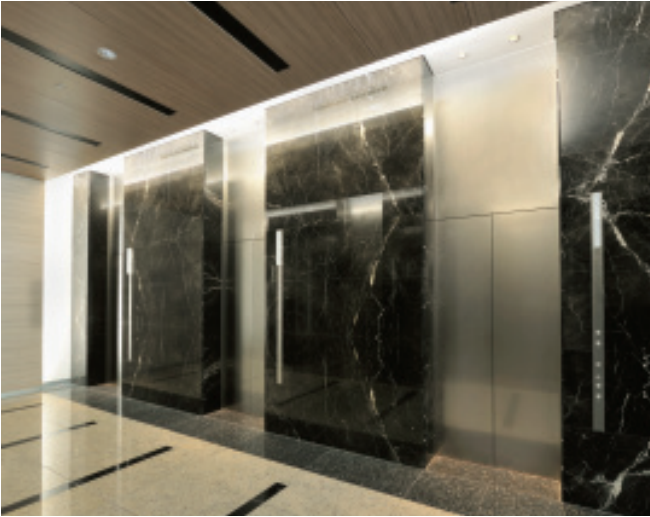
乗用24人乗りエレベーター・1階エレベーターホール(渋谷ファーストタワー)