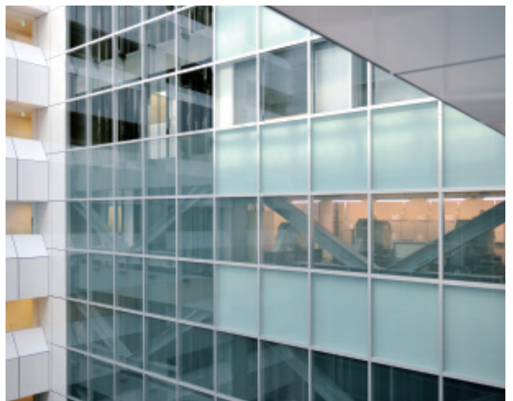
展望用エレベーターと巻上機