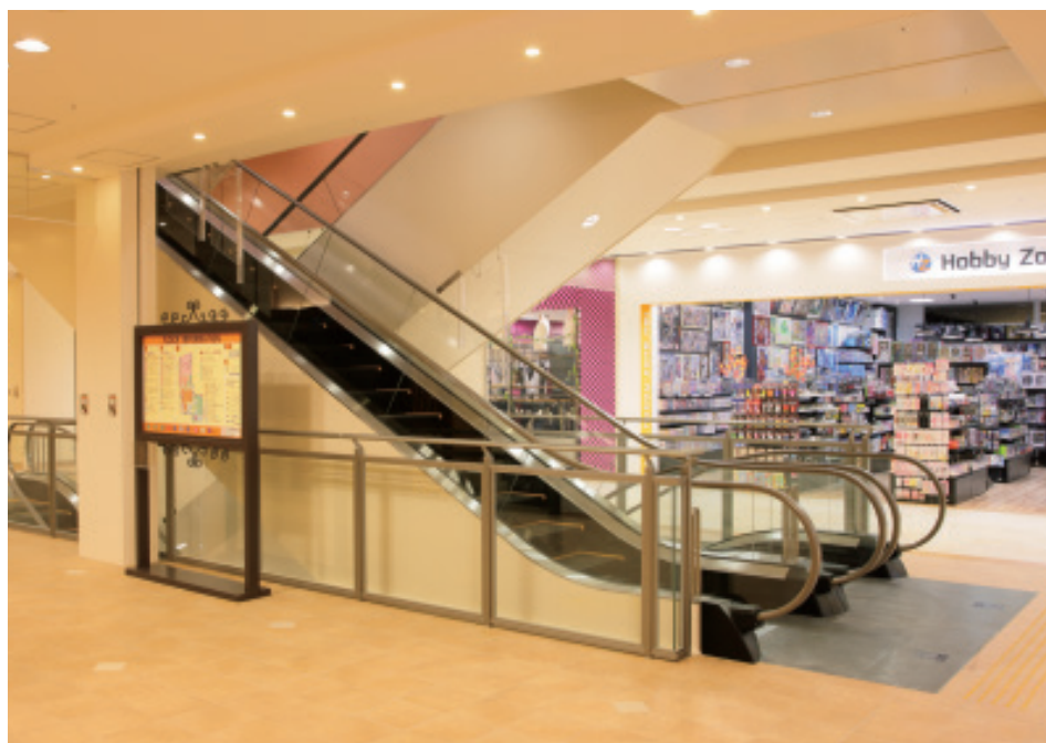
エスカレーター・3階(オペラパーク専門店)

大阪市の隣、大東市の中心に位置する複合商業施設、ポップタウン住道 すみのどう では、1970年代の開業以来、時代の変化に応じてさまざまな刷新計画が実施されてきました。このほど完成したオペラパークは、京阪百貨店を核テナントに100を超える専門店が入居し、既存の大型スーパーや文化教室などと合わせて、地域の“ライフスタイル型ショッピングセンター”を構成しています。