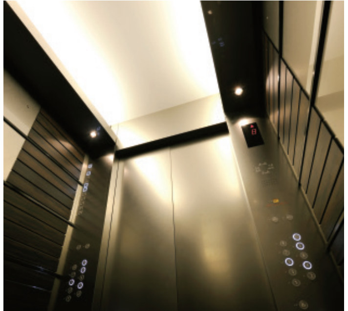
乗用24人乗りエレベーター・かご室天井(渋谷ファーストタワー)