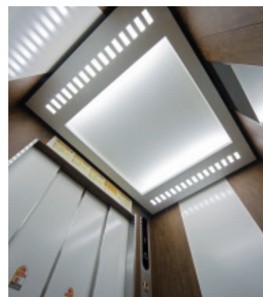
乗用24人乗りエレベーター・かご室天井