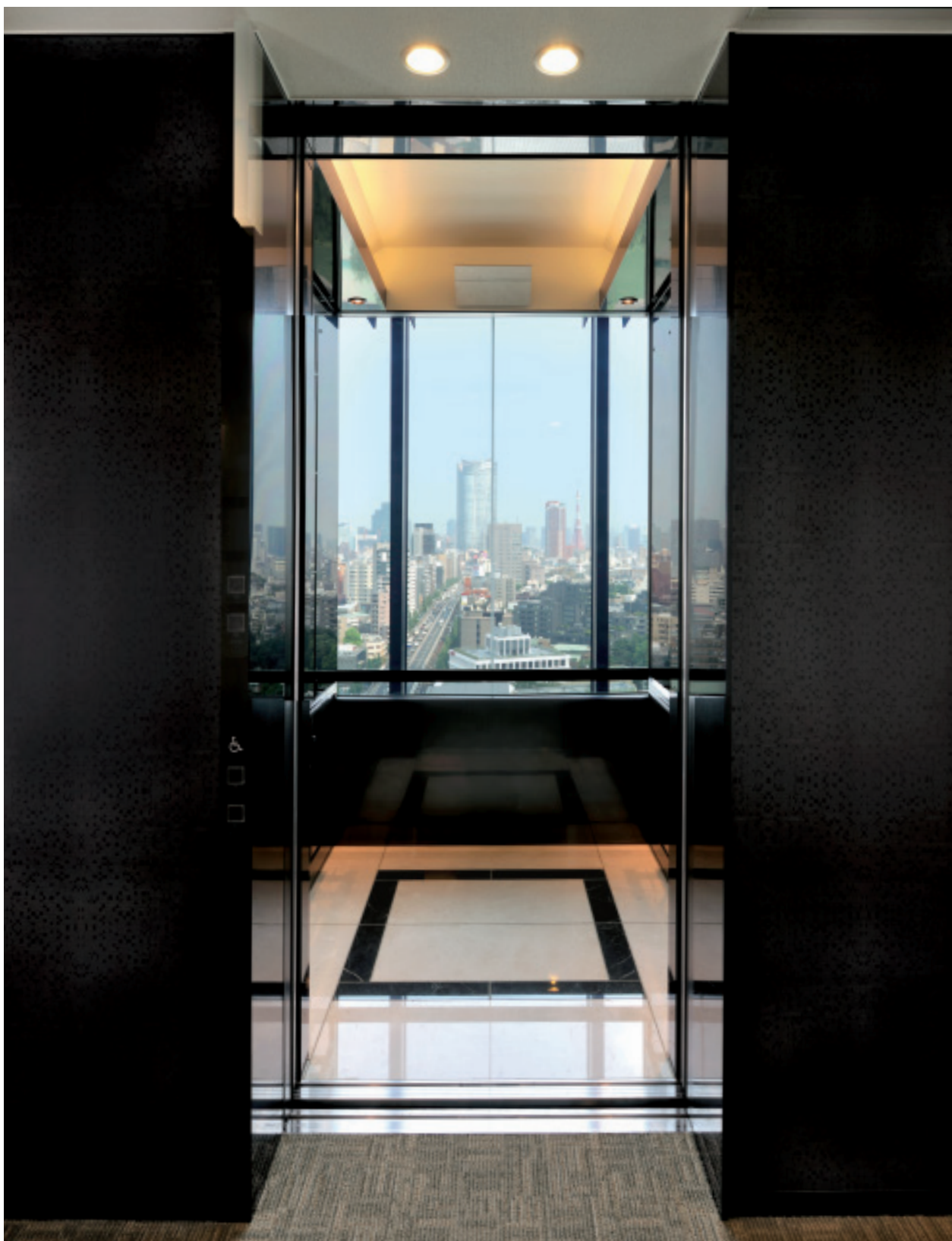
展望用15人乗りエレベーター・かご室(ラ・トゥール渋谷)

渋谷駅から徒歩8分、六本木通りに面した渋谷ビジネスエリアに、先進オフィスと集合住宅、大型イベントホールを一体化させた住友不動産ファーストタワー・シリーズの新しいビルが誕生しました。青山・広尾・麻布といった東京の文化・ファッションの先端を行くエリアに隣接し、高層階からは東京が一望できるという屈指のロケーションを誇ります。