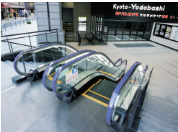
エスカレーター・エントランス