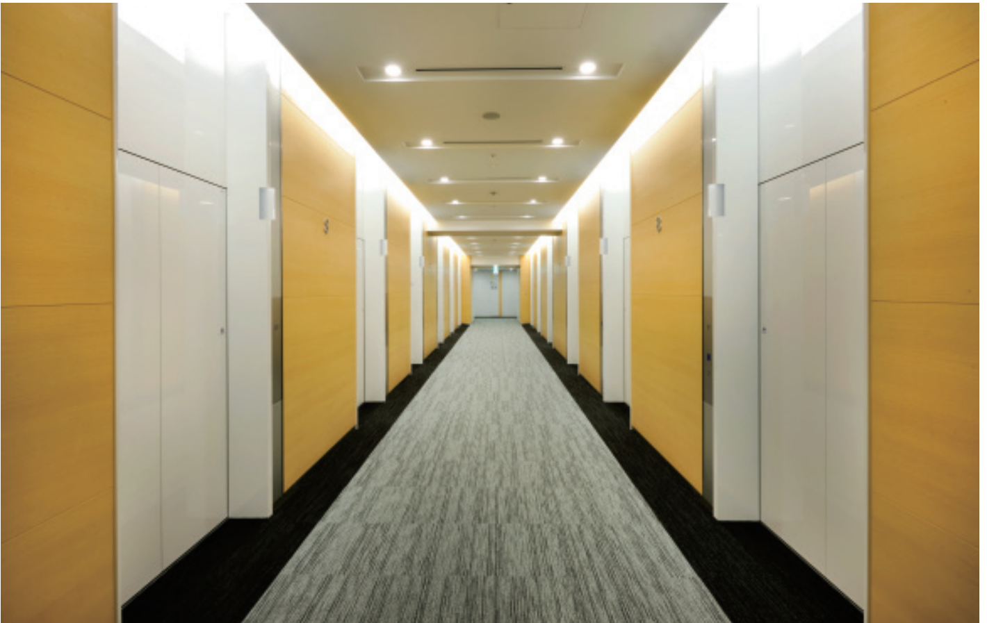
乗用24人乗りエレベーター・8階エレベーターホール