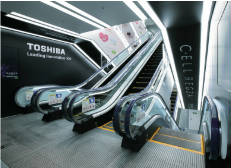
エスカレーター・3階のりば

京都ヨドバシビルは、地下1階から3階までの家電スペースのほか、レストランやカフェ、ファッション、雑貨、書店、旅行会社など、さまざまな専門店が入居している複合商業施設型の建物です。建物全体でLED照明を装備したエスカレーターが、50台を超えて設置され、広大なフロアを快適に移動しながらショッピングを楽しむことができます。