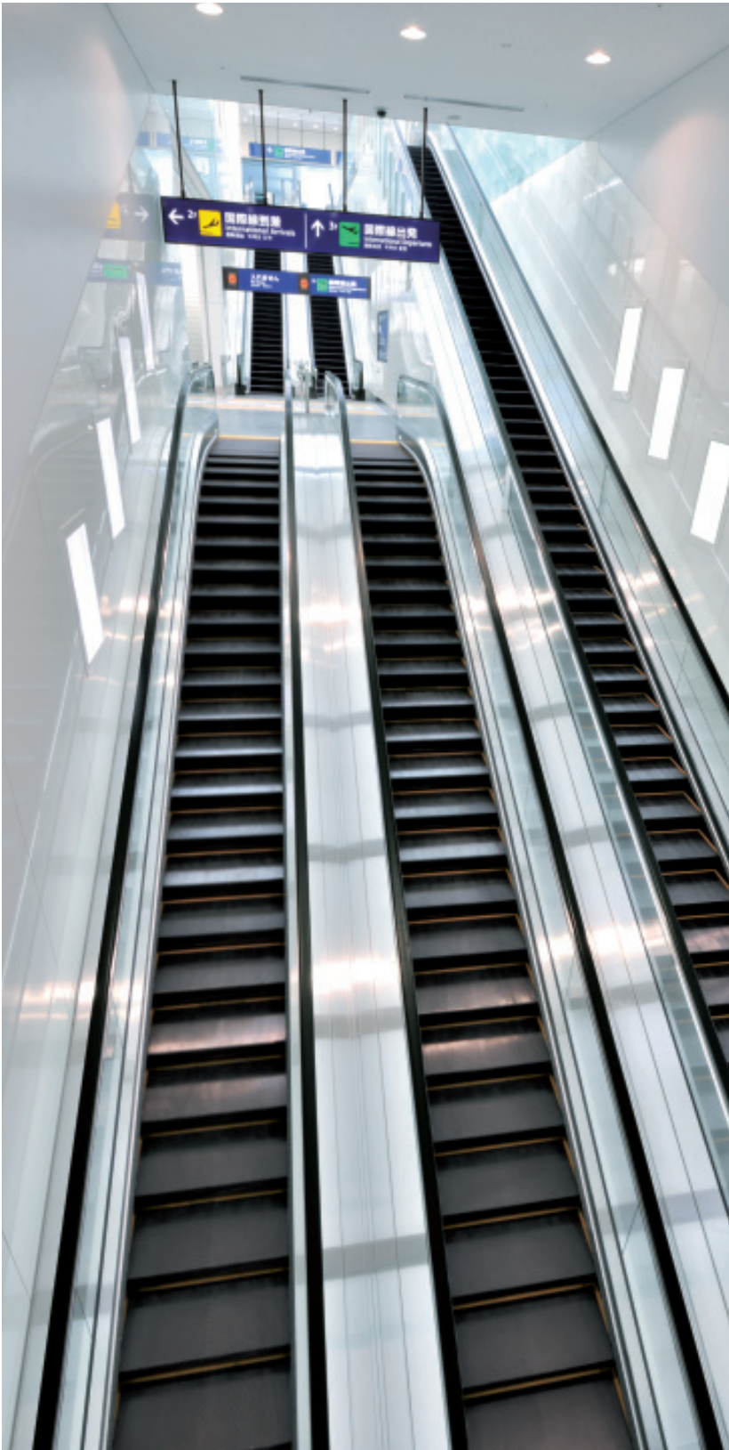
出発・到着ロビー行エスカレーター

京浜急行空港線に、羽田空港国際線の新ターミナルに直結する新駅が開設されました。成田空港・横浜方面から直通電車が運行されており、品川から最速で13分。ホームから出発・到着ロビーまでダイレクトに結ばれ、到着階には4カ国語(日・英・中・韓)対応の案内カウンターを設置するなど、国際空港の駅にふさわしいサービスが提供されています。