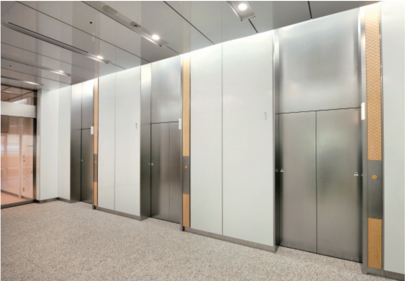
乗用24人乗りエレベーター・1階エレベーターホール

豊洲フロントは、1フロア1500坪強という国内最大級の有効面積を持つ、地上15階・地下2階・塔屋2階の大型オフィスビルです。東京メトロ有楽町線豊洲駅から徒歩2分というアクセスの良さに加え、1階には郵便局や保育園を含めて14の店舗・レストランが入居、オフィスで働く人だけでなく、地域に住む人たちにも有用な店舗構成となっています。