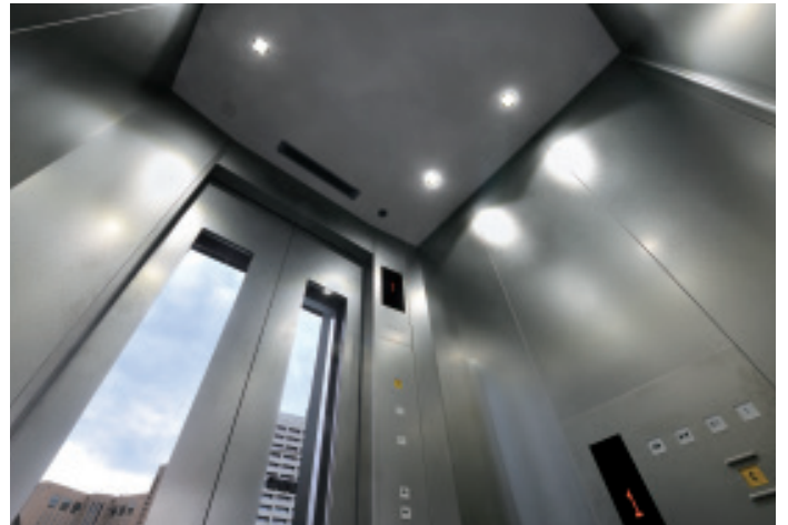
乗用11人乗りエレベーター(地下歩道連絡用)・かご室天井