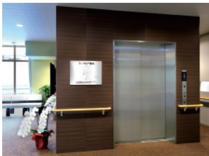
寝台用15人乗り(積載1000kg)エレベーター・1階ホール