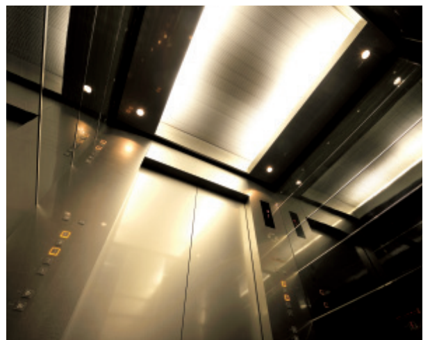
乗用24人乗りエレベーター・かご室天井（飯田橋ファーストタワー）