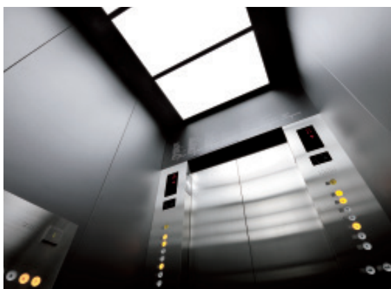
乗用17人乗りエレベーター・かご室