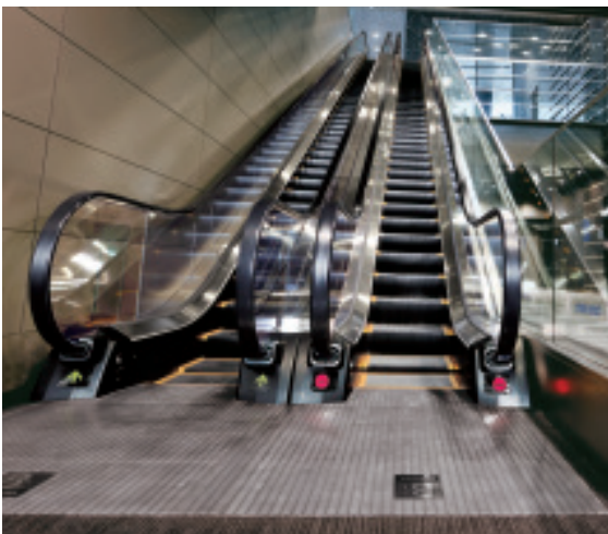
エスカレーター(ベルサール飯田橋ファースト)