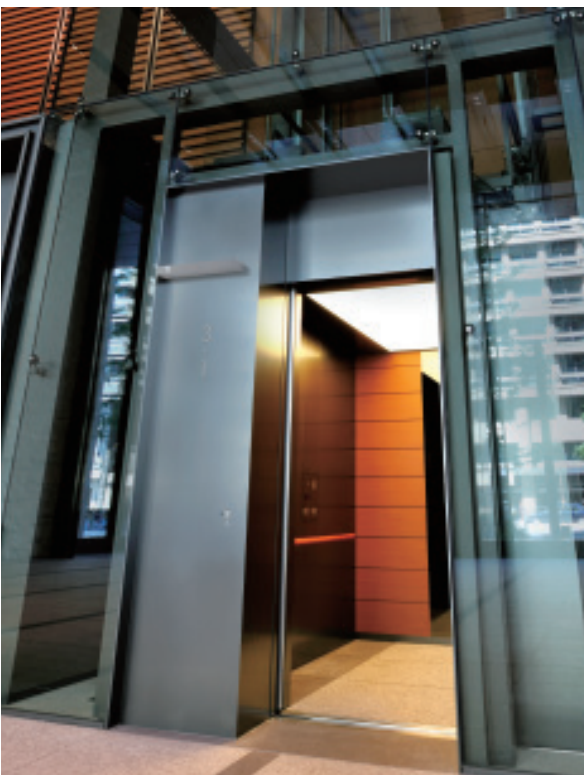
乗用30人乗りエレベーター・かご室