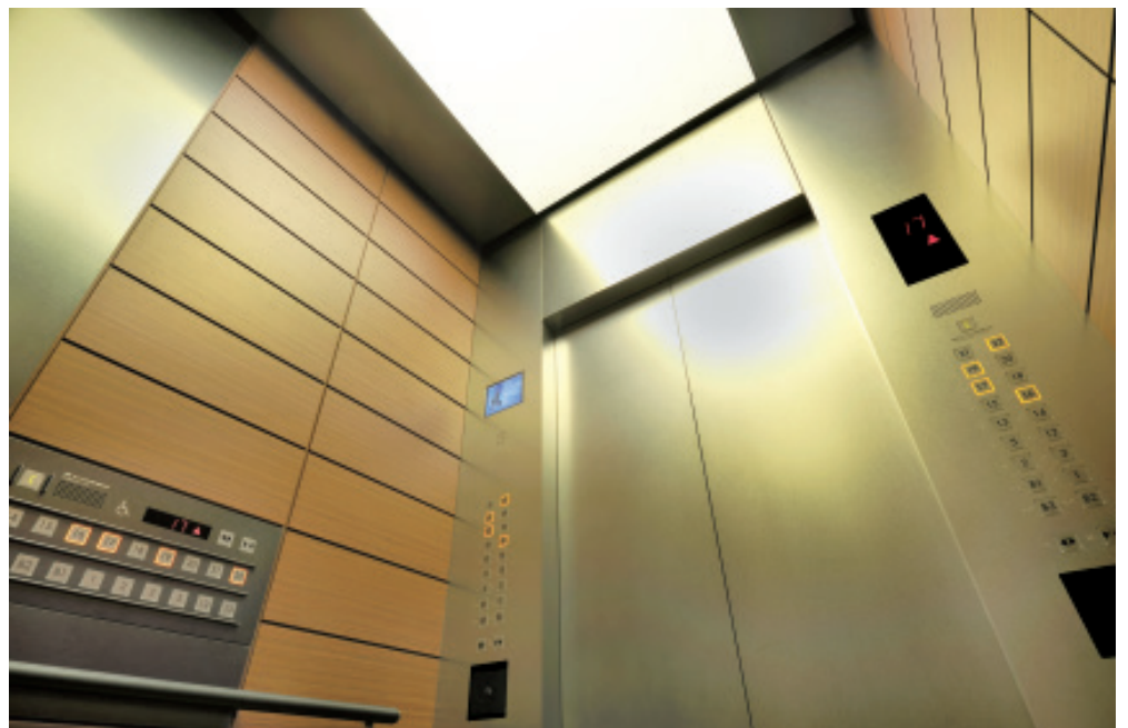
乗用27人乗りエレベーター・かご室天井