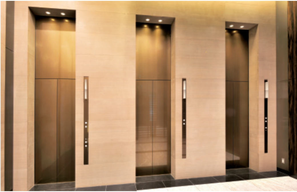
乗用13人乗りエレベーター・1階ホール(ラ・トゥール飯田橋)