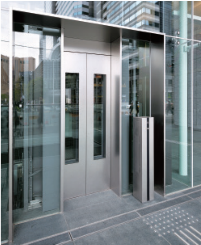
乗用11人乗りエレベーター(地下歩道連絡用)・1階ピロティ

野村不動産西新宿ビルは、東京都庁や新宿超高層ビル群に隣接するエリアに新設された先進のオフィスビルです。青梅街道に面し、東京メトロ丸ノ内線の西新宿駅に直結、JR新宿駅からも徒歩圏内という、ビジネスに必須の機動性が確保され、万全なセキュリティシステムのもとで、快適な仕事環境が実現されています。