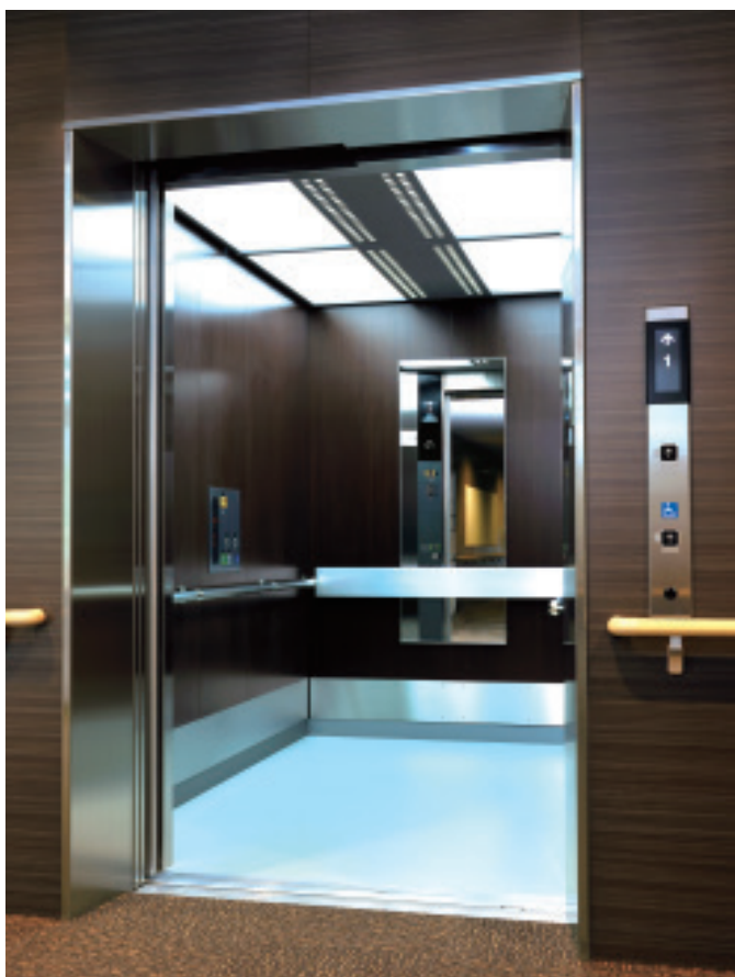
寝台用15人乗り(積載1000kg)エレベーター・かご室

さいたまほのかクリニックでは、高品質の人工透析はもちろん、地域の基幹病院と連携した腎臓専門治療、早期発見を主眼に置き徹底した合併症対策、車いす対応の無料送迎バスなど、総合的な透析医療サービスを提供しています。寝台用エレベーターには、抗菌ボタン ※1 を採用したカラーユニバーサルデザイン認定 ※2 の「ニュー・スペースEX」が導入されています。