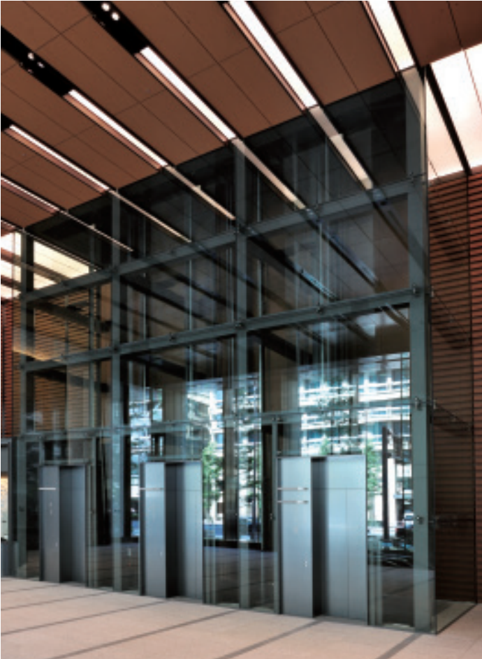
乗用30人乗りエレベーター・1階ホール