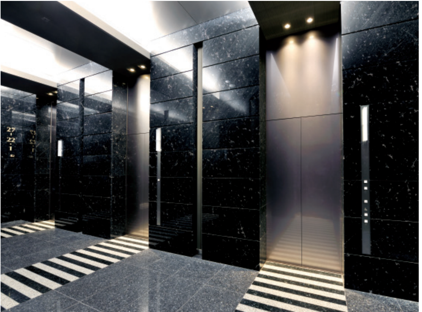
乗用24人乗りエレベーター・1階ホール（飯田橋ファーストタワー）

JR飯田橋駅から徒歩5分という好立地に地上34階・地下3階の飯田橋ファーストタワーが誕生しました。2～5階および22～34階がオフィス、7～21階が集合住宅（ラ・トゥール飯田橋）、地下1階には展示会やセミナー向けのイベントホール（ベルサール飯田橋ファースト）があり、新時代の都市型複合施設の名にふさわしい構成となっています。