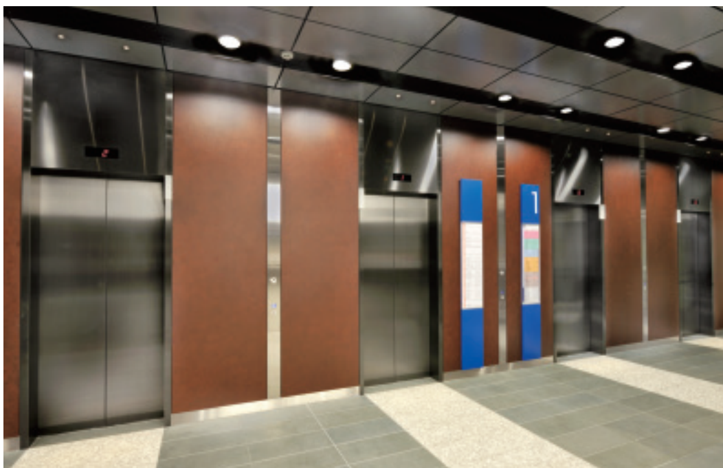
乗用エレベーター・1階ホール

100年の歴史と伝統を持つ三井記念病院では、時代のニーズに合致した高度の医療と快適な療養環境の提供を目指して、2006年から全面建て替え計画が進められてきました。2009年の新入院棟オープンに続いて、2010年9月に診療の中心となる地上7階・地下1階の外来棟が完成。病院機能が移転し、新しい環境での診療活動がスタートしました。