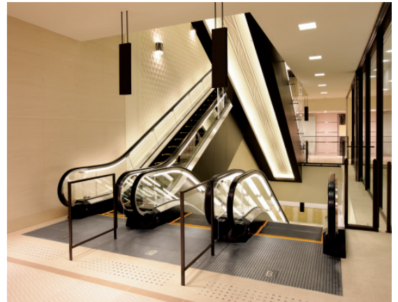
エスカレーター・地下1階