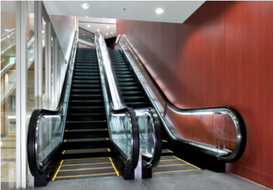
エスカレーター・2階（葛飾区立中央図書館）