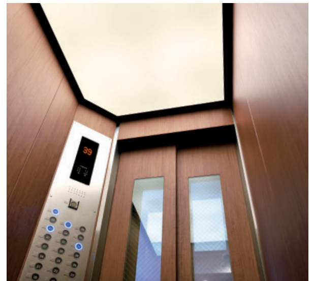
乗用11人乗りエレベーター・かご室（タワーレジデンス）