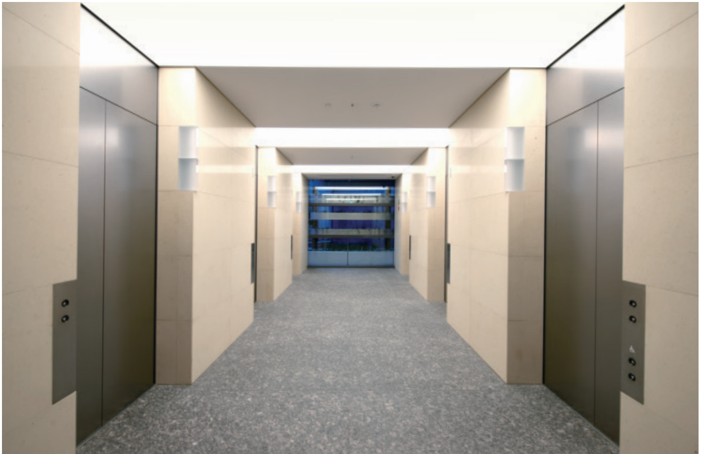
乗用 23 人乗りエレベーター・1 階ホール

「日本興亜日本橋ビル」は、地下鉄コンコースと直結する通路とエレベーターを設置、地域への貢献を意識した新生オフィスビルとして、2009年8月に建て替えが完了しました。ユニバーサルデザインや最新のインテリジェント機能・安全性に加え、屋上緑化や高効率器具・エコマテリアルの採用など、環境にも十分な配慮がなされています。