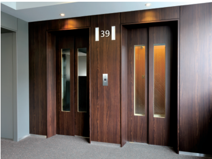
乗用11人乗りエレベーター・39階ホール（タワーレジデンス）