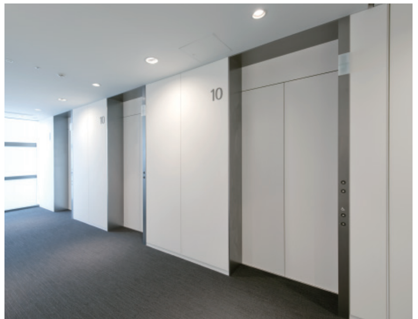
乗用 23 人乗りエレベーター・10 階ホール