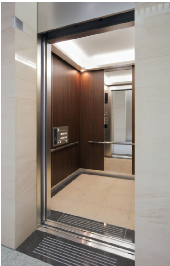
乗用 20 人乗りエレベーター・かご室