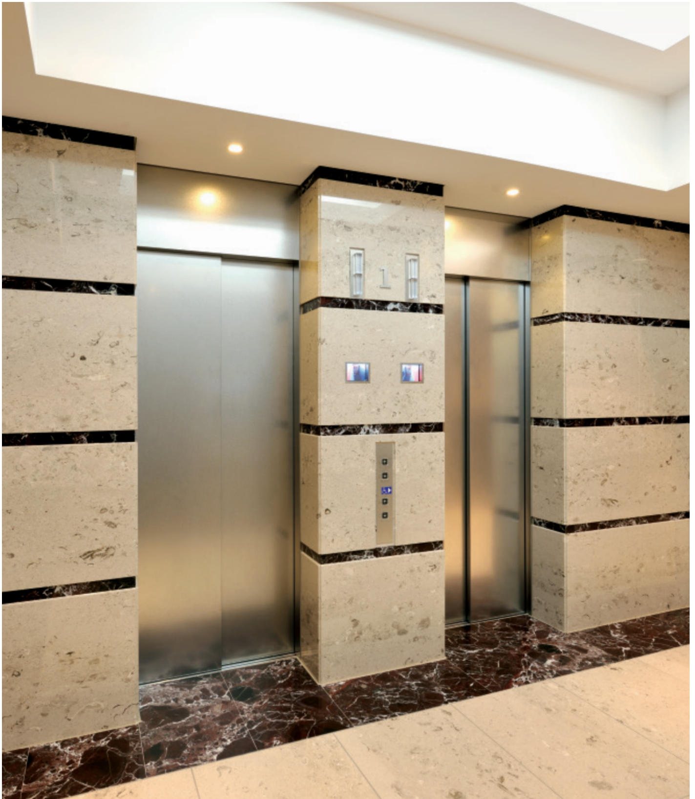
乗用 11人乗りエレベーター・1階ホール（タワーレジデンス）

「ヴィナシス金町」は、地上41階・塔屋1階・地下2階建ての住宅・店舗・医療モール・駐車場・葛飾区立中央図書館を備えた一大複合ビルです。交通の要衝である金町の総合環境整備事業の一環として建設されました。周辺には地域との交流拠点となるオープンスペースを確保し、水と緑の街に新しい都市文化・生活空間が創出されています。