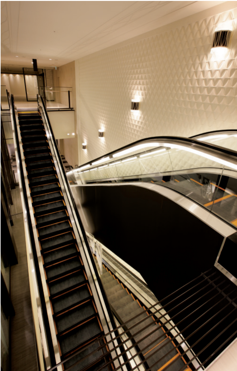
エスカレーター・12階

「阪急うめだ本店」は、2012年春の全館グランドオープンをめざして、2009年9月に一期棟がオープンしました。ソフト面では、日本初の最新ファッションや人気のパティシエのスイーツなど女性のさまざまなニーズに応える多彩なブランドが一堂に会しています。ハード面でも、JR大阪駅や阪神梅田本店とのアクセスの改善やユニバーサルデザインの採用など、利便性の向上が図られています。