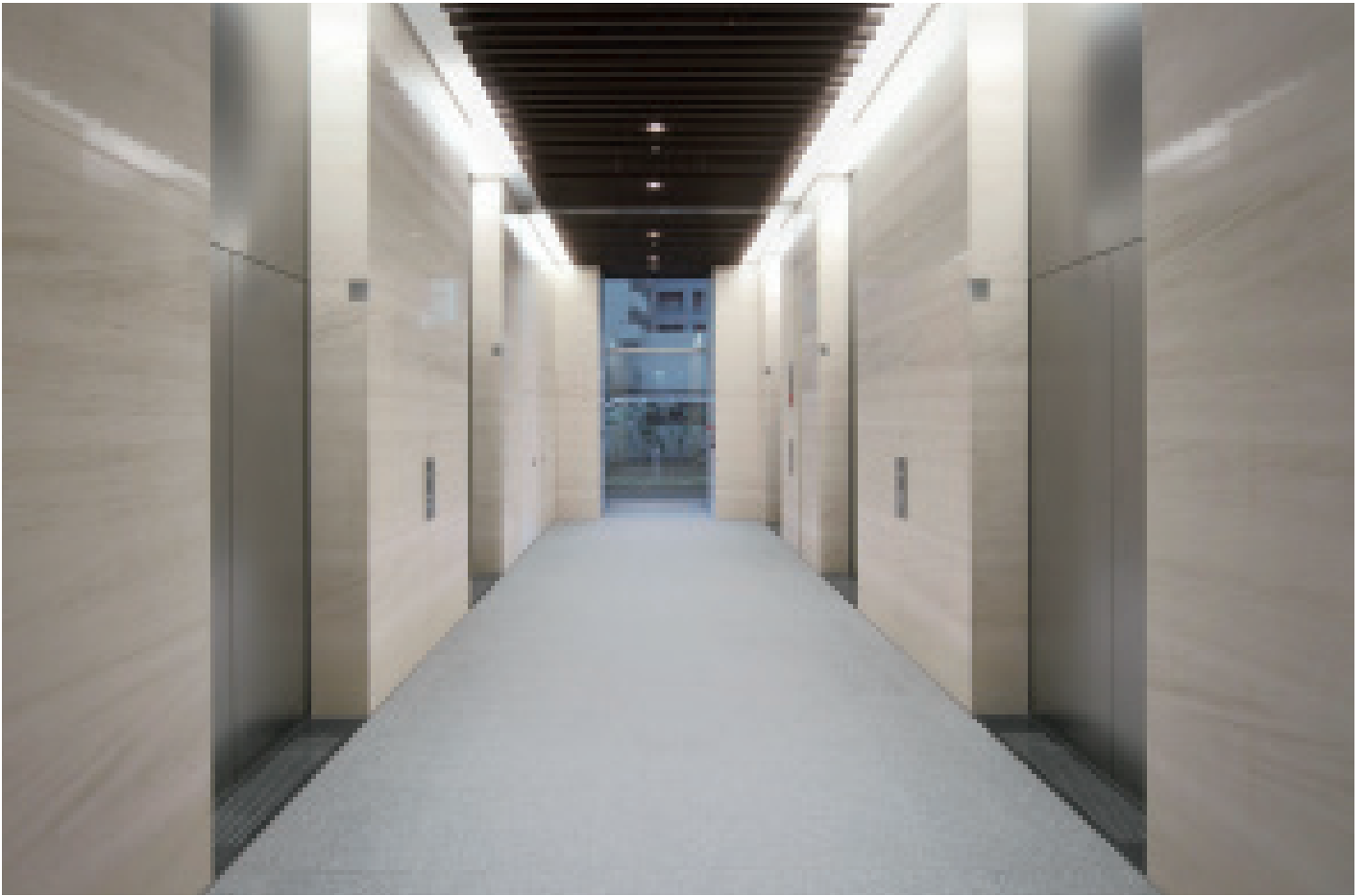
乗用 20 人乗りエレベーター・1 階ホール