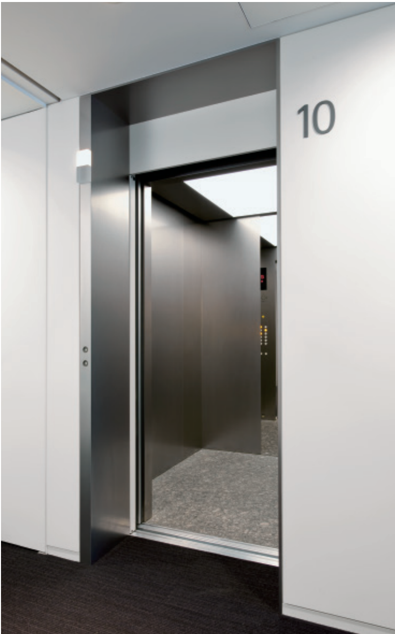
乗用 23 人乗りエレベーター・かご室