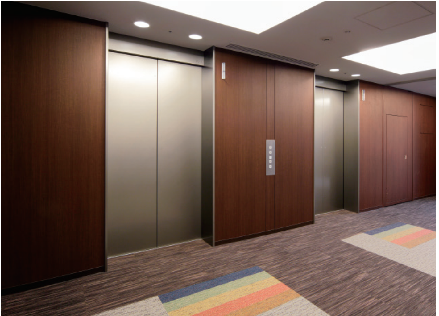
乗用 20 人乗りエレベーター・9 階ホール

「博多祇園 M-SQUARE」は、地下鉄祇園駅から2分、福岡空港・天神地区へのアクセスもよく、ビジネス拠点として絶好のオフィスビルです。7～10階は、九州最大級である524坪のフロア面積を誇り、最新設備とともに多様なオフィスニーズに対応。Low-Eガラスや非接触型カードによるセキュリティシステムなど、環境・安全面でも様々な配慮がなされています。