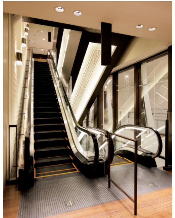
エスカレーター・4階