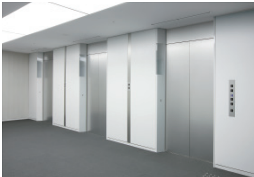
乗用24人乗りエレベーター・3階ホール