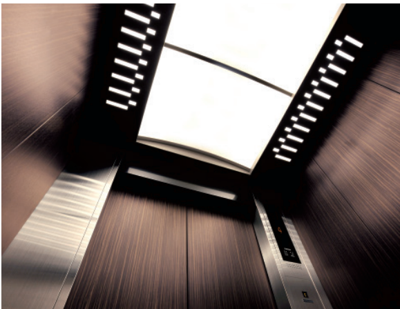
エレベーター・かご室天井