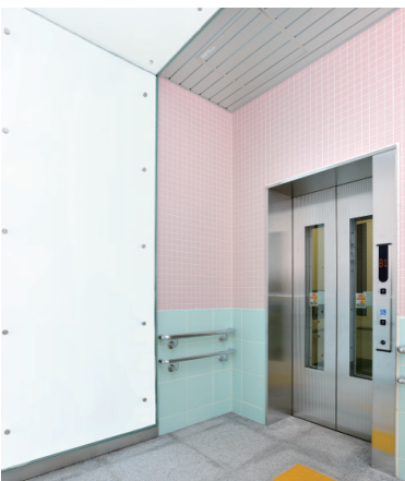
乗用11人乗りエレベーター（上野中央通り地下歩道）