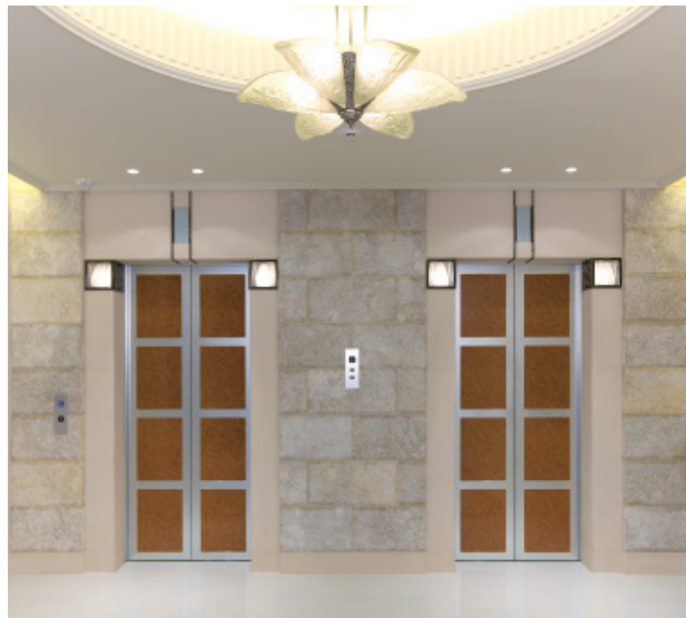
乗用15人乗りエレベーター・2階ホール