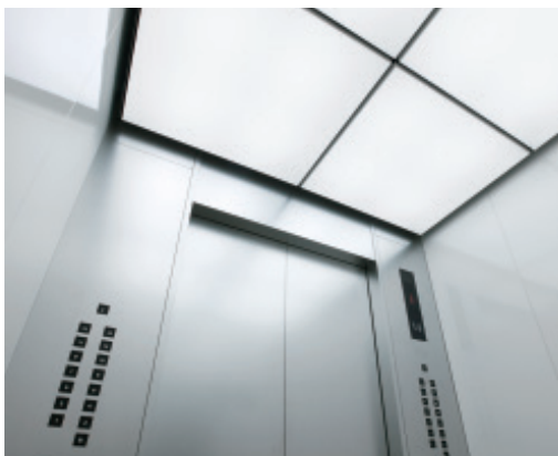
乗用24人乗りエレベーター・かご室天井