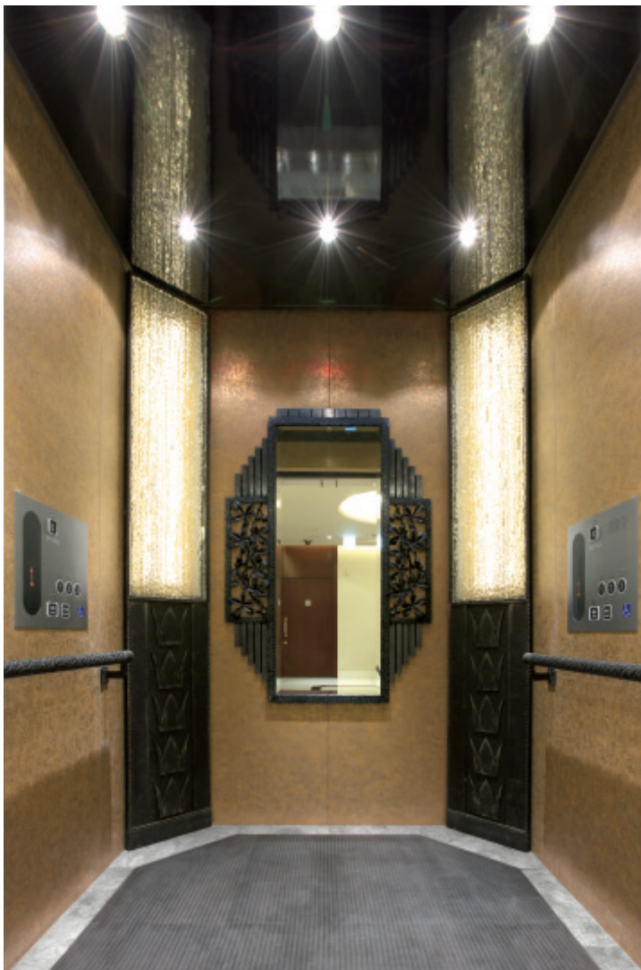
乗用15人乗りエレベーター・かご室

「覚王山ル・アンジェ教会」は2009年3月にオープンしたウエディング施設です。イタリアの丘の上に広がる街並みをイメージした建物は、本物にこだわったインテリアや調度品が新しい家族の誕生を見守ります。また、宝石箱のようにきらめく礼拝堂や上品な雰囲気統一されたレストラン、パーティールームなど、全館がバリアフリー構造となっています。