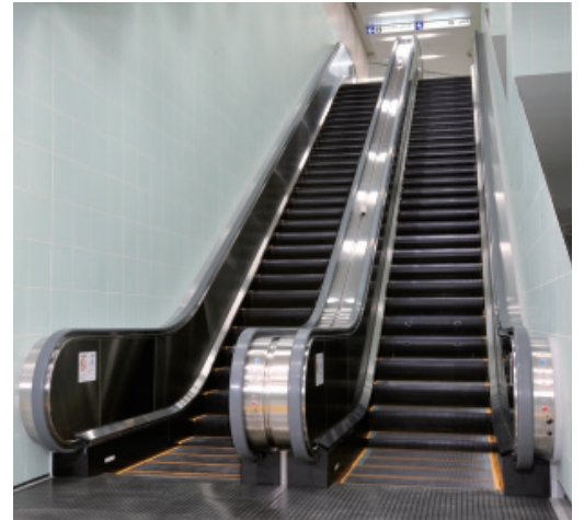
車いす用水平ステップ付きエスカレーター（上野中央通り地下歩道）