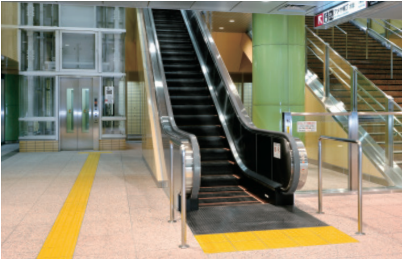
エスカレーター（上野中央通り地下駐車場）と乗用11人乗りエレベーター（上野中央通り地下歩道）

「上野中央通り地下歩道」は、2009年3月に完成した約320mにわたる地下歩道です。京成上野駅と都営大江戸線上野御徒町駅を繋ぐこの歩道により、JR・東京メトロ上野駅、京成上野駅、上野御徒町駅、上野広小路駅、御徒町駅、仲御徒町駅が地下道で繋がりました。また地下歩道から連絡する「上野中央通り地下駐車場」もあわせて建設されています。