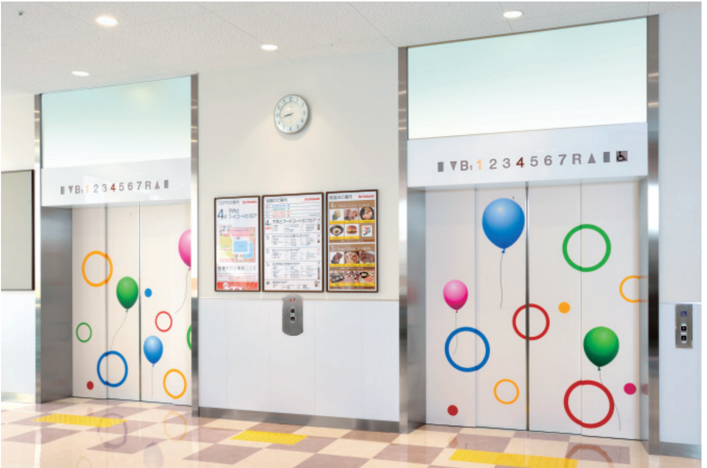
乗用46人乗りエレベーター・4階ホール