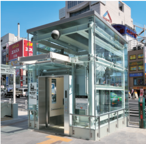
乗用20人乗りエレベーター（上野中央通り地下駐車場）