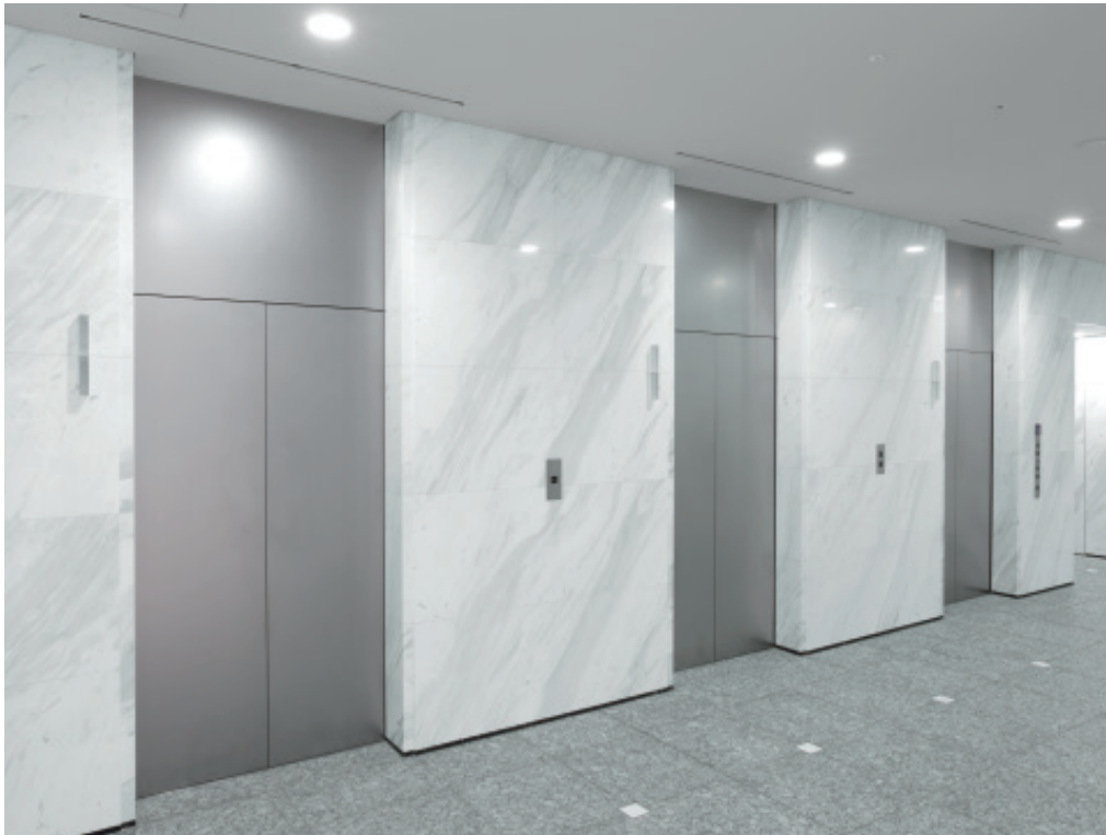
乗用24人乗りエレベーター・1階ホール

「御堂筋野村ビル」は、御堂筋に面する延床面積約21,000m 2 、地下2階地上14階の免震構造を採用したオフィスビルです。建物は、積極的な屋上緑化や1階ピロティ部分へのビルトインのドライミスト装置の設置など、温暖化防止対策にも配慮し、建築物環境性能評価である「CASBEE 大阪」のAランクを取得しました。