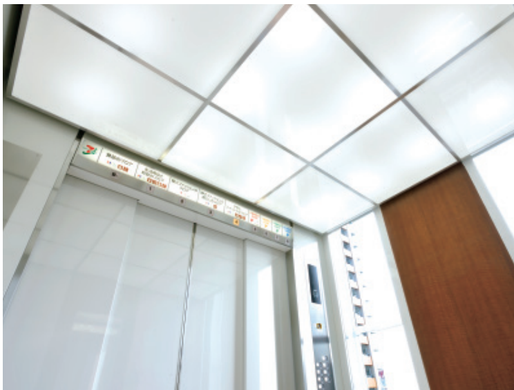
乗用46人乗り(展望窓付き)エレベーター・かご室