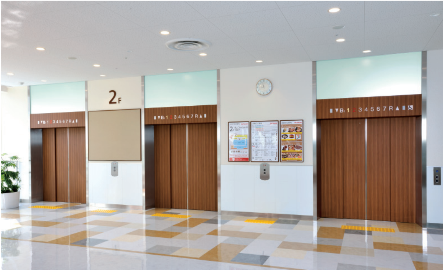
乗用46人乗りエレベーター・2階ホール

「イトーヨーカドー武蔵小金井店」は、再開発が進むJR武蔵小金井駅南口にオープンした商業施設です。通常速度の約2/3の分速20mの低速運転で乗降時の安全に配慮したエスカレーターのほか、店舗へのLED照明の採用や氷蓄熱システム、太陽光発電システムなど、ユニバーサルデザインと環境負荷の低減に積極的に取り組んでいます。