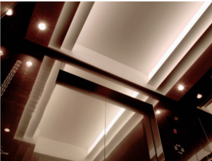
エレベーター・かご室天井