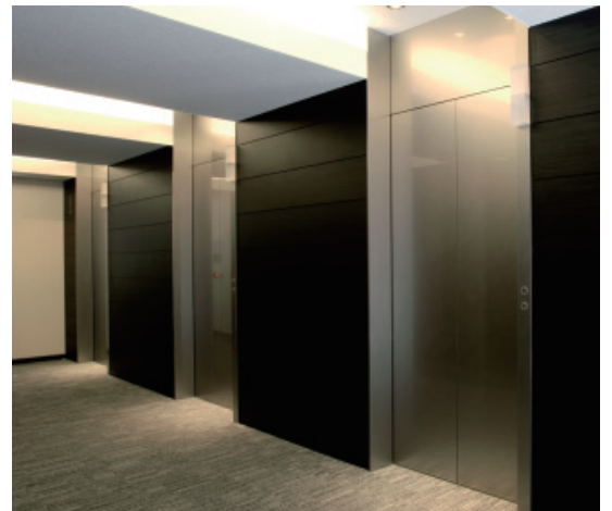
エレベーター・10階のりば