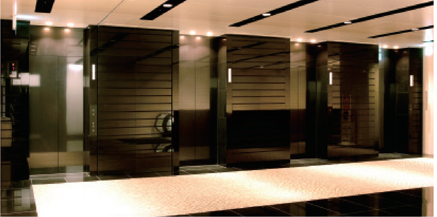
エレベーター・2階のりば