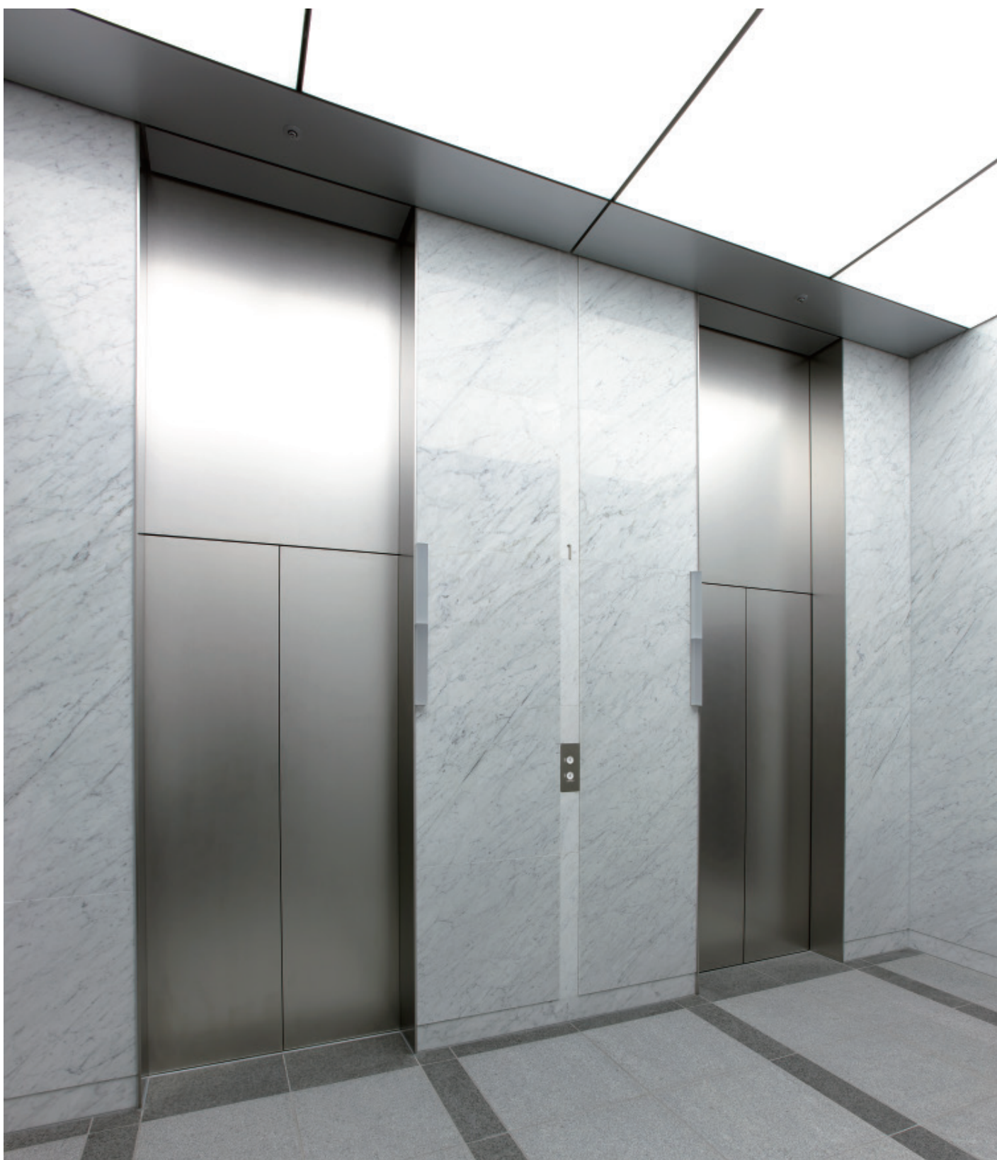
エレベーター・1階のりば

GLASS CITY SAKAEは、2008年9月に完成した地上14階地下1階建てのオフィスビルです。エアフローウィンドウシステムおよび電動制御内部ブラインドを内蔵した二重ガラスにより省エネルギー性と快適性を向上させたほか、各階のリフレッシュコーナーや自動調光機能など、快適なオフィス空間を提供しています。