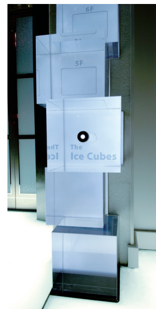
エレベーター・1階正面入り口 呼び登録ボタン