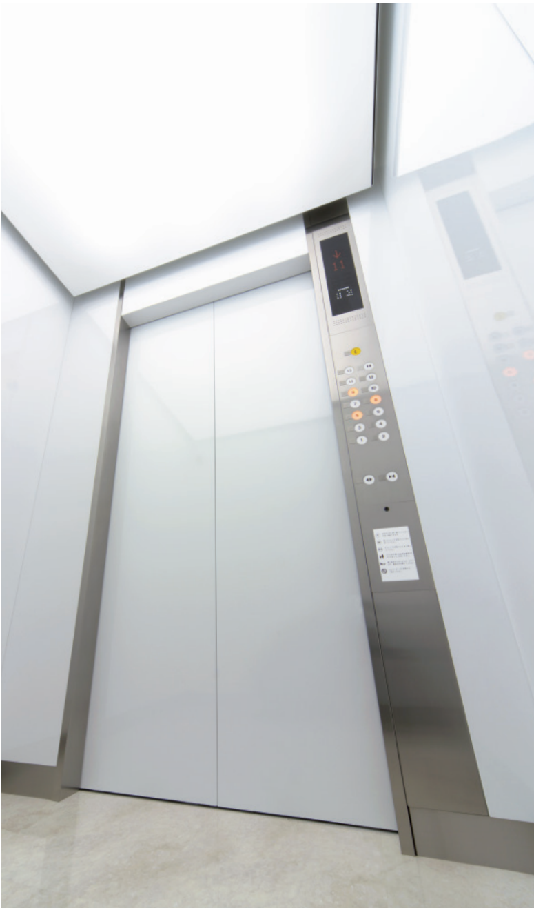
エレベーター・かご室