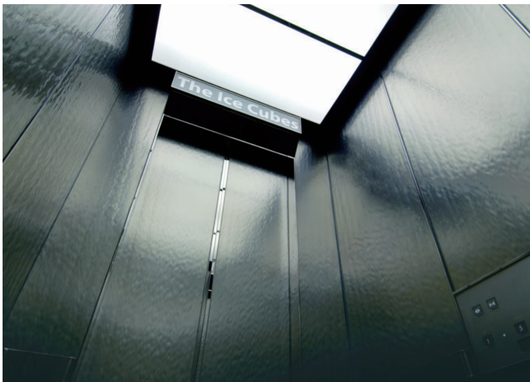
エレベーター・かご室

The Ice Cubesは地上9階地下2階建てのビルです。JR原宿駅から徒歩5分、明治通り沿いに白くそびえるタワーが目目を引く建物には、地下1階から地上3階までH&M原宿店が入店しています。H&Mはファッション性の高いアイテムが話題のブランドで、世界的に人気を集めています。