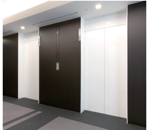
エレベーター・8階のりば