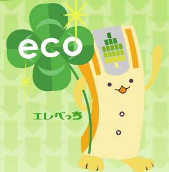
電気代削減イメージ

モーター容量5.5kWのロープ式エレベーター1台所有・8階建て・56世帯のマンションオーナーAさんの場合