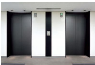
乗用24人乗りエレベーター・7階ホール