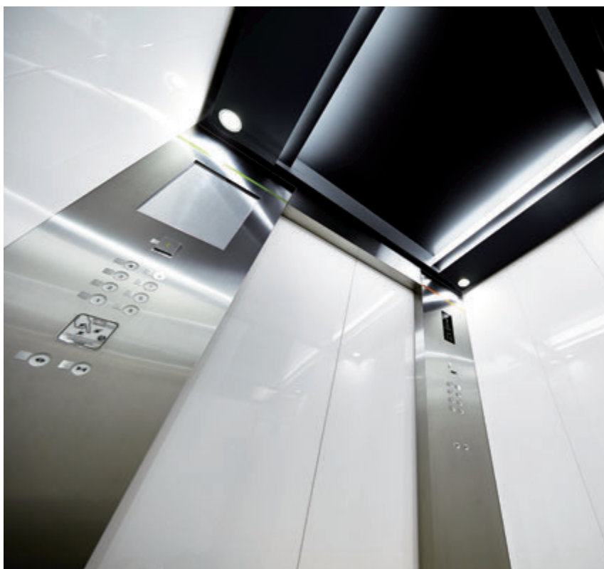
乗用24人乗りエレベーター・かご室天井(リニューアル後)

かつては流行発信地として多くの若者で賑わい、現在は、品川・田町間にある旧田町車両センターに新駅と再開発が計画され、再び注目が集まるエリア・芝浦。1987年竣工のオフィスビル・芝浦清水ビルのエレベーターを、意匠も現代的にリニューアルしました。かご操作盤上部に左右異なる色のディレクションラインを設置して、降りる際に行きたい方向を間違わないよう配慮しています。