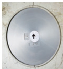
のりばボタン (リニューアル後)