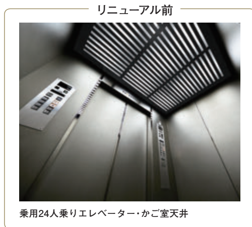
リニューアル前 乗用24人乗りエレベーター・かご室天井