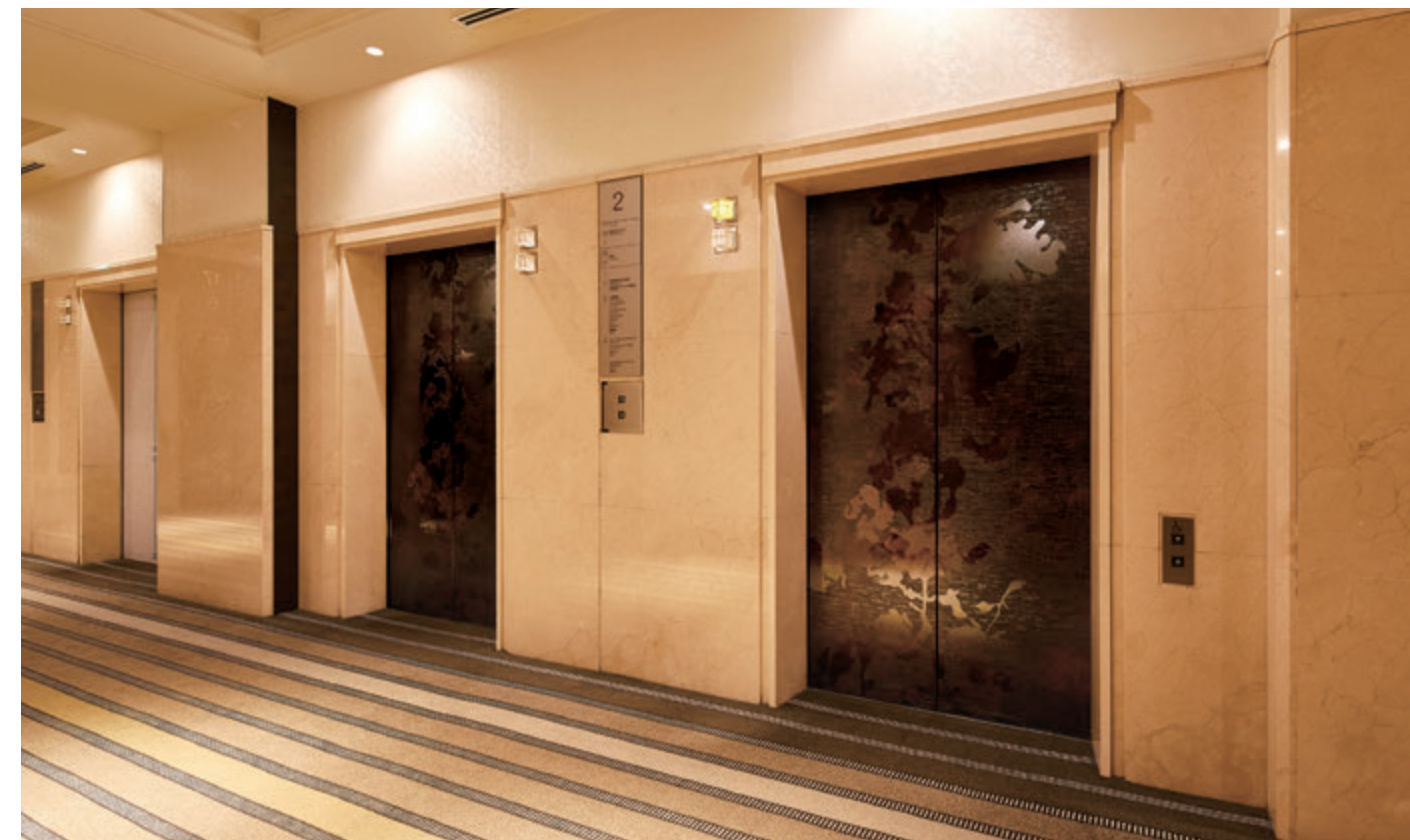
乗用20人乗りエレベーター・2階エレベーターホール