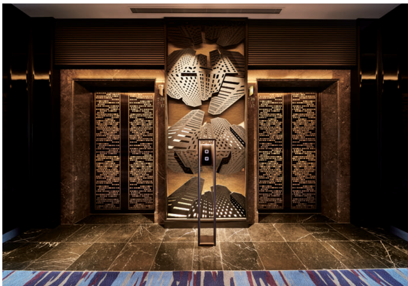
乗用20人乗りエレベーター・39階エレベーターホール

JR品川駅前にある品川プリンスホテルは、日本最大級の客室数を誇る大規模ホテルです。4棟の宿泊棟のほか、水族館や映画館などを備え、ホテルの枠を超えた“エンターテインメントタウン”をめざして、各所でリニューアルが進んでいます。メインタワーの39階には、9つのダイニングとバーが融合したレストランが誕生し、エレベーターがリニューアルされました。