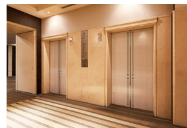
乗用20人乗りエレベーター・2階エレベーターホール