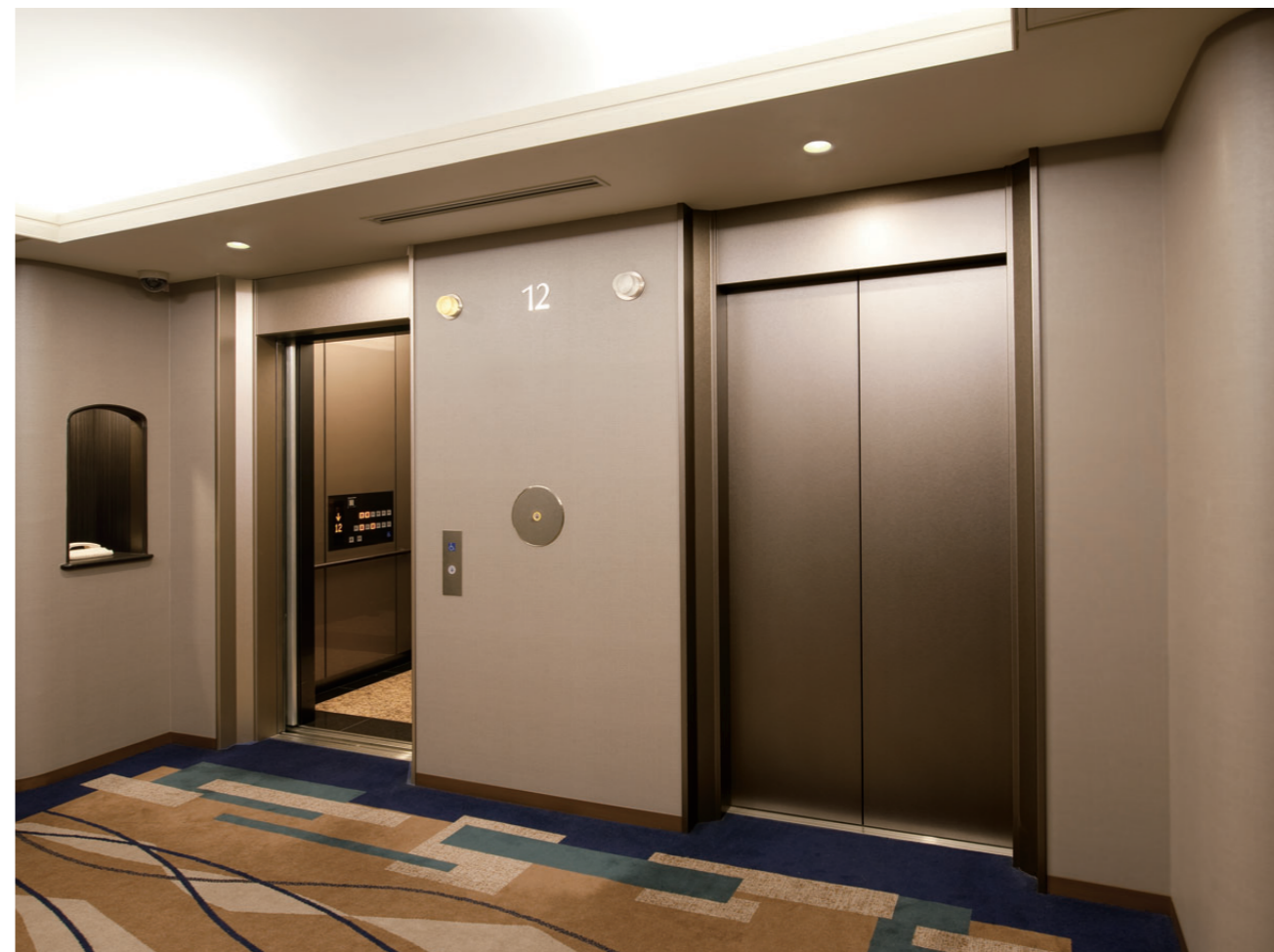
乗用17人乗りエレベーター・12階ホール(リニューアル後)