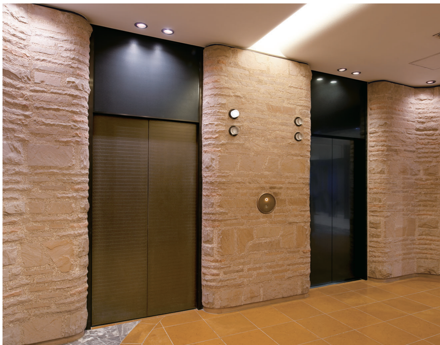
乗用17人乗りエレベーター・ロビー階ホール(左側リニューアル前、右側リニューアル後)

創業30周年を迎えたホテルメトロポリタン エドモントは、飯田橋駅・水道橋駅から徒歩5分、JRと地下鉄5路線が利用できる好立地にあり、大小の宴会場やウエディング施設、幅広いニーズに応える多彩な宿泊プランなど、エドモントならではの“おもてなしの心”が行き届いたサービスで好評を得ています。このほど、エレベーターがリニューアルされました。