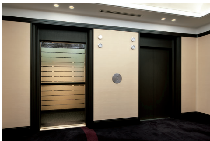
乗用17人乗りエレベーター・3階ホール (左側リニューアル前・右側リニューアル後)