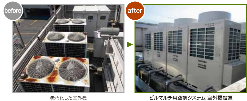
老朽化した室外機