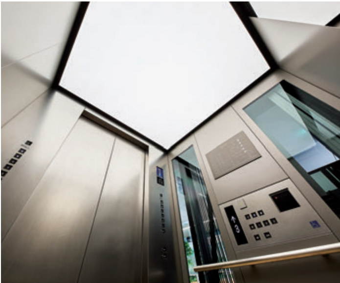
乗用(展望用)20人乗りエレベーター・かご室天井