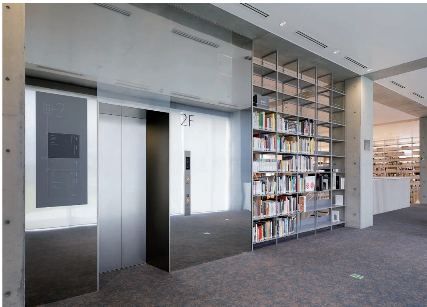
乗用11人乗りエレベーター・2階

金沢工芸大学のキャンパスが2023年秋に移転しました。伝統を愛し、工芸が今も生活の中に息づく街、金沢に1946年に創立、美術・工芸・デザインの各分野で活躍する多くの人材を輩出しています。新キャンパスは、地上3階、地下1階、延床面積37,400㎡、ガラス貼りで開放感のある建物には、学生が集中し自由に創作できるスペースや専門分野の枠をこえて交流できる施設、作品展示のスペースなどが設けられています。