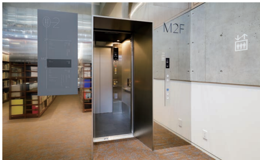
乗用11人乗りエレベーター・M2階