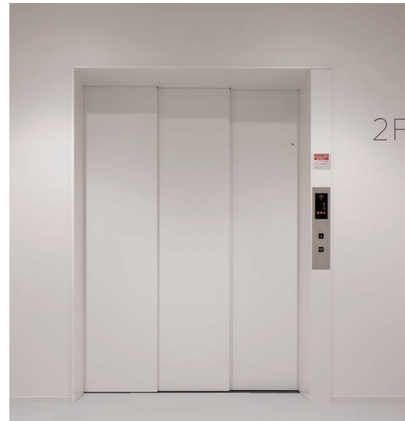
荷物用 積載2,000kg エレベーター・2階