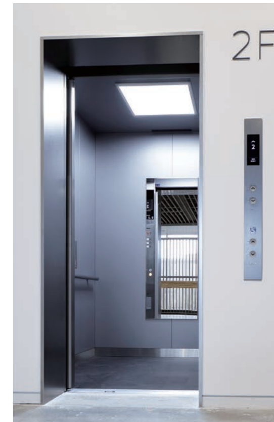
人荷用26人乗りエレベーター・かご室