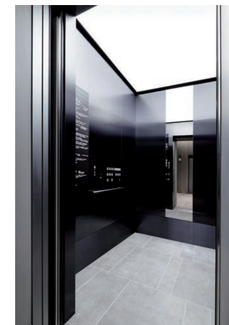
乗用20人乗りエレベーター・かご室