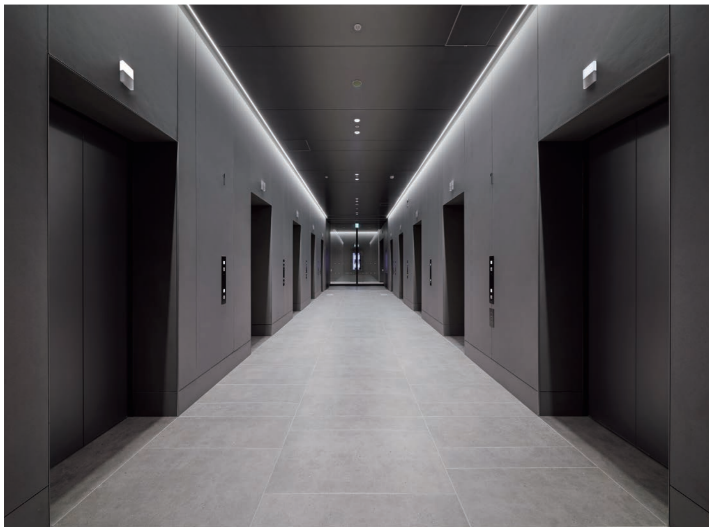
乗用20人乗りエレベーター・1階

2024年に市制100年を迎える川崎市。その本庁舎が施設・設備の老朽化により、建替えられました。地上25階、地下2階の本庁舎は様々な行政機関が入る高層棟と旧本庁舎の一部を復元した低層の復元棟とで構成され、両棟をガラス屋根のかかる3層吹き抜けのアトリウムがつなぎます。最上階には市内が一望できる展望ロビーが設けられ、新たな市のシンボルとなっています。