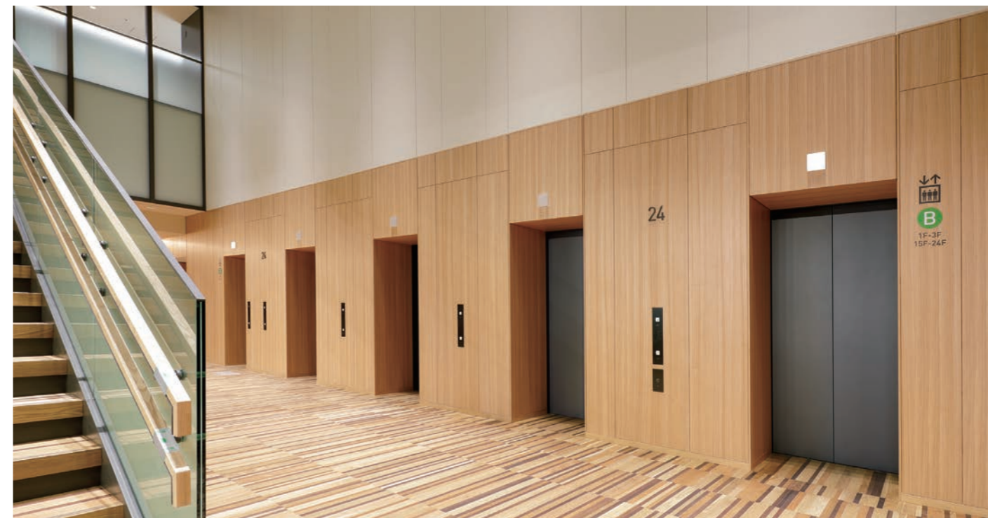
乗用20人乗りエレベーター・24階