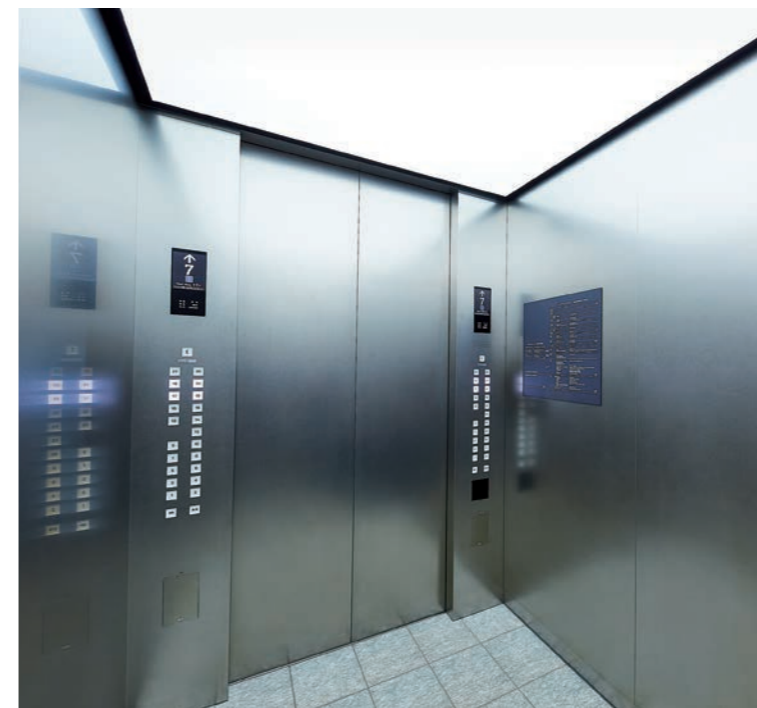
乗用30人乗りエレベーター・かご室