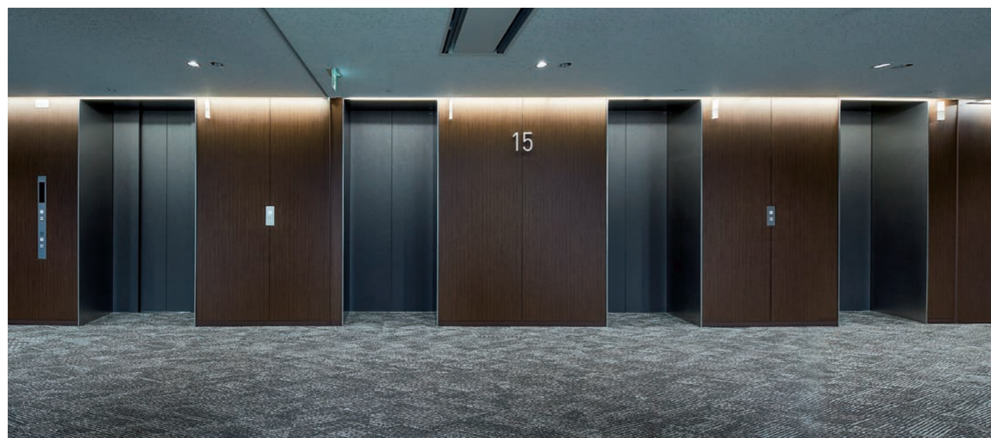
乗用30人乗りエレベーター・15階