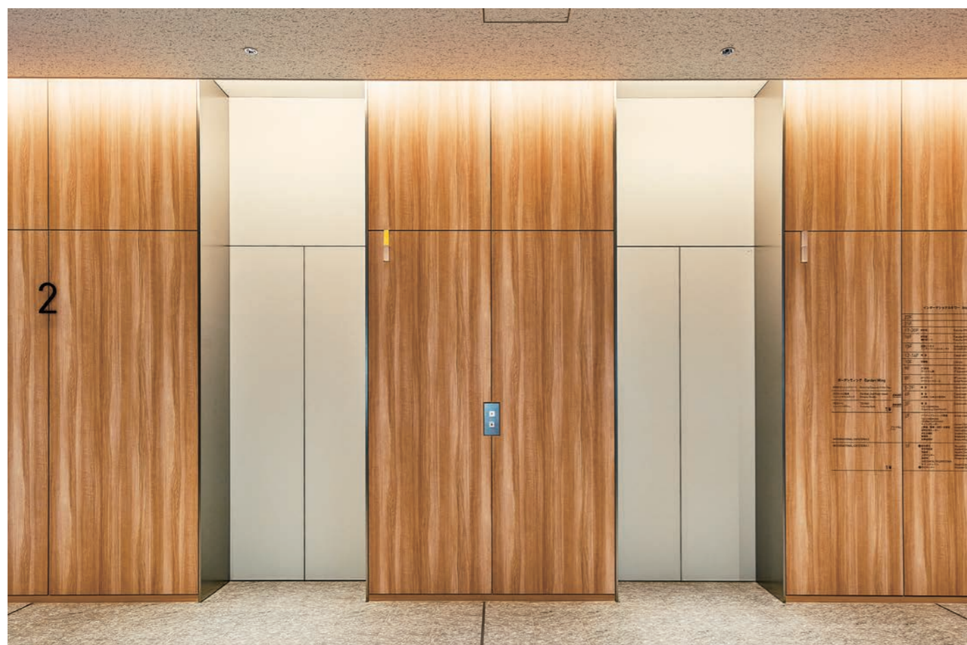
乗用30人乗りエレベーター・2階

1965年に創立され、世界100か国から留学生を受け入れている東京国際大学。この秋、4,000人の学生を収容する池袋キャンパスがオープンしました。地上22階建てのインターナショナルタワーと4階建てのガーデンウイングで構成されています。学修と交流のスペース「TIU COMMONS」では、日本人学生と留学生が交流を深め、日本にいながらも留学しているようなグローバル環境に触れることができます。