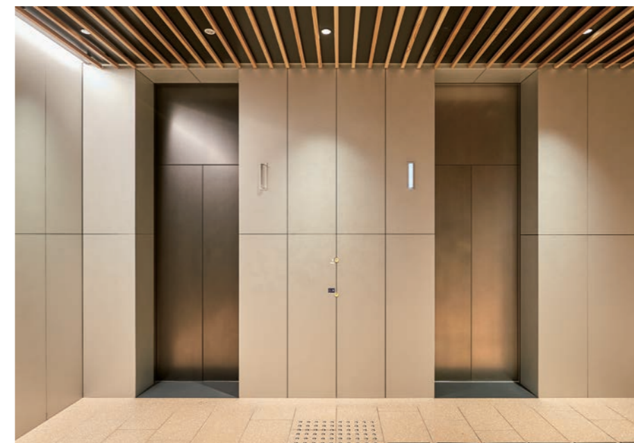
乗用15人乗りエレベーター・1階ホール (古町ルフル)