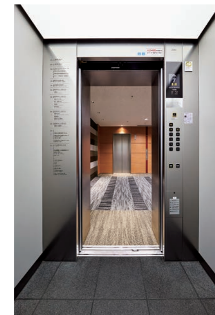
乗用15人乗りエレベーター・かご室 (古町ルフル)