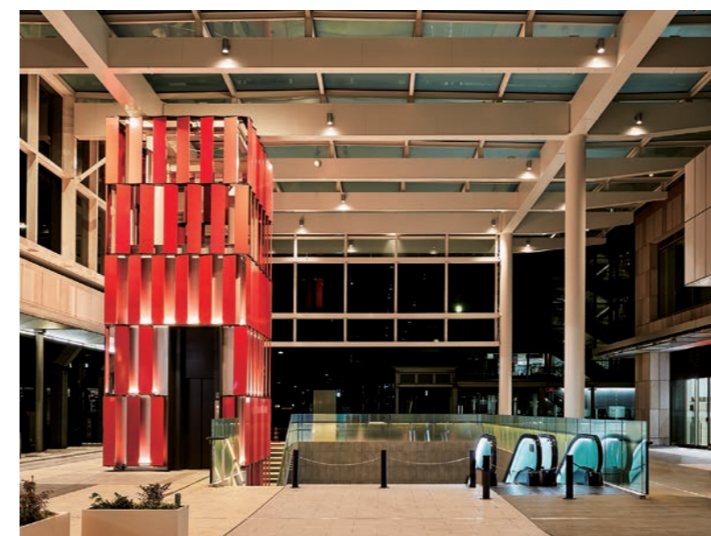
乗用13人乗りエレベーター昇降路・エスカレーター (古町ルフル広場)