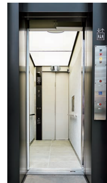
乗用13人乗りエレベーター・かご室 (古町ルフル広場)