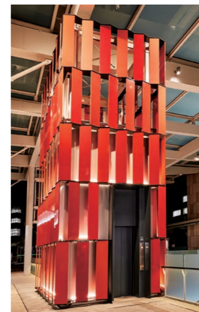
乗用13人乗りエレベーター・昇降路 (古町ルフル広場)