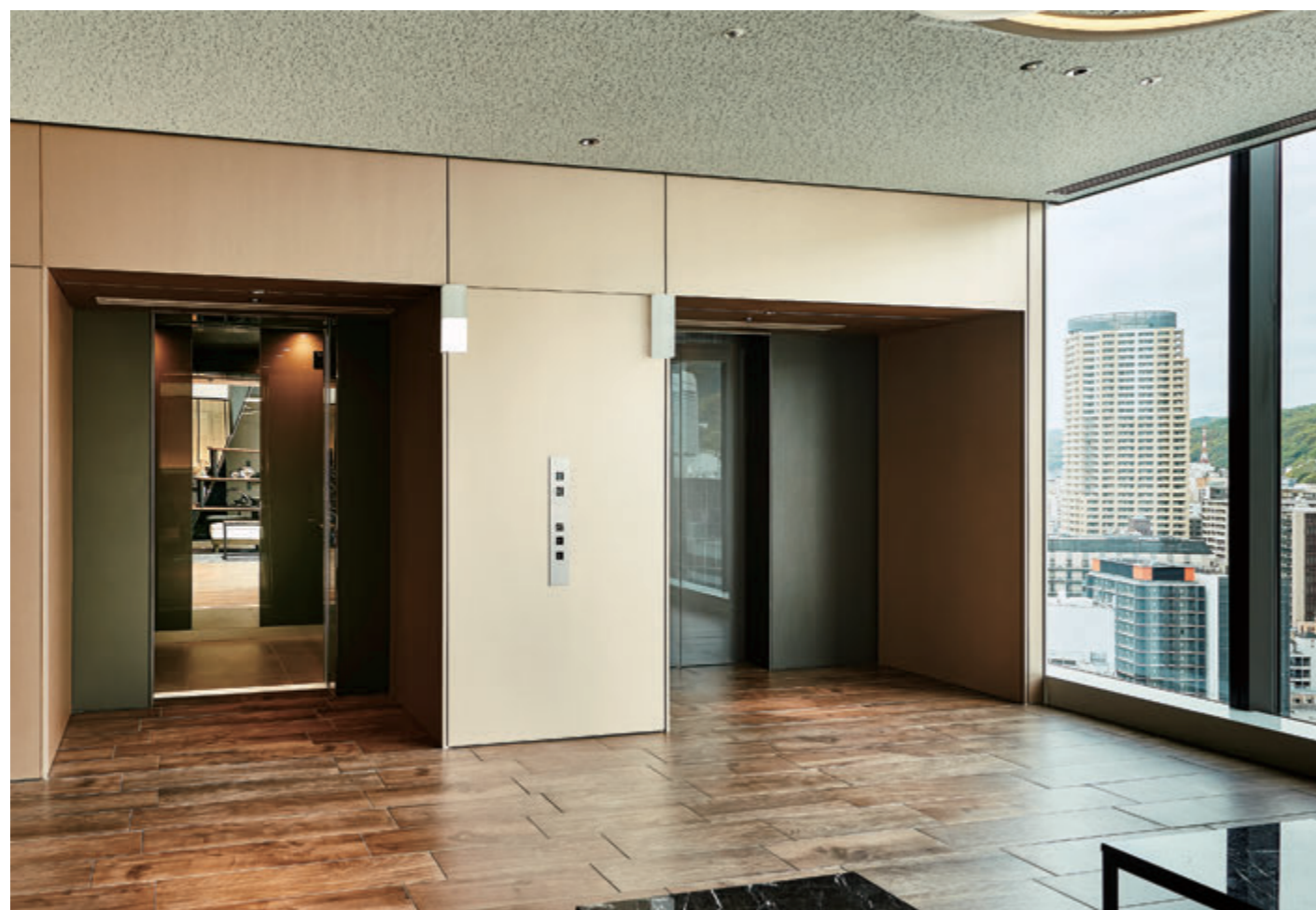
乗用(展望用)15人乗りエレベーター・ロビー階ホール(レムプラス神戸三宮)

阪急神戸三宮駅に、永く市民に親しまれてきた旧神戸阪急ビル東館のデザインイメージを継承した「神戸三宮阪急ビル」が、地上29階、地下3階の最新の高層ビルに生まれ変わりました。高層階には、阪急阪神ホテルズの新ブランド高級ホテル「レムプラス神戸三宮」がオープン、阪急神戸三宮駅をはじめ、商業施設やオフィスが入居します。