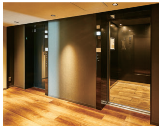
乗用15人乗りエレベーター・28階ホール(レムプラス神戸三宮)