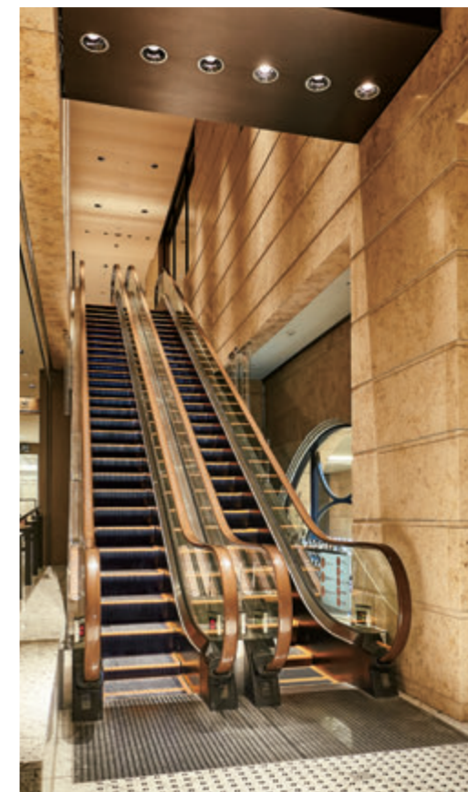
エスカレーター・2階