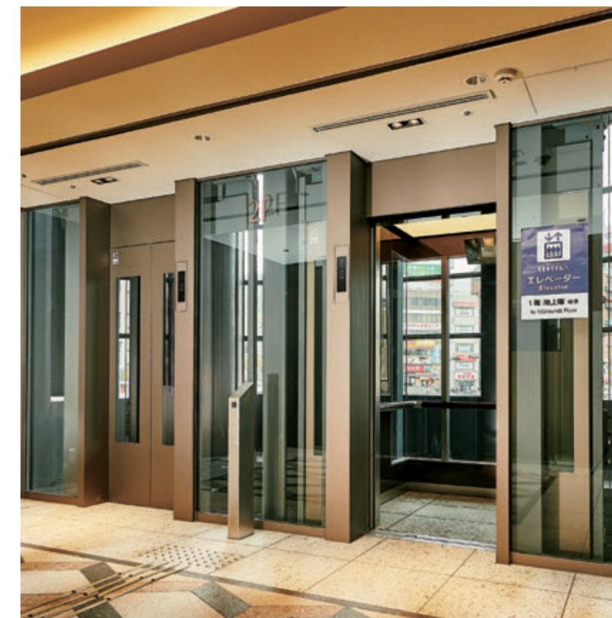
展望用11人乗りエレベーター・2階ホール