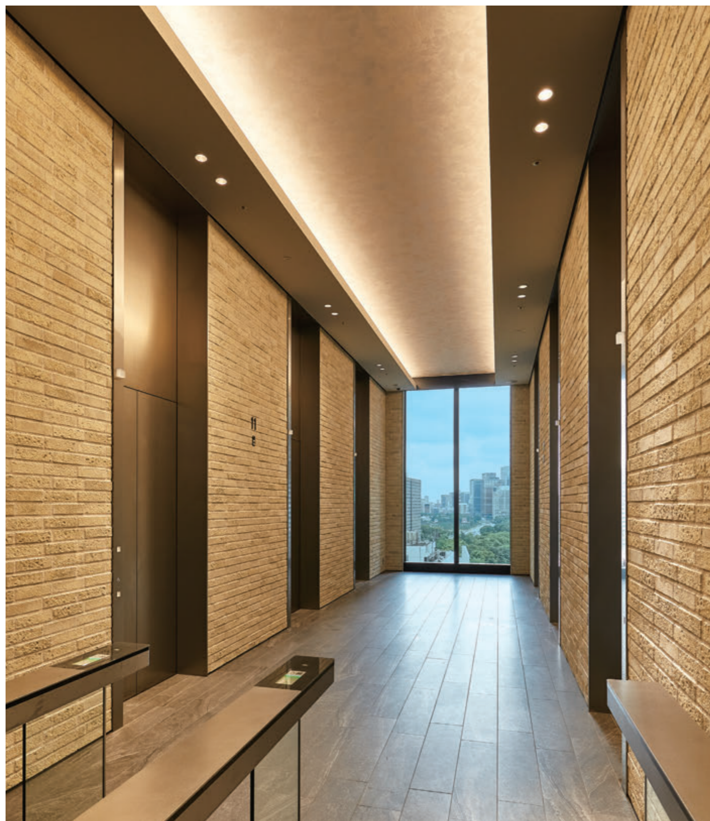
乗用27人乗りエレベーター・11階エレベーターホール

「日比谷フォートタワー」は、日比谷・霞が関・虎ノ門・新橋の中心に位置する、地上27階、地下2階の超高層オフィスビルです。東京タワーや都心の緑が見える、地上約50mに設置されたスカイロビーからオフィスフロアへスピーディーに移動が可能です。また、災害などで停電した場合でも、共用部に72時間の電力供給が可能、浸水対策や防災備蓄倉庫など、先進のBCP機能も充実しています。