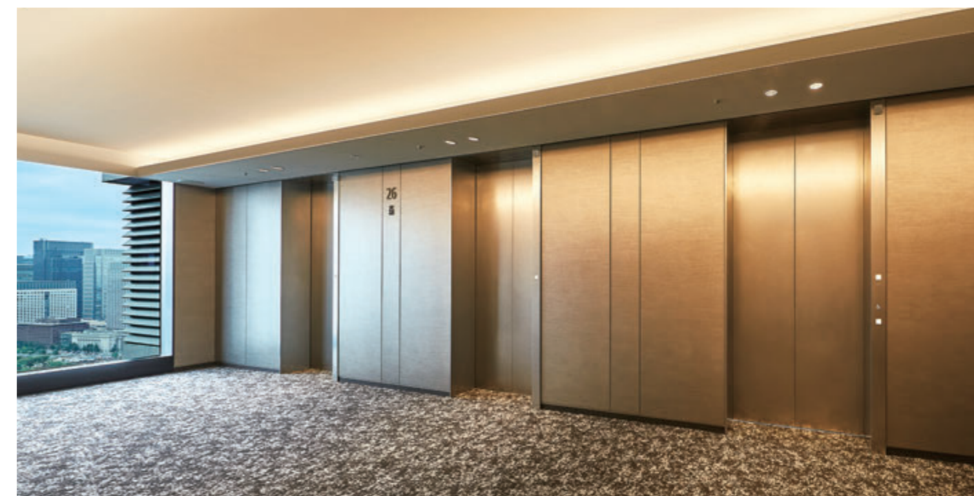
乗用27人乗りエレベーター・26階エレベーターホール