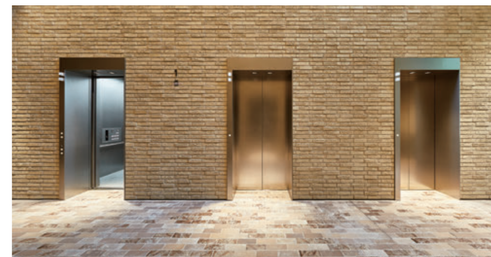
乗用27人乗りエレベーター・1階エレベーターホール