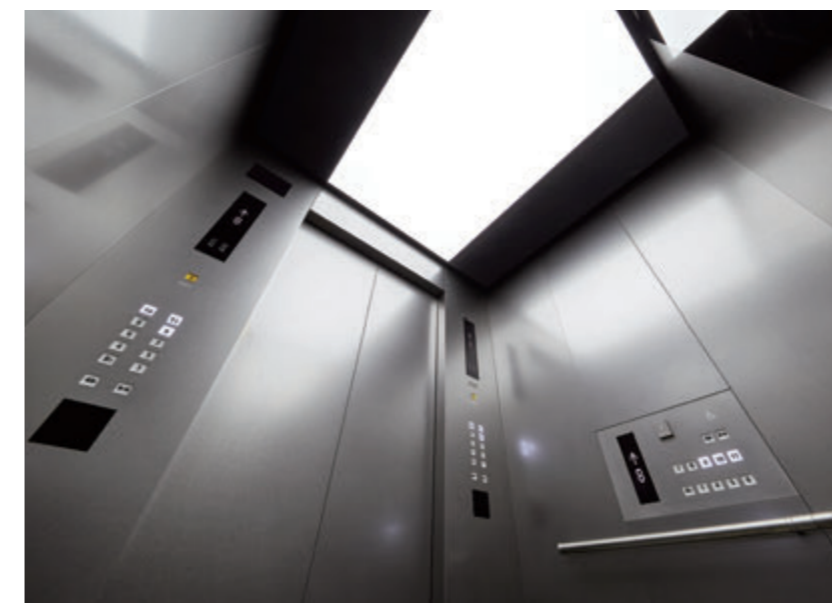
乗用27人乗りエレベーター・かご室天井