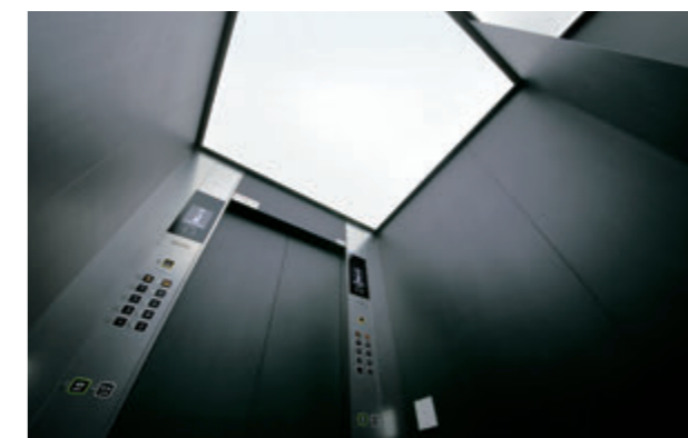
乗用15人乗りエレベーター・かご室天井