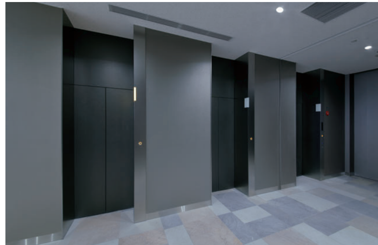
乗用15人乗りエレベーター／乗用(非常用)17人乗りエレベーター・1階ホール