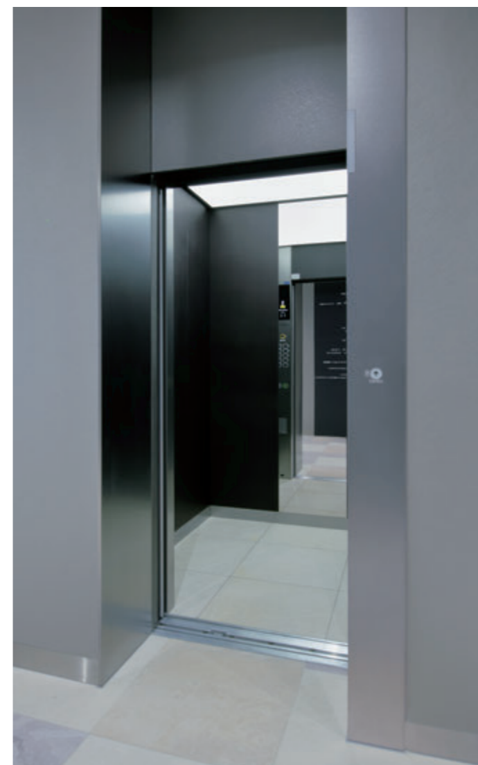
乗用15人乗りエレベーター・かご室