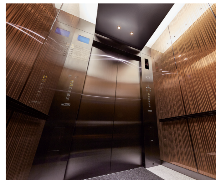
乗用34人乗りエレベーター・かご室