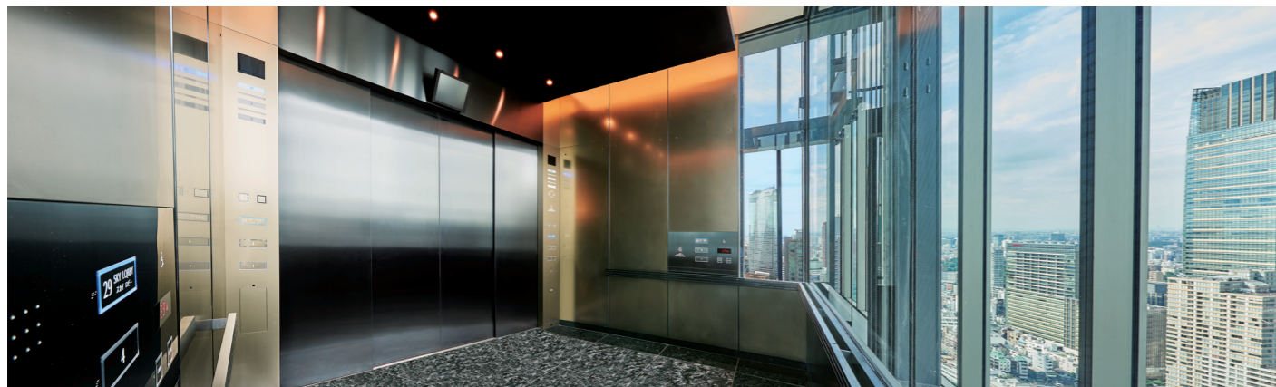
展望用90人乗りエレベーター(シャトルエレベーター)・かご室