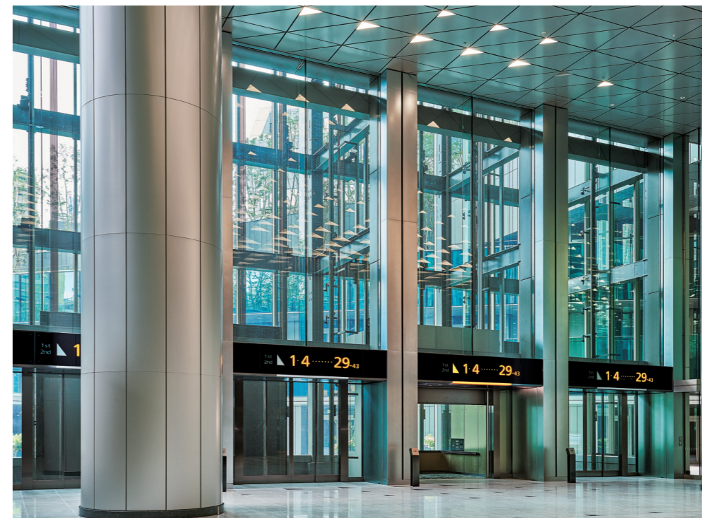
展望用90人乗りエレベーター(シャトルエレベーター)・1階ホール