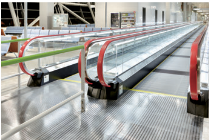
S1000形新形動く歩道・のりば