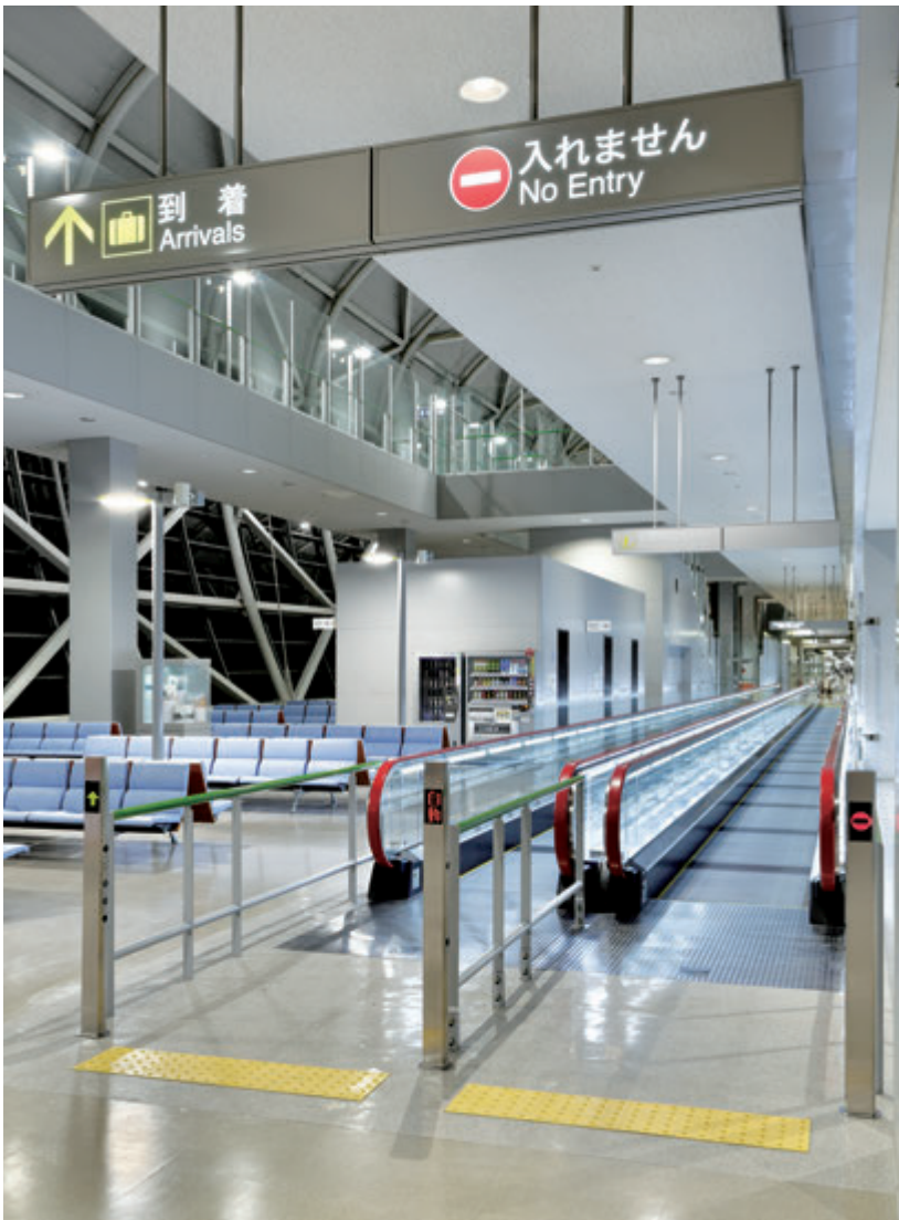
S1000形新形動く歩道・外観

関西空港は大阪湾内の人工島に作られた海上空港で、1994年に開港しました。国内の拠点空港では初めて旅客・貨物便の設備の刷新が始まり、2017年2月末までに第1ターミナルビルの12台の動く歩道がリニューアルされる予定です。