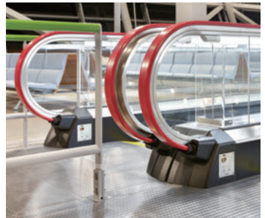
S1000形新形動く歩道・欄干