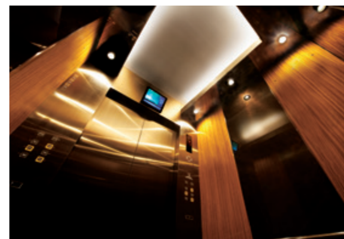
乗用30人乗りエレベーター・かご室天井