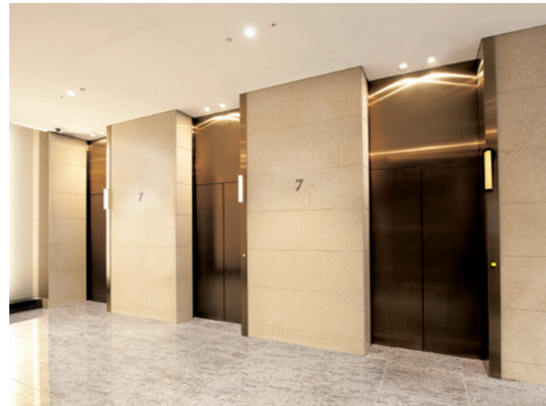
乗用30人乗りエレベーター・7階ホール