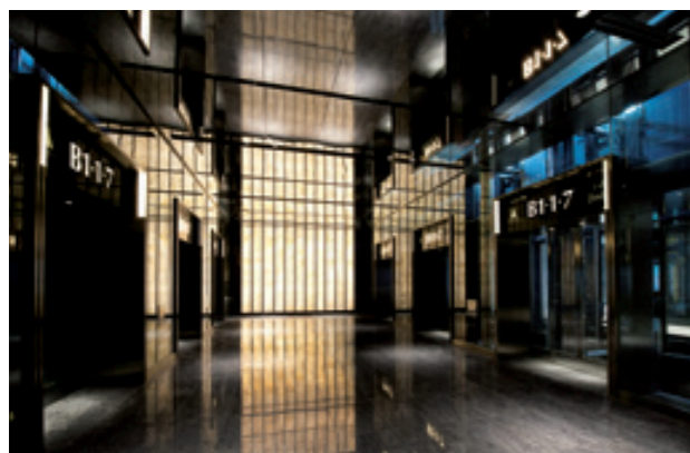
展望用70人乗りシャトルエレベーター・地下1階ホール