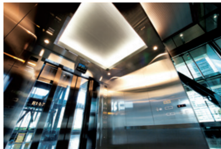
展望用70人乗りシャトルエレベーター・かご室天井