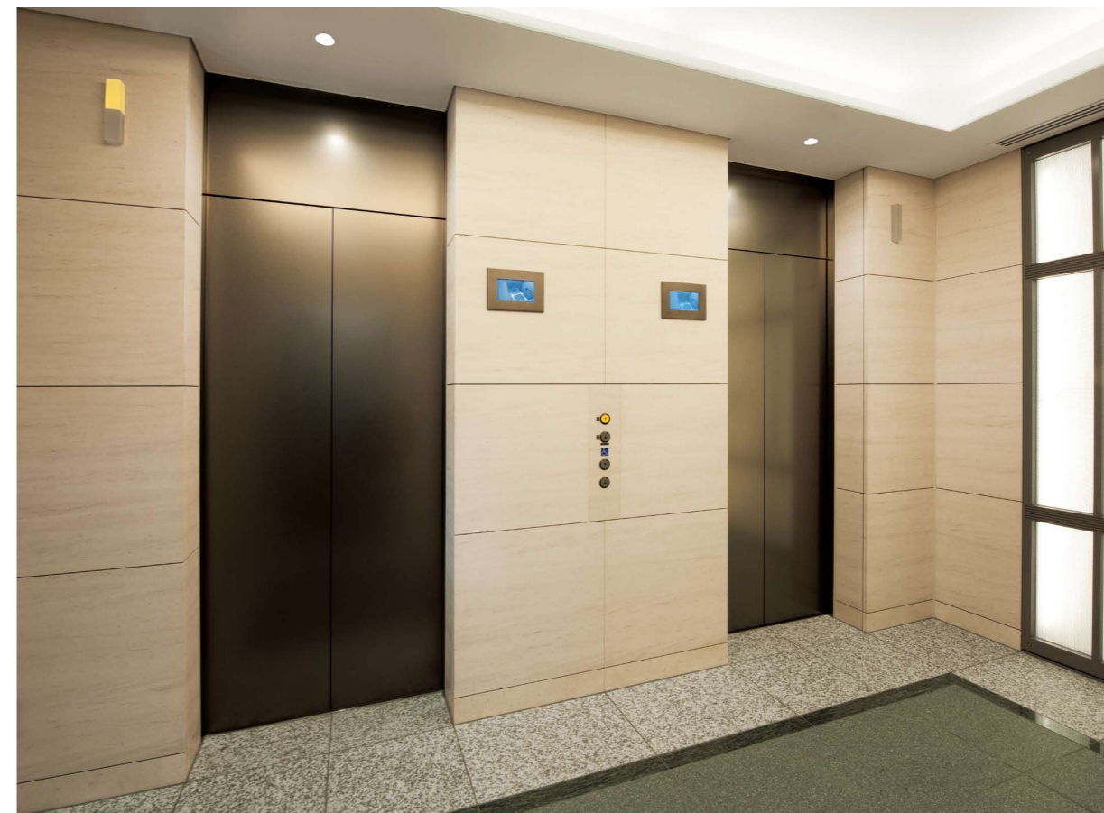
乗用11人乗りエレベーター・1階のりば