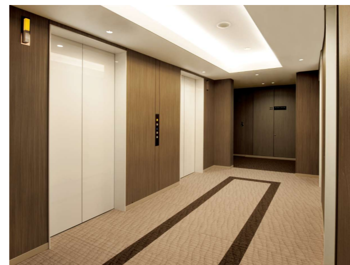
乗用11人乗りエレベーター・22階ホール