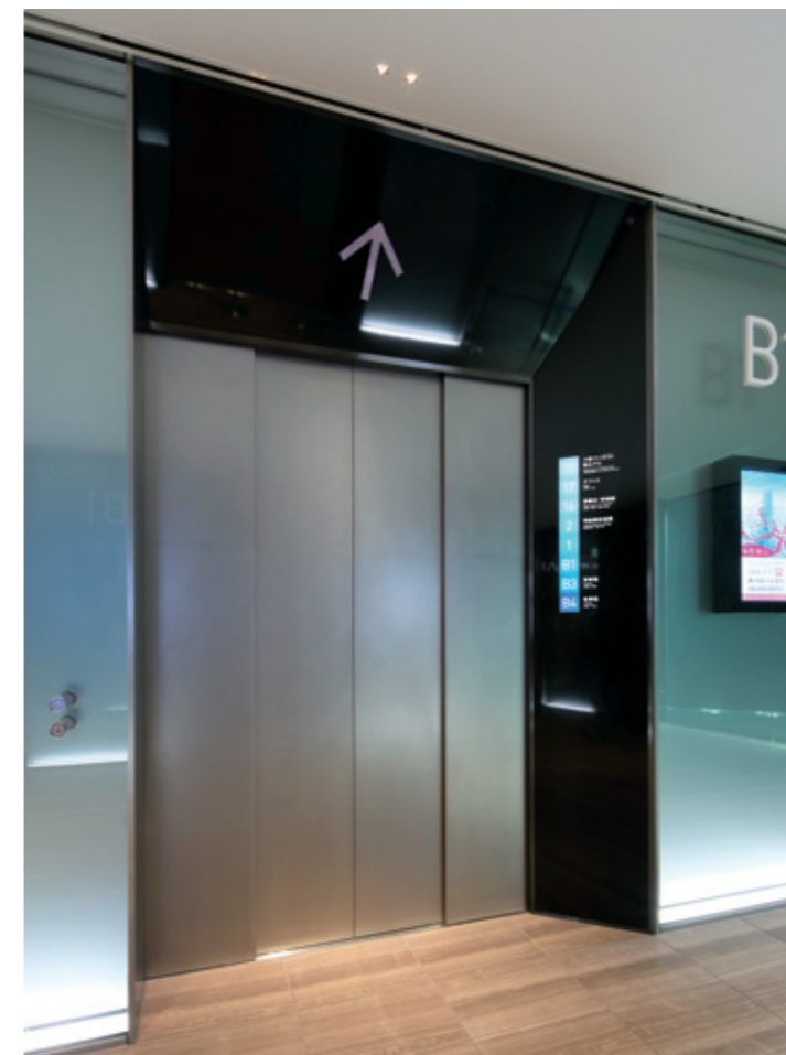
シャトルエレベーター・地下1階のりば