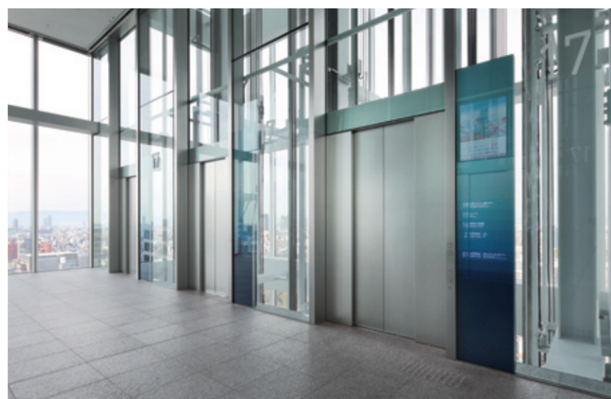
シャトルエレベーター・17階ホール