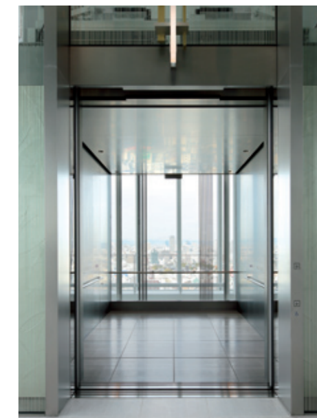
シャトルエレベーター(展望用)・かご室