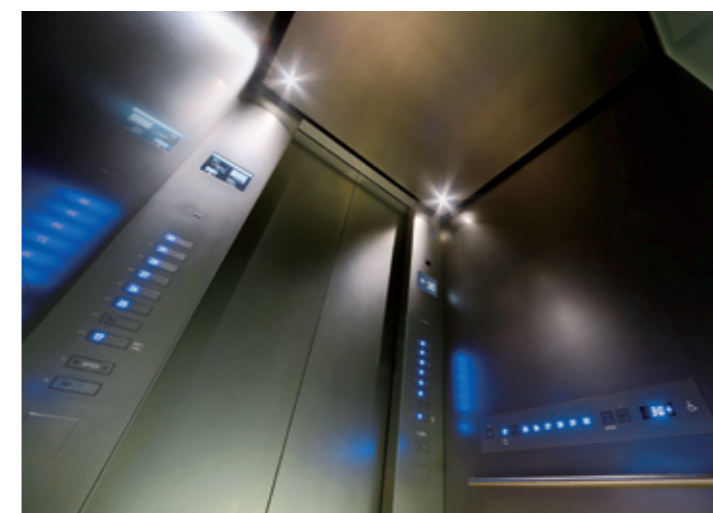
オフィス用エレベーター・かご室天井