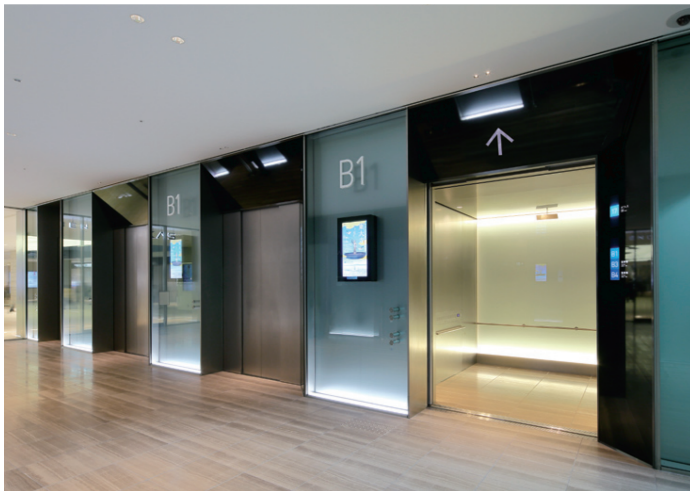
シャトルエレベーター・地下1階ホール

大阪市の南の玄関口・あべの／天王寺ターミナルに誕生した「あべのハルカス」は地上60階・300m、日本一の高さを誇る超高層複合ビルです。近鉄百貨店を核テナントとする、オフィス、美術館、ホテル、展望台などで構成され、中層階を占めるオフィスは、近鉄大阪阿部野橋駅に直結する地下1階と高速・大容量エレベーターでダイレクトに結ばれています。