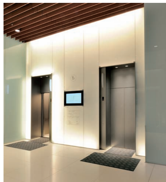
乗用(展望用)24人乗りエレベーター・1階のりば