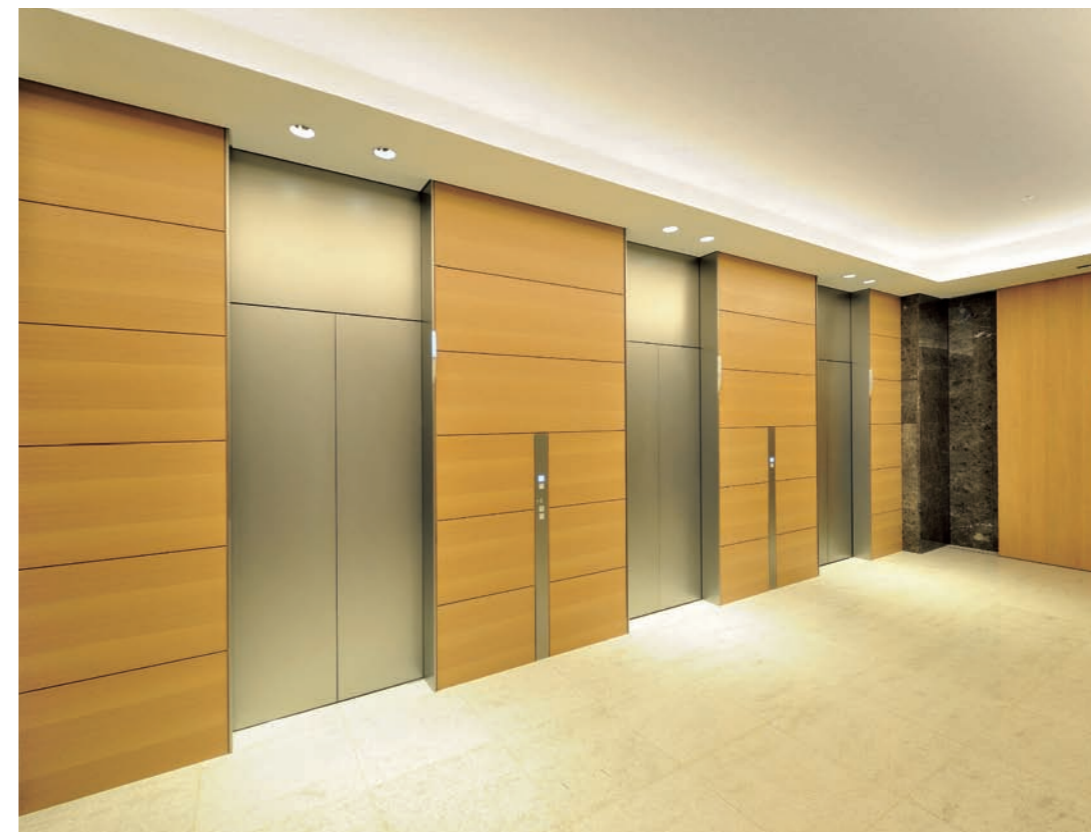
乗用20人乗りエレベーター・1階のりば