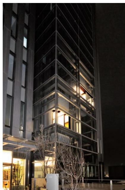
乗用(展望用)24人乗りエレベーター・昇降路外観