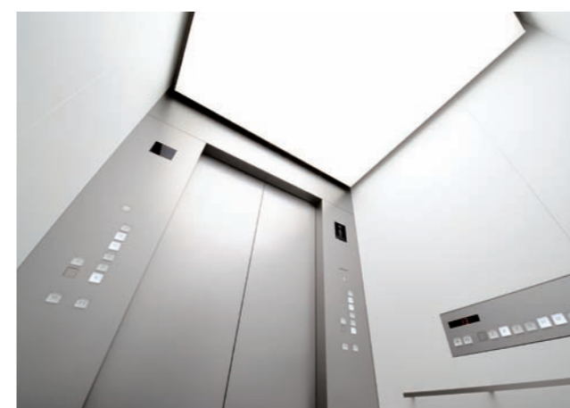
乗用20人乗りエレベーター・かご室天井