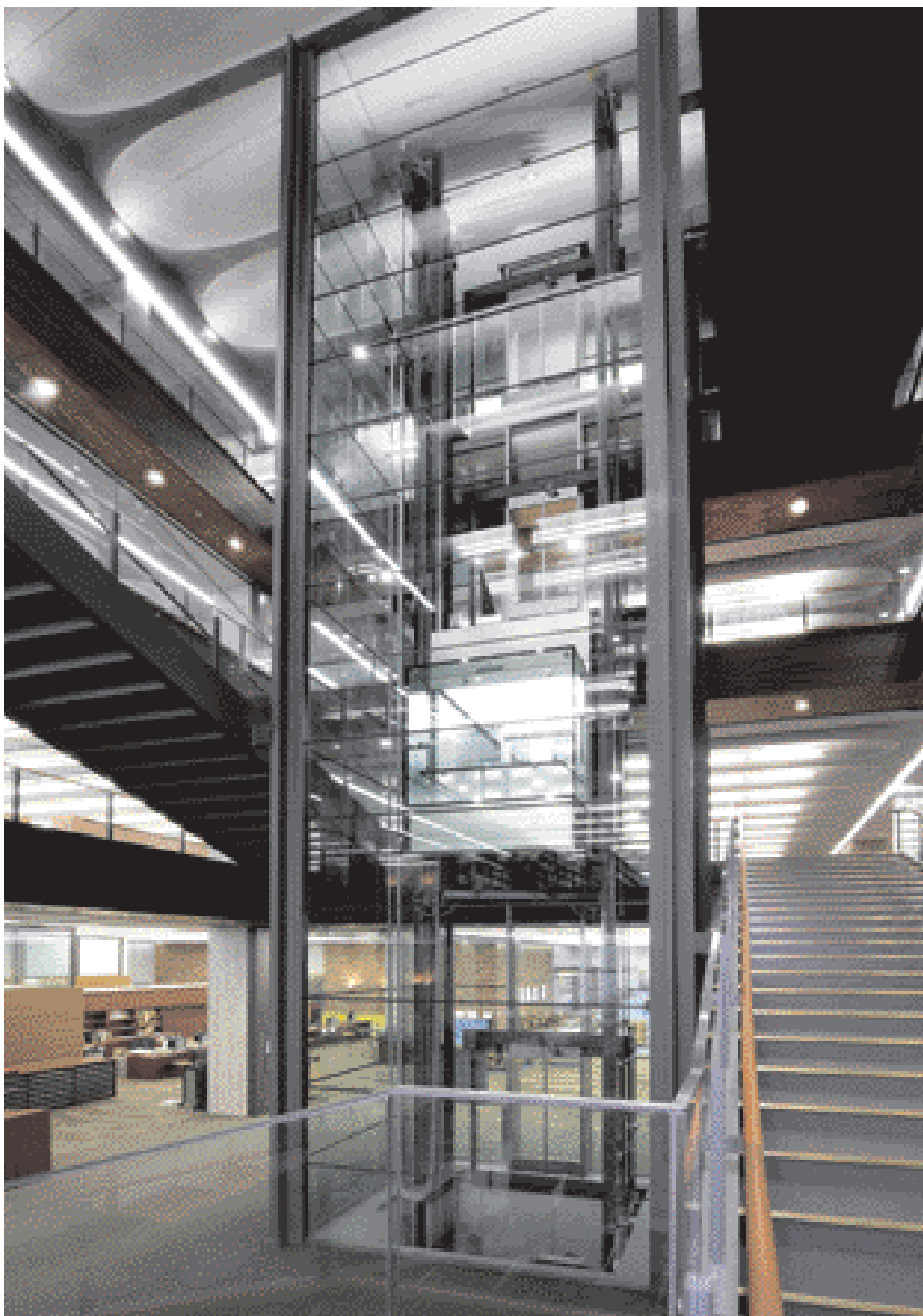
展望用20人乗りエレベーター・外観

施設整備が進む立教大学池袋キャンパスに建設されたロイドホール(18号館)に、最大収蔵冊数200万、閲覧席数1520という国内屈指の規模を誇る池袋図書館がオープンしました。地下2階～地上3階を占める広大なフロアには、多様な学習ニーズに応える設備のほか、リフレッシュルームやテラスなども設置され、機能的で快適な学習環境となっています。