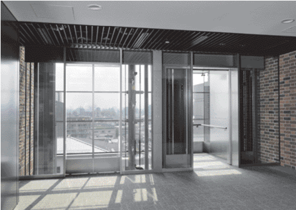
展望用17人／15人乗りエレベーター・7階ホール