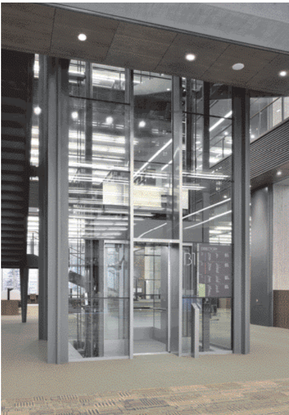
展望用20人乗りエレベーター・地下1階ホール