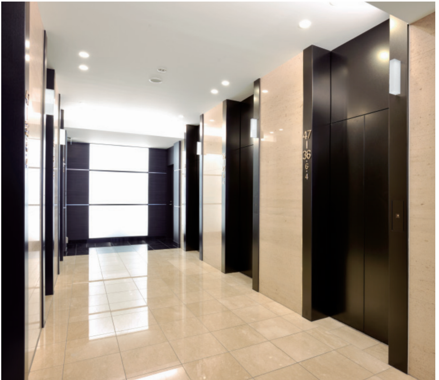
乗用11人乗りエレベーター・3階ホール

「シティタワーズ豊洲 ザ・ツイン」は、銀座一丁目駅まで5分、東京駅まで9分と抜群の交通アクセスを誇る豊洲に建設された快適性や健全性を追求する48階建ての分譲マンションです。未来都市を思わせるガラスカーテンウォールの外壁と垂直方向への伸び上がりを強調するフレームワークで構成された建物外観は、町並みにきわだつ存在感を感じさせます。