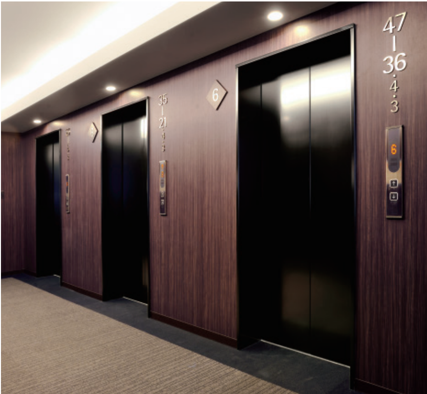
乗用11人乗りエレベーター・6階ホール