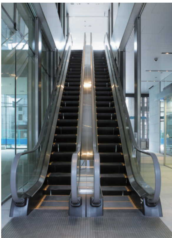
エスカレーター（踏段下照明）