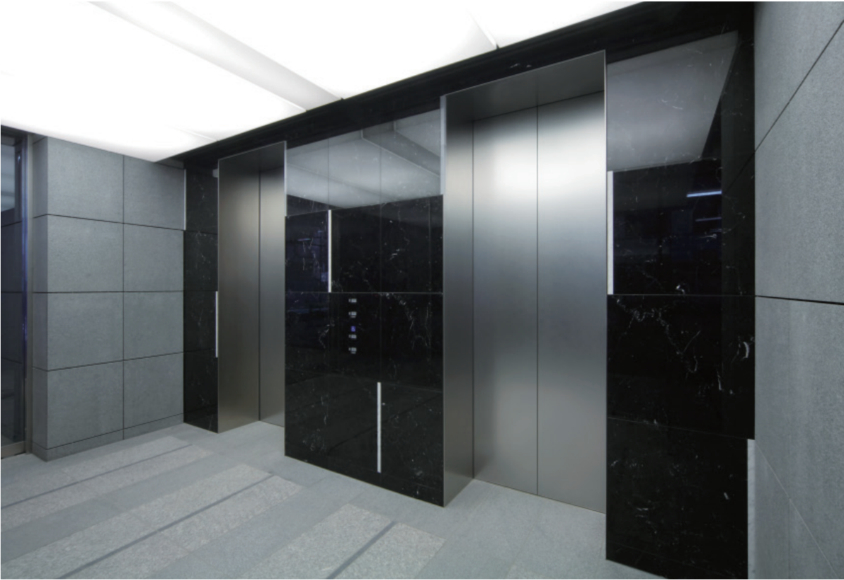
エレベーター・1階のりば