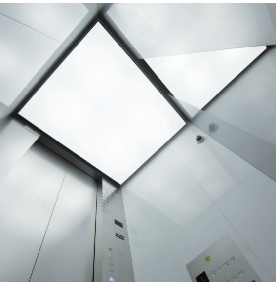
エレベーター・かご室